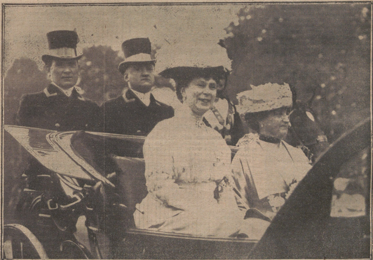
La Reina de Inglaterra, etc.

Mañana llegará el cónsul de Colombia en Cádiz y varias Comisiones.