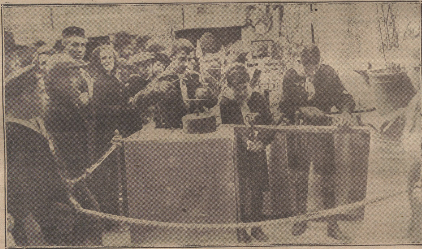
LA ASAMBLEA NACIONAL DE EXPLORADORES.—Grupo de exploradores trabajando en la Exposición de trabajos manuales.

Al regresar fué cumplimentada la augusta señora por los marqueses de Valterra y condesa de Aybar.