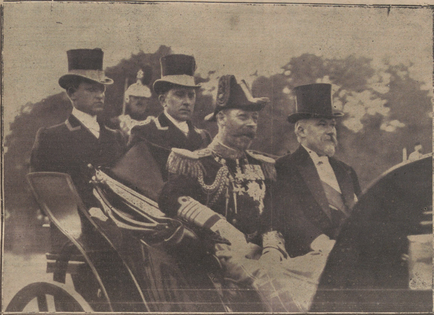
El Rey Jorge de Inglaterra, acompañado del Presidente de la República Francesa, á su llegada á París.

París se ha engalanado con banderas y gallardetes para recibir al Rey Jorge V y á su esposa la Reina Alejandra. Hay en el recibimiento que preparan los parisienses algo de obligada cortesía, un no sé qué de entusiasmo fingido, y se echa de menos la espontaneidad de los agasajos, la ruidosa alegría por la visita. En vano los periódicos se esfuerzan en despertar lo que París no siente, diciendo que la venida de los reales esposos redundará en beneficio de la «entente»; París no acaba de creer en la «entente», y, en cambio, ve que, tanto el Rey como la Reina, son enemigos suyos en el terreno comercial.