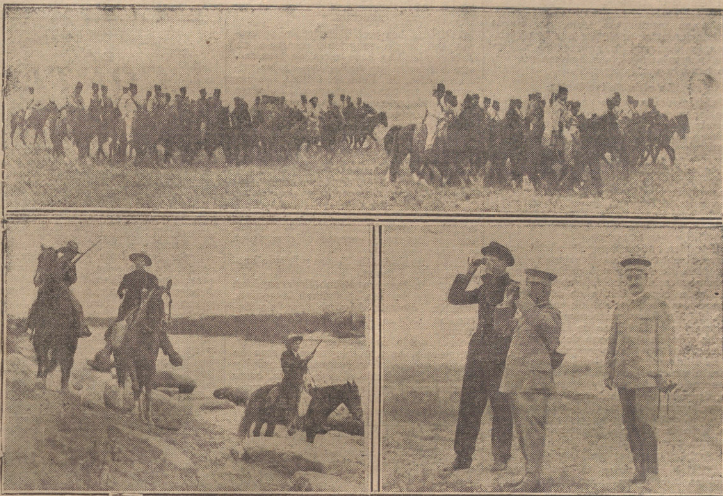
Un escuadrón de Caballería federal disponiéndose a entrar en combate.—Debajo, una patrulla en la frontera de Méjico, vigilando la orilla del río Grande.—Los generales federales Alvarez y Quintana, que dirigen la defensa de Torreón.