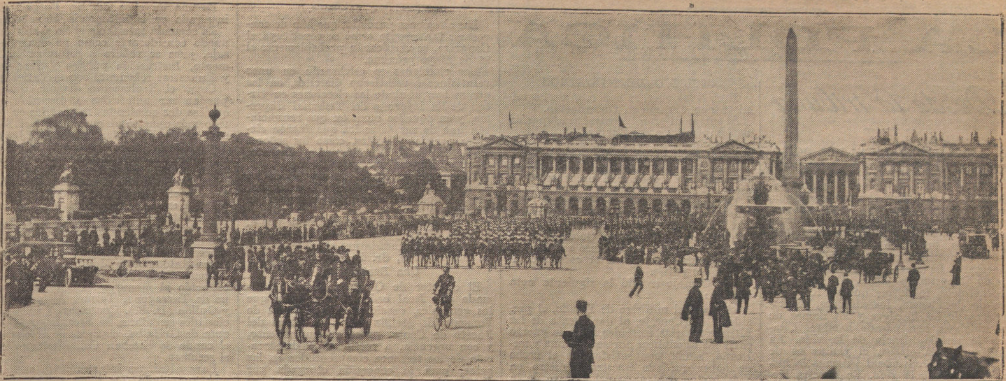
LOS REYES DE INGLATERRA EN PARÍS.—El cortejo real dirigiéndose a las maniobras de Vincennes, al pasar por la plaza de la Concordia.