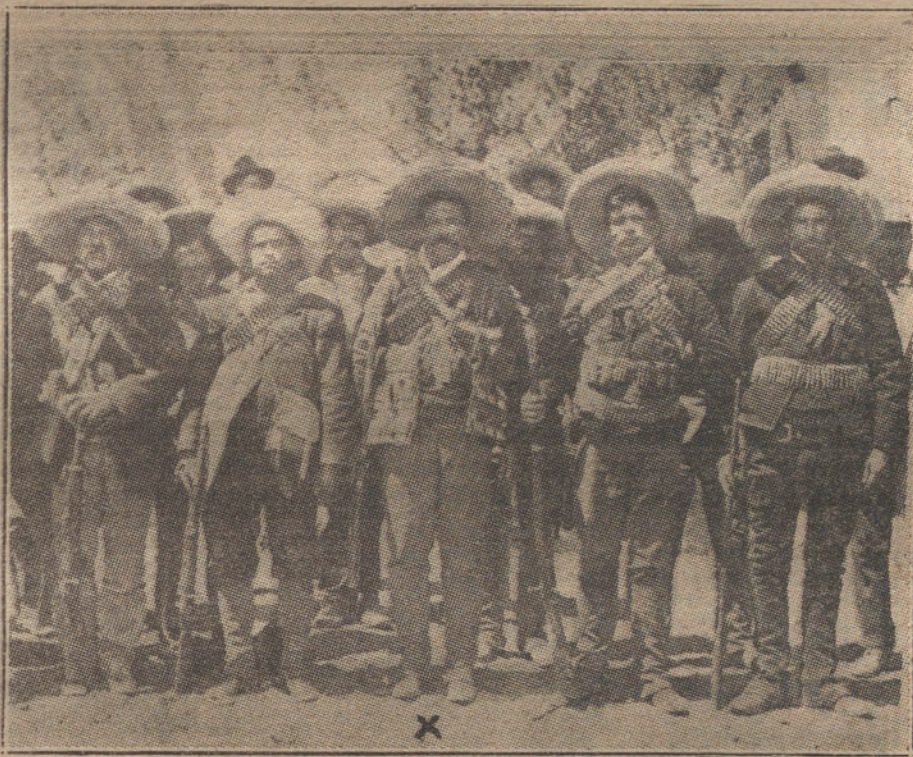
Pancho Villa y su Estado Mayor.

NUEVA YORK. Las tropas mejicanas federales han saqueado é incendiado la población de Nueva Laredo.