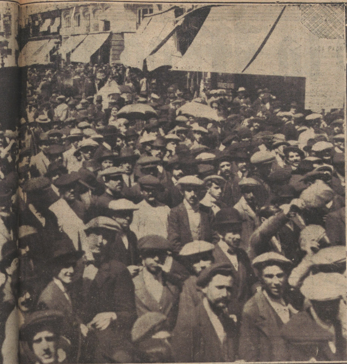
Manifestación obrera pasando por la Puerta del Sol.

8.ª Si el aviador quisiera mejorar la prueba, puede repetir el vuelo, siempre que sea en los días comprendidos en la condición 4.ª, estimándole para el Concurso el mejor de los efectuados.