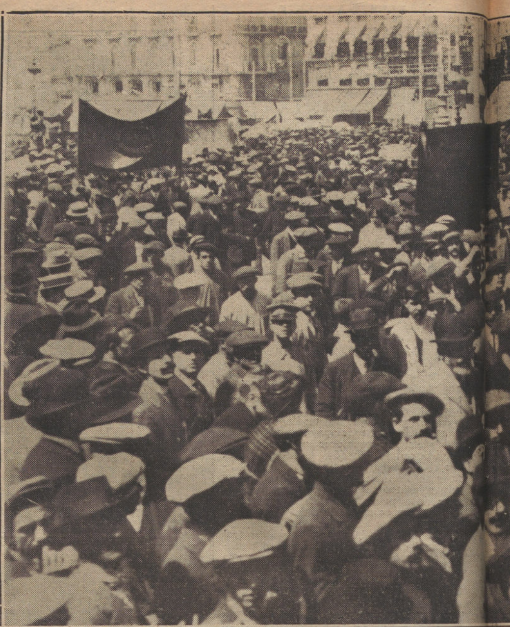
LA FIESTA DEL TRABAJO.—La manifestación sobre

La Academia se trasladará al Campamento de los Alijares en el momento en