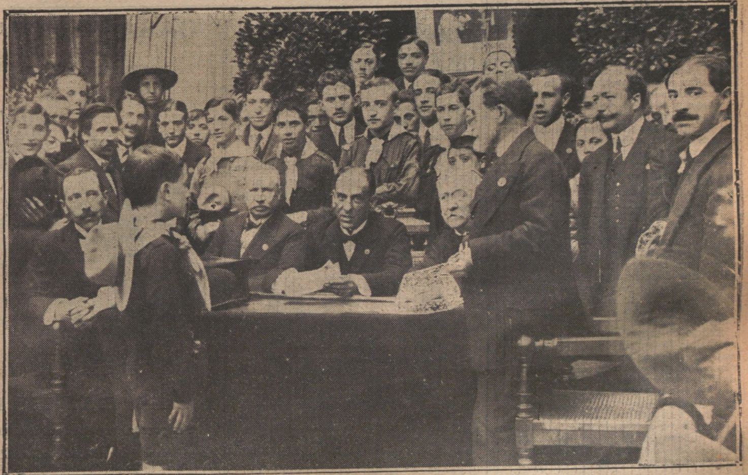
Reparto de premios á los exploradores que más se distinguieron en la Exposición de trabajos manuales.