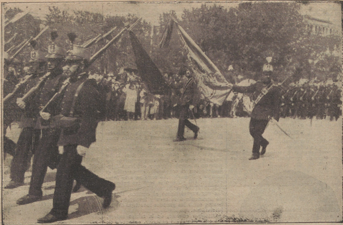
EL DOS DE MAYO.—Las banderas saludando al pasar por delante del Obelisco.