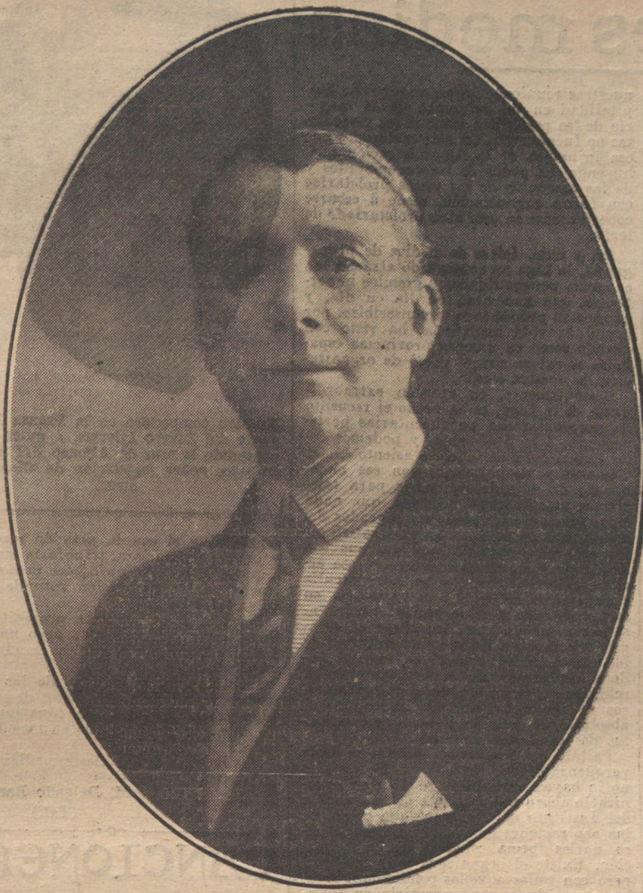
El eminente actor Fernando Díaz de Mendoza, que celebró anoche su beneficio en el teatro de la Princesa.

Han reembarcado casi todos los marinos que guarnecían Veracruz. Quedan sólo en la plaza 3.000 hombres al mando de Fuentun.—Strong.