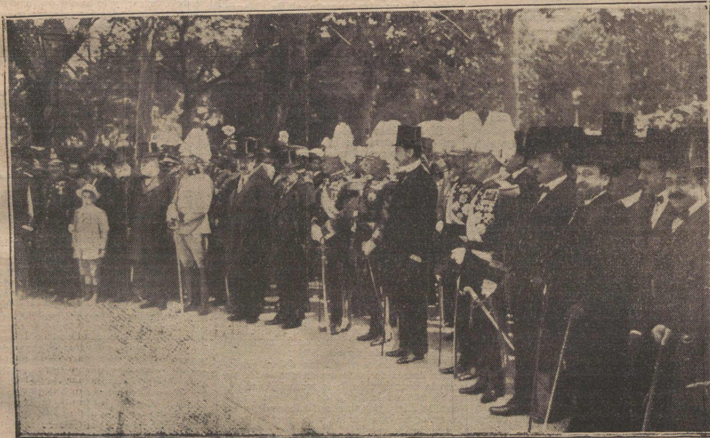
Las autoridades presenciando el desfile de las tropas junto al Obelisco del Dos de Mayo.

Según comunican las respectivas autoridades, no ocurre novedad.