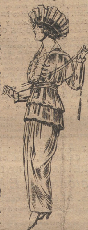
Vestido de seda, negro o azul, para señora. De pesetas 85 a 90.