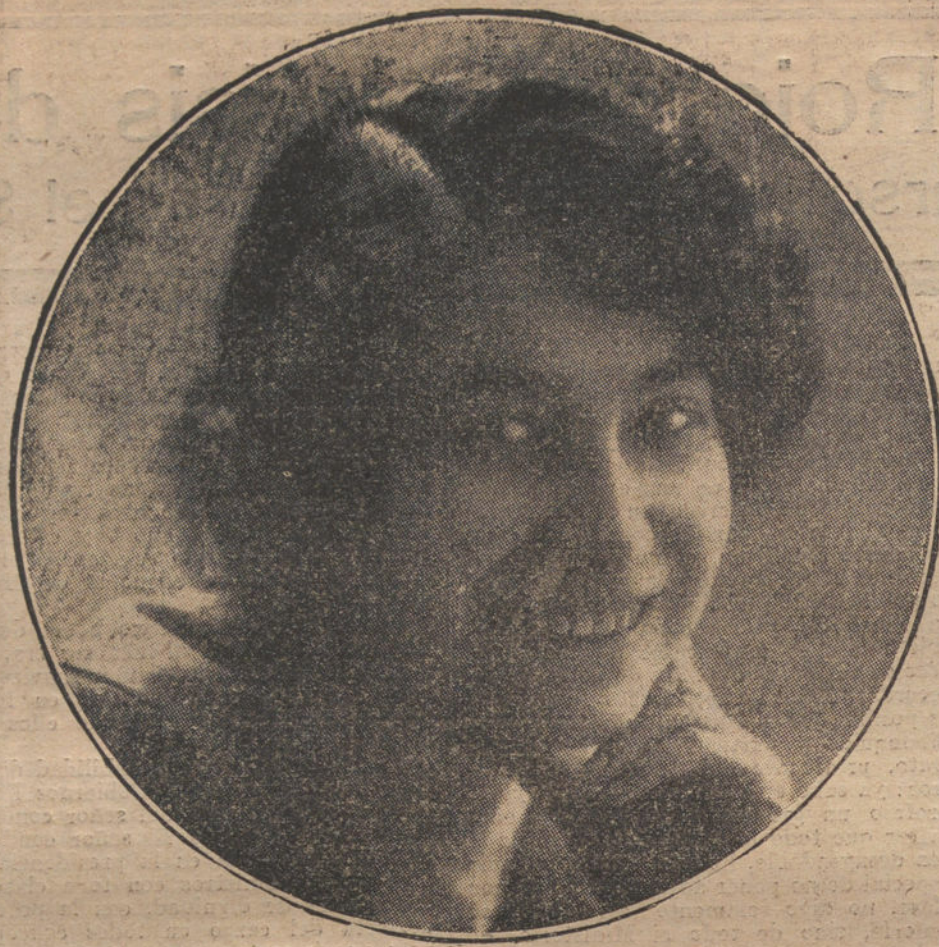
MARGARITA XIRGU, primera actriz de la compañía que se presentará al público el día 8, en el teatro de la Princesa.

No. En este mismo salón, que entonces no era de Cámara legislativa en el ejercicio pleno de sus prerrogativas constitucionales; este es el salón en que se reunió el partido conservador en Enero de 1913, aquí en este mismo lugar; y ¿á qué? A decirle al Sr. Maura si lo que iba á hacer en Octubre, é hizo, era lo que quería el partido que hiciera, pues era persona bastante delicada para no arrastrar á una actitud que pudiera ser discutida, y puso en manos de los últimos presidentes de las Cámaras conservadoras, del Sr. Dato y del Sr. Azcárraga, una carta, un documento bien expresivo, si queréis que os diga más expresivo todavía que el documento que yo he llamado «Libro Rojo», y que tiene en su última página el documento de Octubre de 1913. Es decir, que aquel hombre, conocedor perfecto de la situación de las cosas, comprendiendo quizá, nada más que por sonrisas ó por medias frases, que podía haber dentro del partido un movimiento de discrepancia, aquel hombre dejó el problema íntegro en manos del partido conservador, y primero se reunieron los ex ministros, y después se reunió aquí el partido conservador, representado por todos los diputados conservadores de las minorías liberales-conservadoras de aquellas Cortes liberales... y no quiero decir