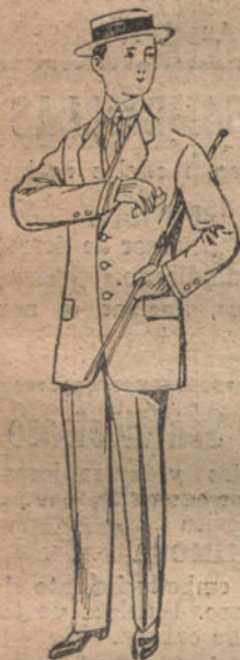
Trajes de lanilla, vicu- ña, etc., para niños de 10 a 16 años. De pesetas 14 a 48.