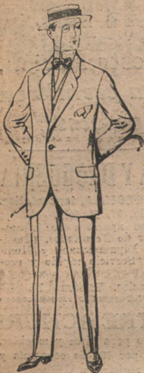
Trajes de lanilla y che- viot, etc. De pesetas 17,50 a 70.