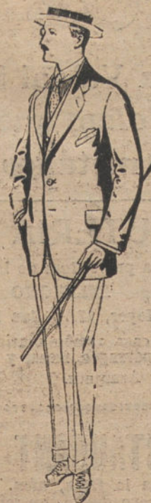
Trajes de alpaca, ne- gra. De pesetas 32 a 56.