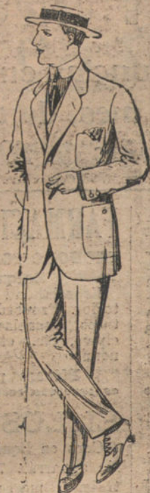
Trajes del drill crudo, kaki o listado. De pes- etas 10 a 32.