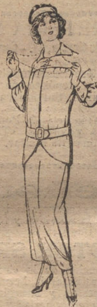
Trajes de lanilla para jóvenes de 13 a 15 años. De pesetas 37 a 46.