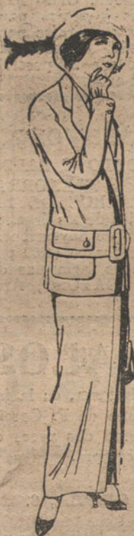
Trajes de jerga azul o negra y gé- neros novedad, para señora, a pe- setas 60 y 65.