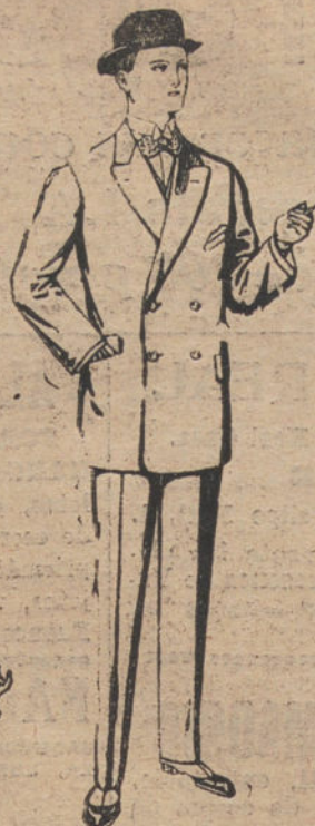
Trajes de vicuña o jer- ga, negros y azules. De pesetas 35 a 72.