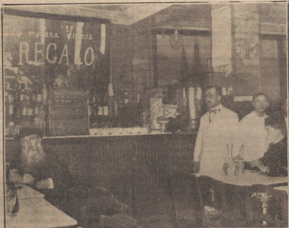
Vista parcial del interior del bar «Las Tres Amapolas». (Véase la información.)

lones de tertulia y billares del piso entresuelo.