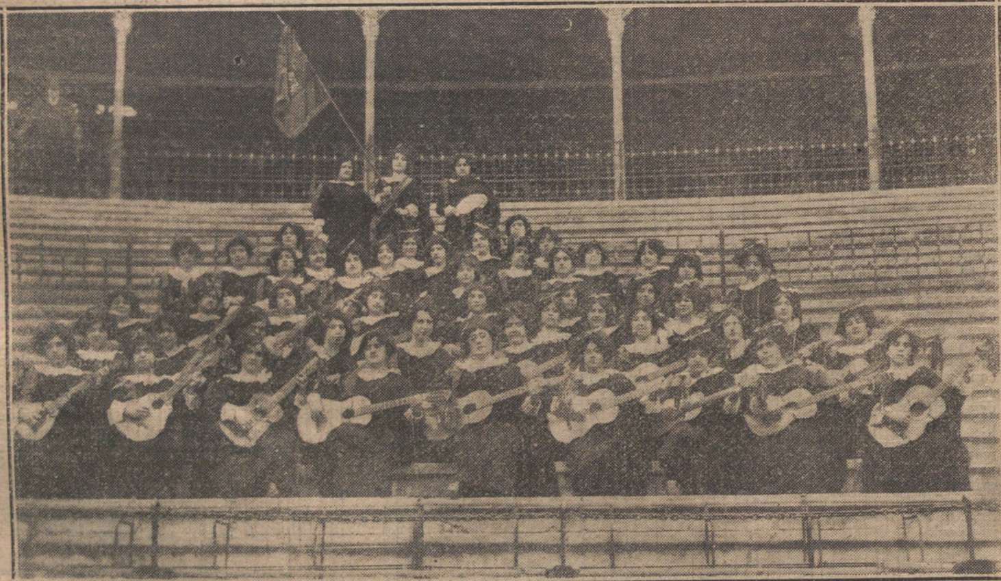
Grupo de hermosas señoritas murcianas que postularon en aquella capital á beneficio del Sanatorio Antituberculoso.

Hoy se ha repetido el caso de no celebrarse la sesión del Ayuntamiento por falta de asistencia de los concejales jaimistas, para impedir el acuerdo sobre sacrificio antirreglamentario y clandestino de ganado de cerda.