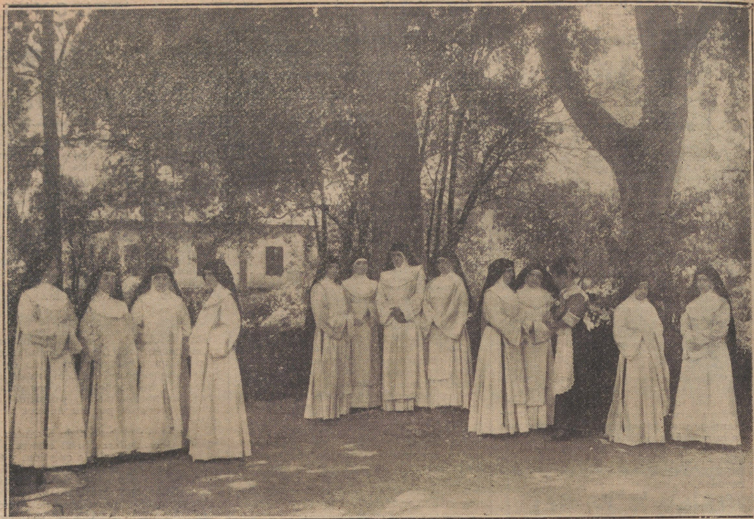
Grupo de bellas señoritas que representaron «Canción de cuna» en la función á beneficio del Sanatorio antituberculoso, celebrada en Murcia. La comedia se representó al aire libre, en el parque de la Fábrica del Salitre.