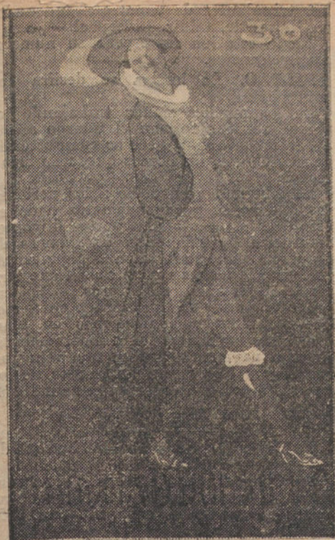
Cartel anunciador de «La Novela de Bol-sillo» (publicación semanal que verá la luz el próximo domingo), original del notable dibujante Cea.