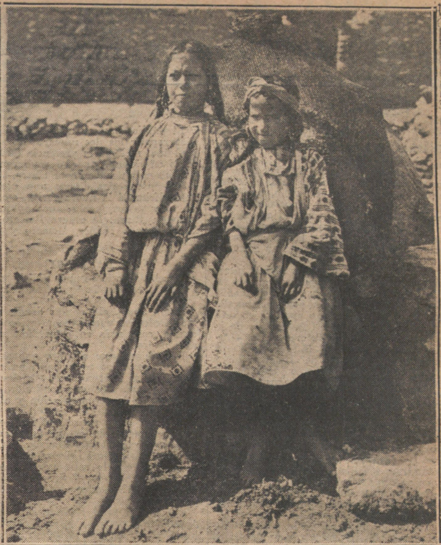
TIPOS RIFEÑOS DE LAS PROXIMIDADES DEL KERT.—Niñas moras típicamente ataviadas, sentadas junto a un horno de pan.

El general Villa se niega decididamente a unir sus fuerzas a las de los federales para combatir a los norteamericanos. Idéntica es la actitud de Obregón, Ca-