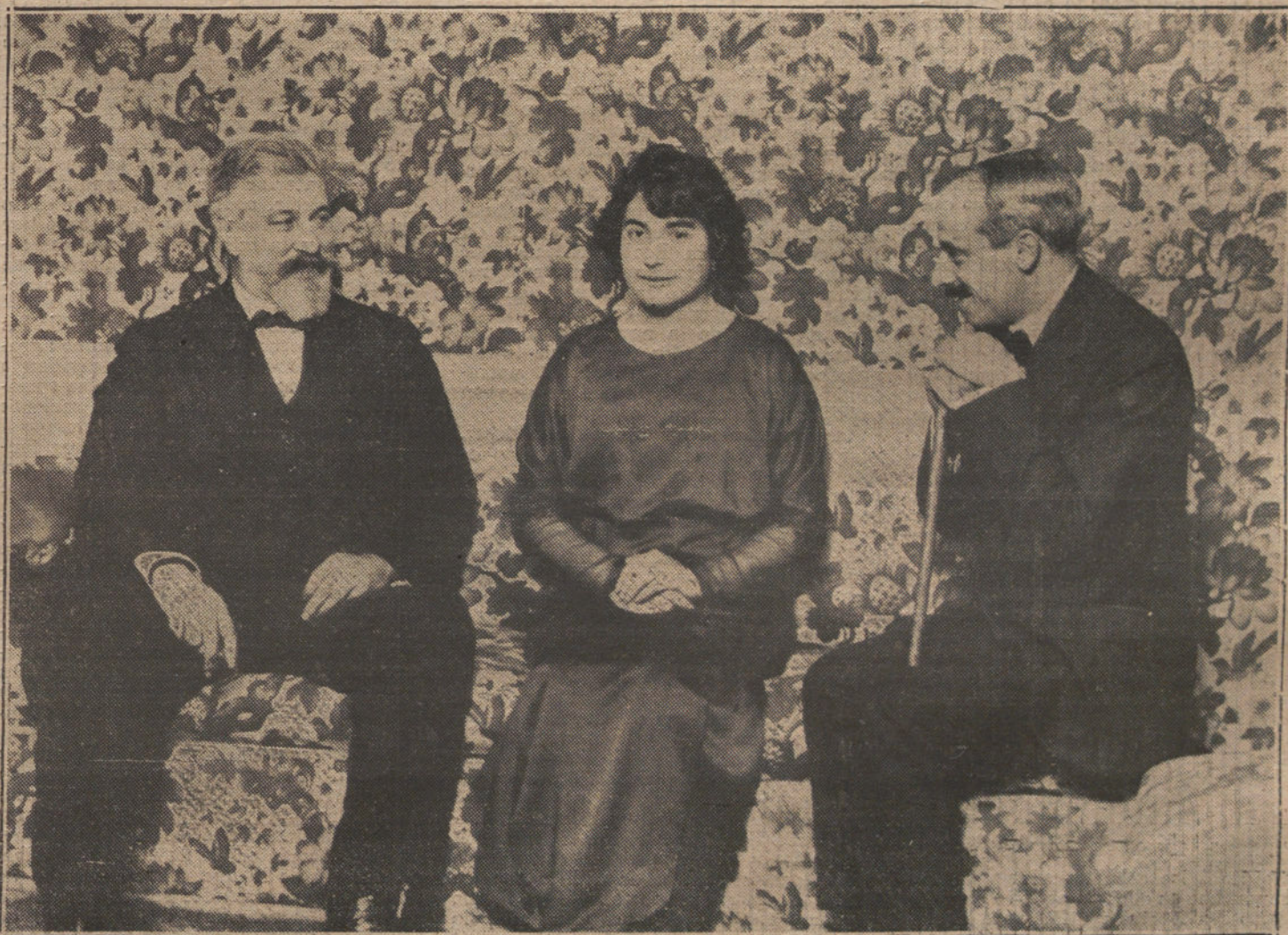
Margarita Xirgu en el saloncillo de la Princesa, con Santiago Rusiñol y Martínez Sierra, autor y traductor de «El patio azul» que se estrena esta noche.

Todos estos documentos los insertaremos en el mismo número, y en forma que puedan ser fácilmente coleccionados.