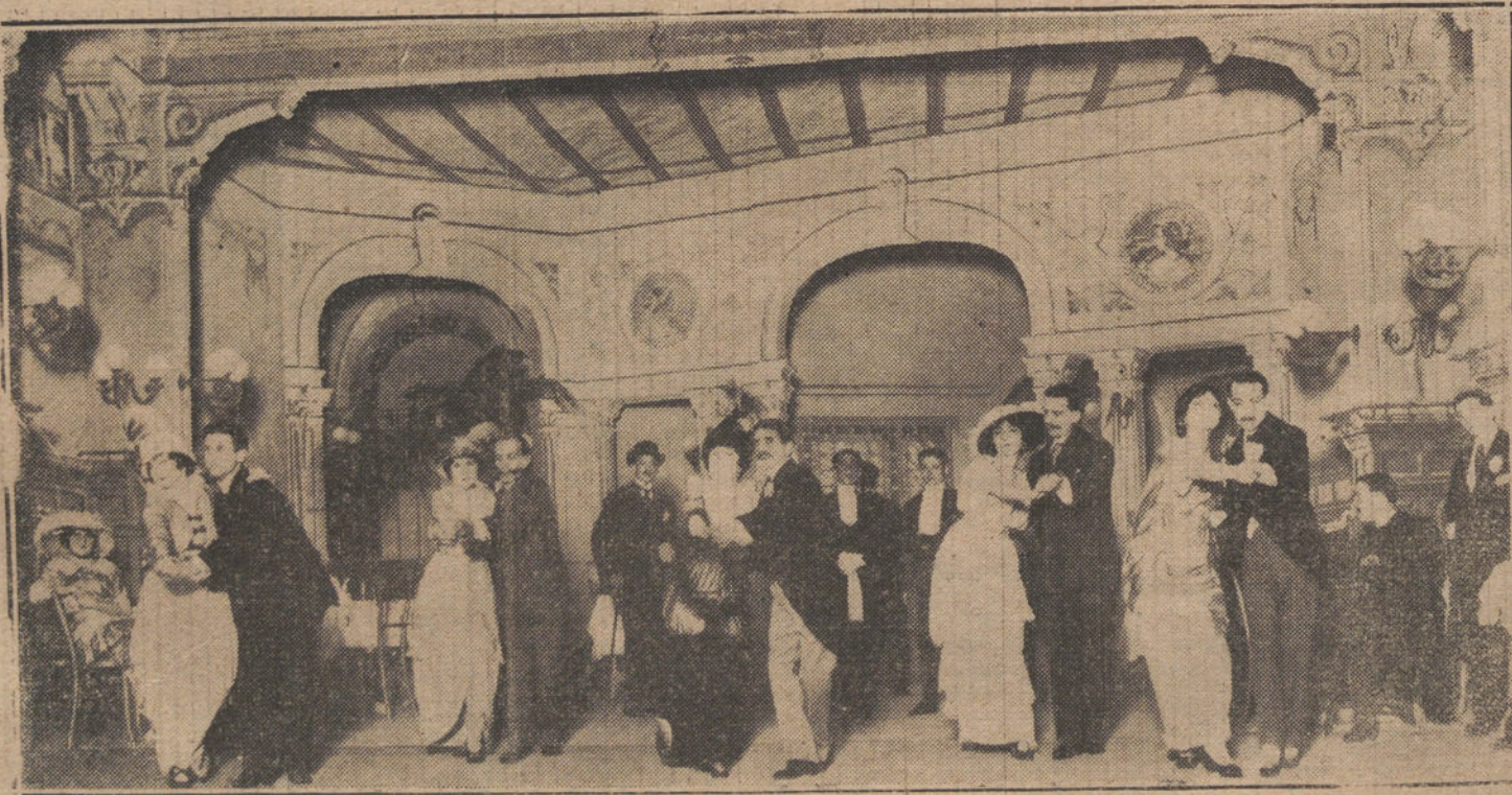
Escena final de la comedia de García Alvarez y Plañol LOS CHICOS DE LA CALLE, que se estrena esta noche en el teatro Español.

Dos cosas íntimamente ligadas, aunque no lo parezca a primera vista, porque ya saben ustedes «que los duelos con pan son menos».—X.