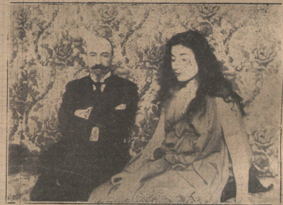
Margarita Xirgu hablando con Jacinto Benavente, después de la representación de «Elektra», de Hofmannsthal.

Por el 2.º se le computa al Banco el valor de adquisición de los títulos de la Deuda perpetua Interior 4 por 100 que posee. De los intereses que obtenga, tanto de dichos títulos como de las acciones de la Compañía Arrendataria de Tabacos, se aplicará el 20 por 100 hasta el 1 de Enero de 1919, y el 25 por 100 después, al pago de la prima de adquisición de oro destinado a reforzar las existencias de su caja; las compras de oro habrán de verificarse de acuerdo con el ministro de Hacienda y sobre la base de las existencias disponibles del Tesoro.