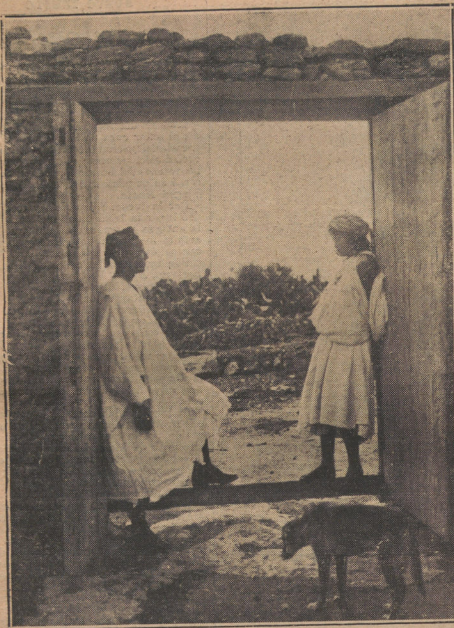
TIPOS RIFEÑOS DE LAS PROXIMIDADES DEL KERT.—Pareja de moros hablando en la puerta de su casa.

Se propone en este proyecto la inclusión en la Tarifa 2.ª de la contribución de utilidades, de algunos conceptos que actualmente se escapan a la tributación; se modifica la Tarifa 3.ª, perfeccionando la redacción de sus epígrafes, con arreglo a las enseñanzas de la experiencia, y se