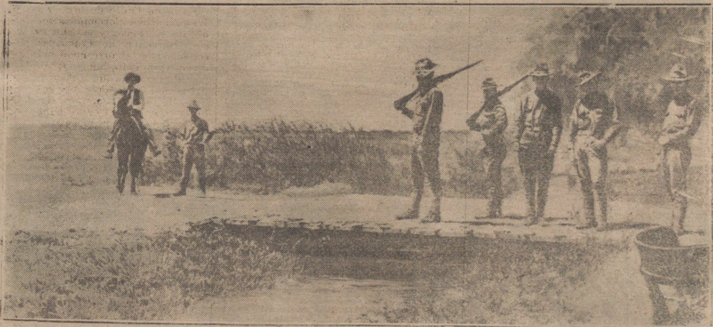
EL CONFLICTO YANQUI-MEJICANO.—Soldados yanquis en el límite de la frontera de Méjico, acompañados de dos soldados rebeldes, que en la fotografía se ven al otra lado del puestecillo.