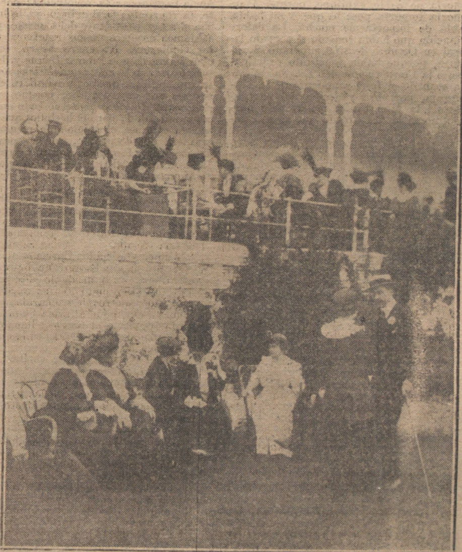
LAS CARRERAS DE CABALLOS. —Un detalle de las tribunas, durante las pruebas verificadas ayer en el Hipódromo.

El crimen permanece hasta ahora rodeado del mayor misterio.—Hallet.