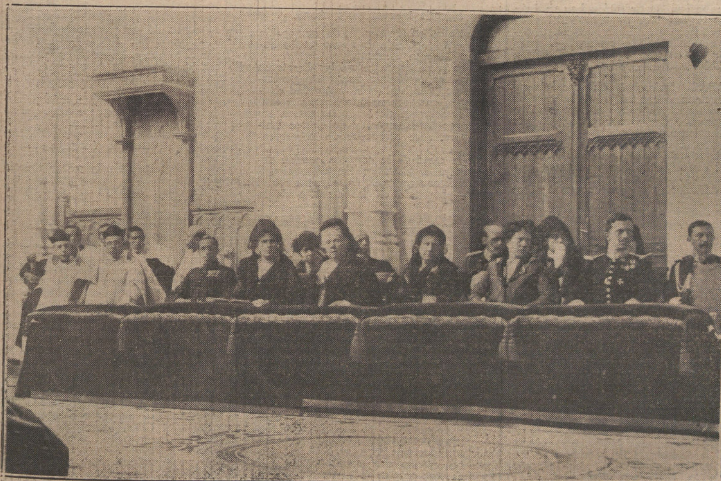
La familia real presidiendo la ceremonia de inauguración de la nueva iglesia parroquial de la Concepción.

Todo Gobierno presente y futuro fracasará en la empresa de permanecer en la orientación actual de la acción marroquí. Toda propaganda revolucionaria que se haga contra la política de la guerra tendrá la simpatía de la opinión y el apoyo tácito de las fuerzas vivas del país.