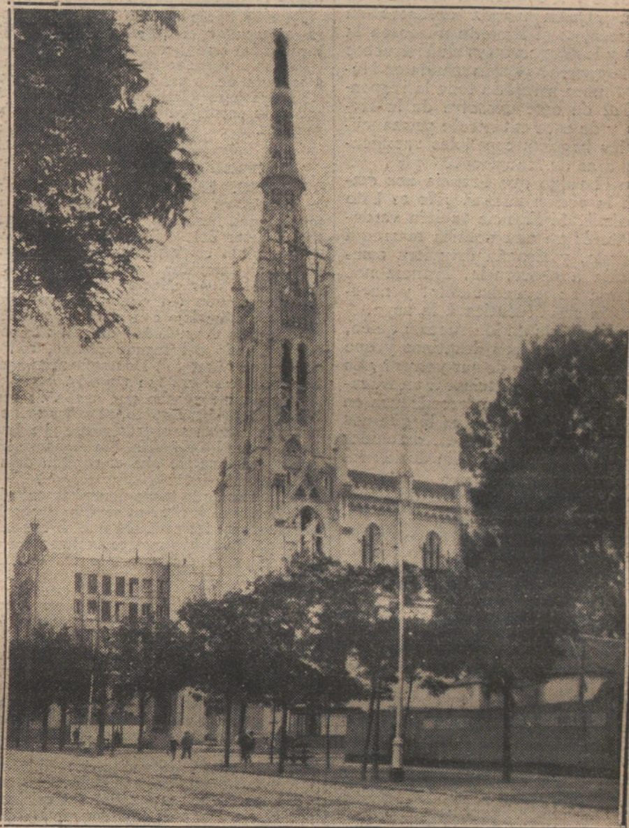
El nuevo templo de la Concepción, inaugurado oficialmente esta mañana.

La acción en Marruecos fué la causa de la semana sangrienta y de los sucesos de Madrid en 1909, é hizo fracasar la política honrada y patriótica de Maura y su Gobierno; hizo fracasar luego la política de Canalejas con los combates de 911. é imposibilitó a Romanones en 1913. Sólo el mantenimiento en África de Ejército de 80.000 hombres impide al Gobierno actual toda tentativa de obra benéfica y de defensa de su política y de su existencia ministerial.