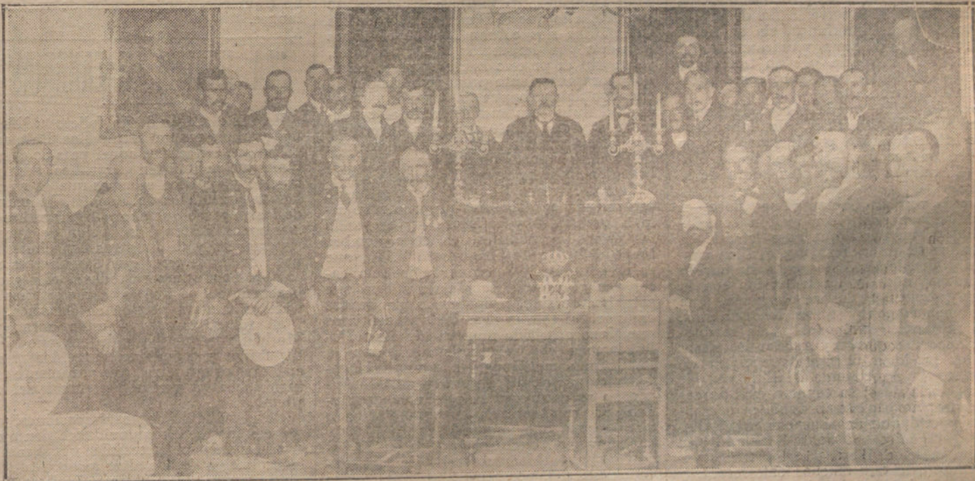
Sesion inaugural de la Asamblea de peones camineros, acto verificado ayer tarde bajo la presidencia del director general de Agricultura.

BOROTAL Polvos higiénicos y antisépticos. 1,25 pesetas estuche.