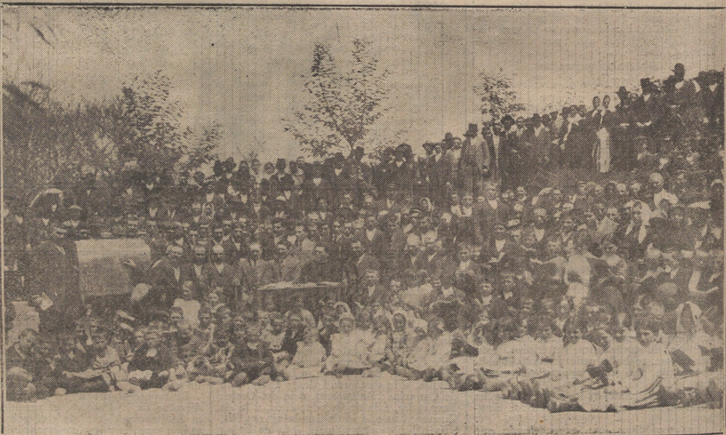
UNA ESCUELA AL AIRE LIBRE.—La campaña agraria que con tanto éxito se está realizando en Galicia, no consiste sólo en el mitin y la manifestación. El popular abad de Beiro, Basilio Alvarez, alma de aquel movimiento, ha fundado escuelas en aquellas aldeas, abandonadas del Estado, donde los hijos de los campesinos reciben adecuada enseñanza. He aquí el momento de los exámenes de fin de curso en la escuela de Villamarín (Orense), á los que asisten un centenar de alumnos.

Llevado de la simpatía inconsciente que los judíos me inspiran veo que me aparto de mi inicial objetivo, extendiéndome en consideraciones históricas de todos conocidas. Volvamos, pues, al asunto: Hace algunos años, ilustres peregrinos españoles que recorrieron en toda su extensión la región del Bósforo, fueron sorprendidos al escuchar de labios hebreos el rico idioma en que se escribieran «La Cees-