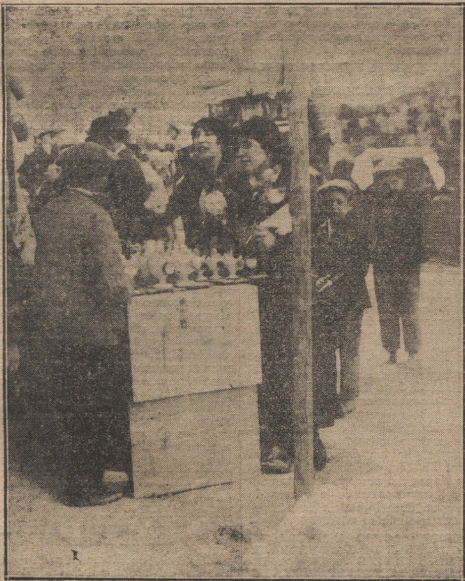
LA FIESTA DE HOY.—Comprando pitos del Santo en la pradera de San Isidro.

PARA TODO LO REFERENTE A PUBLICIDAD FRANCESA EN «LA TRIBUNA» DIRIGIRSE A NUESTRA AGENCIA EN PARÍS: RUE VIVIEN, 22.