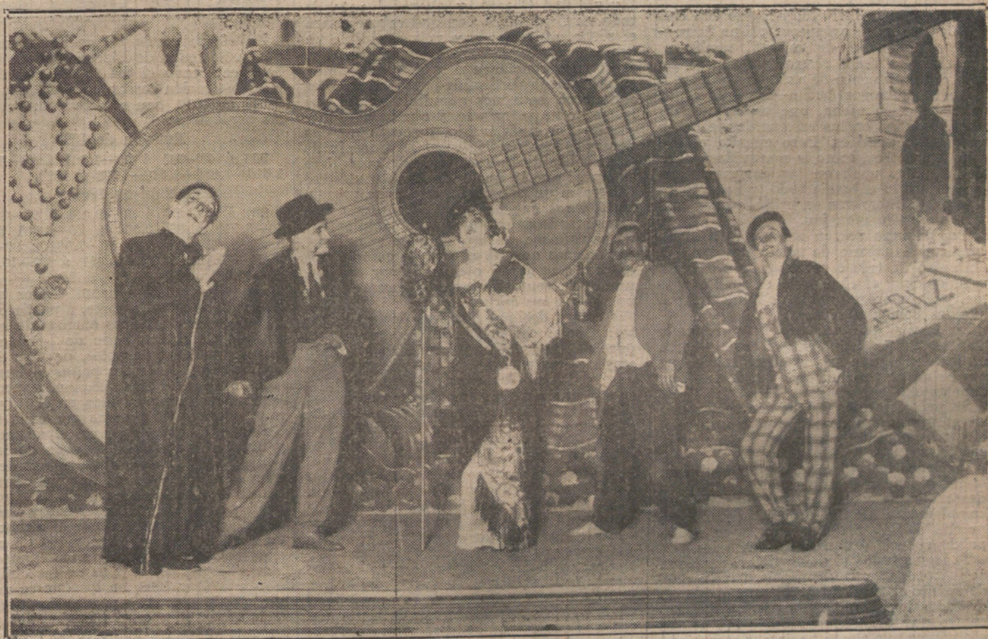
Una escena de «La España de vandereta», revista estrenada anoche en el Gran Teatro.

El gobernador ha enviado la fuerza reclamada por las autoridades locales, reconcentrando en el mencionado pueblo Guardia civil.