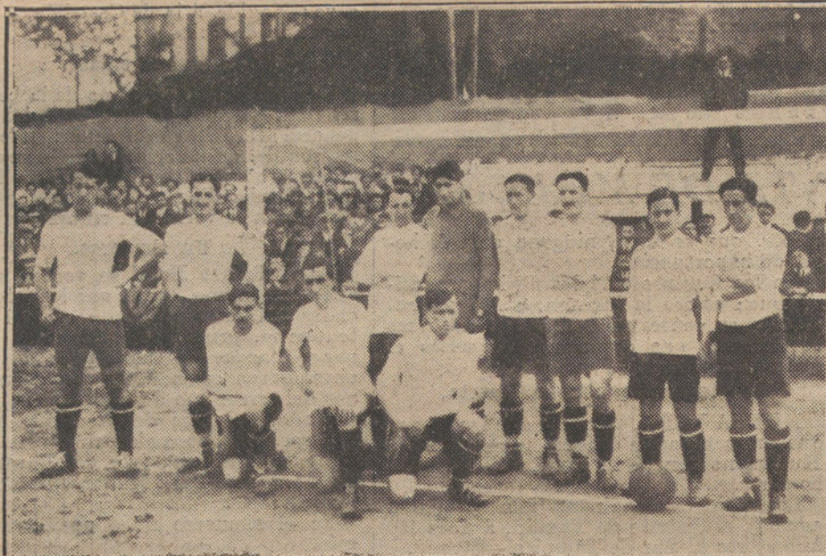
El equipo de «foot-ball» Athletic, de Bilbao, que ha ganado el Campeonato de España, disputado recientemente en Irún.