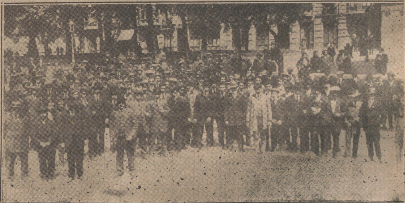
EL CONFLICTO MARITIMO

El régimen actual y su política es vicioso, podrido, inmoral, inculto, y lleno de prejuicios y de pasiones que juegan en apetitos insaciables. Urge removerlo, remergir sus aguas para aclararlas, volver lo de abajo arriba. Le quedan dos caminos: ó hacer él por sus hombres la revolución desde arriba, buscando al más apto, al más