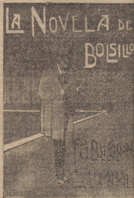
Cartel anunciador de «La Novela de Bolsillo», original del joven y distinguido dibujante La Torre.

«La gracia de Dios», pasodoble, Roig; «L'Arlesienne», segunda suite; Introducción y pastoral, Intermedio, Minueto (flauta á solo, Sr. Martínez), Farandola, Bizet; Coro y baile de la ópera «Tabaré», Bretón; Gran fantasía de «La Walkiria», Wagner.