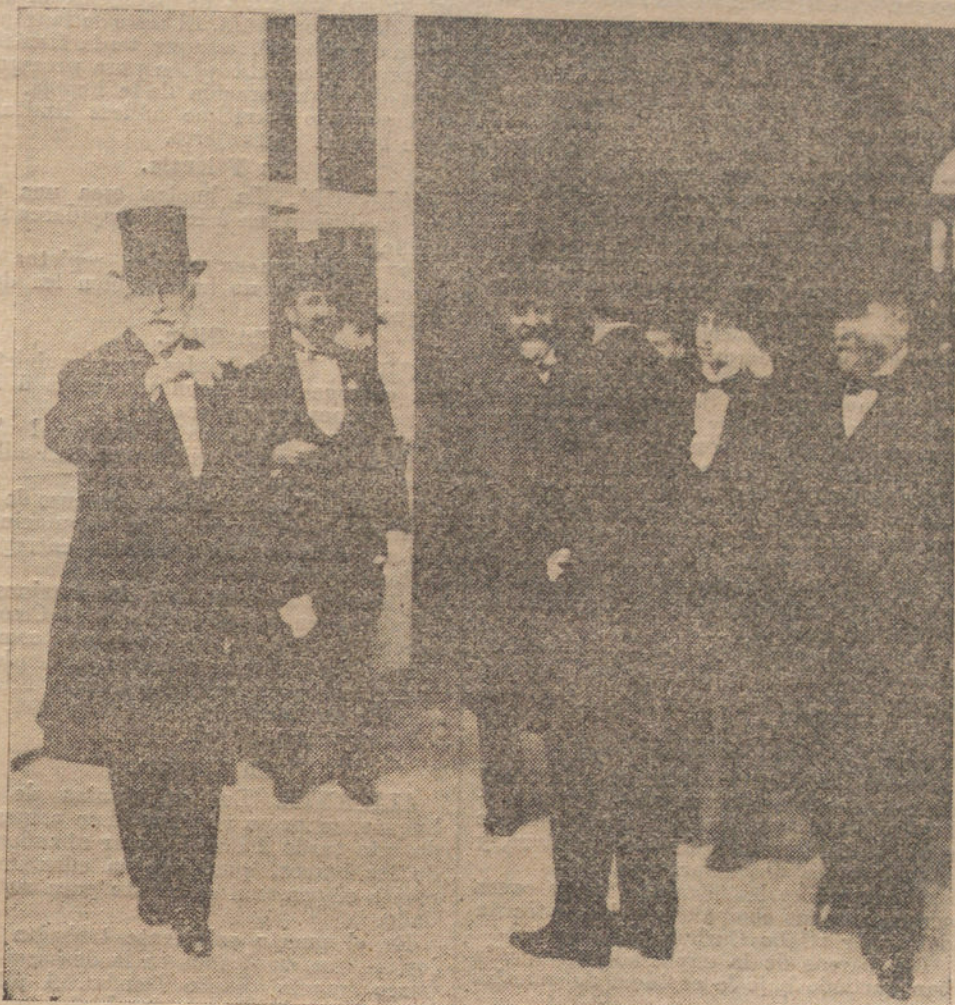
Los señores Maura y La Cierva con la Comisión del Congreso, saliendo de la recepción de Palacio.

El tercio es animadísimo, y la parroquia se pasa el tiempo tocando las palmas. «Maravilla», especialmente, está que «jumba», como las chuletas de huerta. ¡Vaya un pollo, «Claridades»!