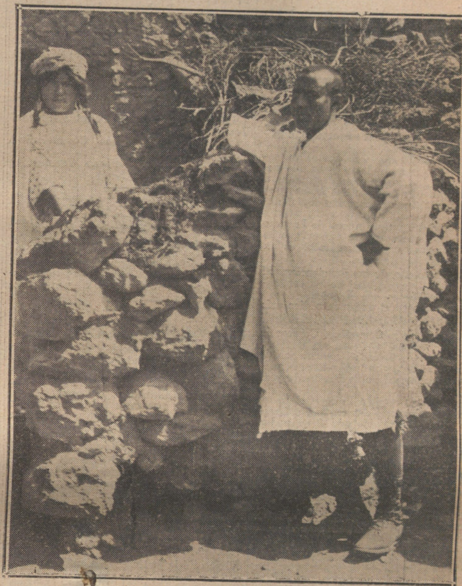
TIPOS RIFENOS DE LA ORILLA DEL KERT.—Un moro conversando con su novia.

Existe en Larache un espigón de 500 metros de largo, insuficiente para proteger el puerto de los temporales; la barra