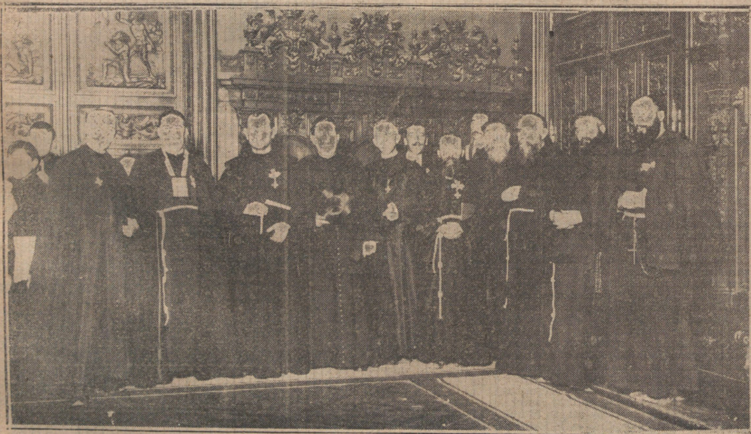
EL CONGRESO FRANCISCANO.—Grupo general de obispos y vicarios generales de la Orden Franciscana, que han venido á Madrid para asistir á la Asamblea.