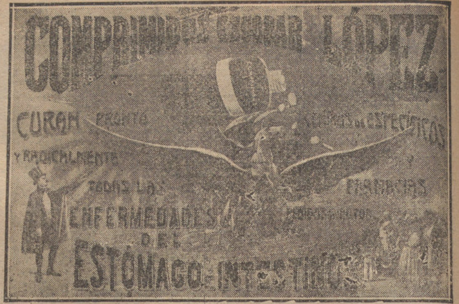
Cartel anunciador de los COMPRIMIDOS ESCOBAR LOPEZ, para las enfermedades del estómago e intestinos, que ocupa una de las vallas de la calle Mayor.

Notificado el Consejo de las gestiones que vienen realizando las Comisiones censoras de las películas cinematográficas en Madrid y provincias, mereció los mayores elogios la de Barcelona, por haber conseguido que los fabricantes extranjeros dejen de enviar a España las numerosas cintas que antes importaban, de tendencia perniciosa. Sobre los efectos sugestivos que ejercen en la juventud algunos asuntos cinematográficos, y acerca de las medidas de severa represión que deben seguir adoptándose, hablaron los señores gobernador civil, Pulido, Rexach, Heredero, López Núñez y Tolosa Latour.