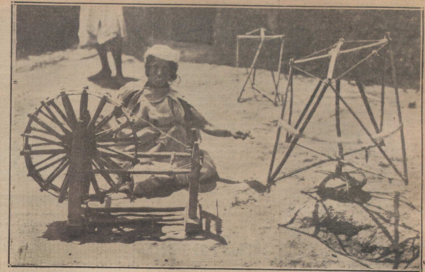
LAS INDUSTRIAS PRIMITIVAS DEL RIF.—Una mora hilando lana, para tejer los jaiques.

Juzgado solamente como aviador, y según consta en la historia de Almakari, tuvo Abenfirnás la idea de revestirse de plumas de ave y proveerse de dos gigan-