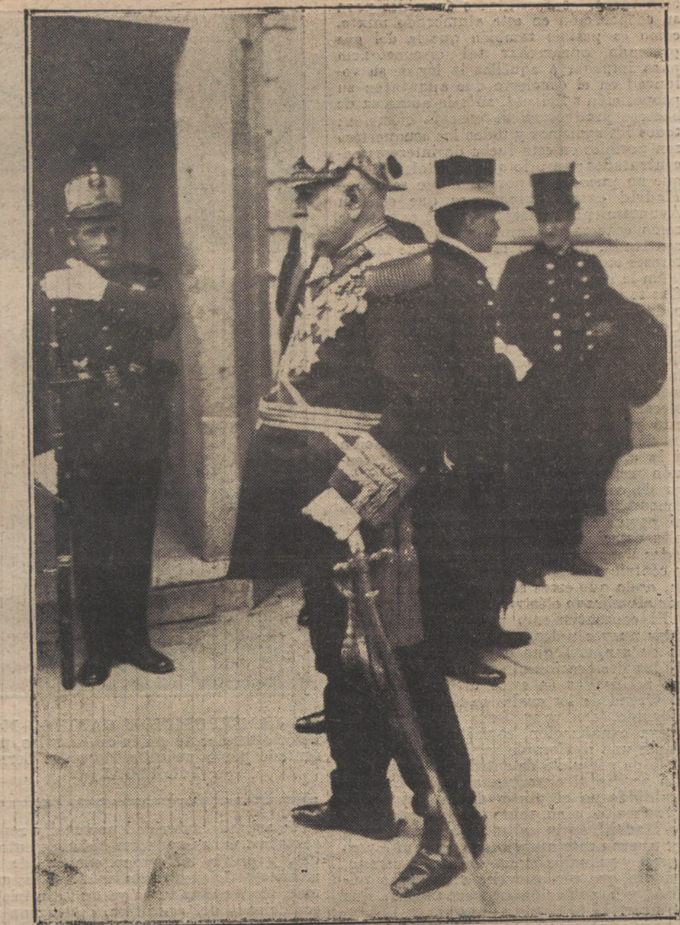
EL CUMPLEAÑOS DE S. M. EL REY.—El presidente del Senado, general Azcárraga, saliendo de Palacio.

Es de suponer que el asesino vaya á la penitenciaría contento y orgulloso del