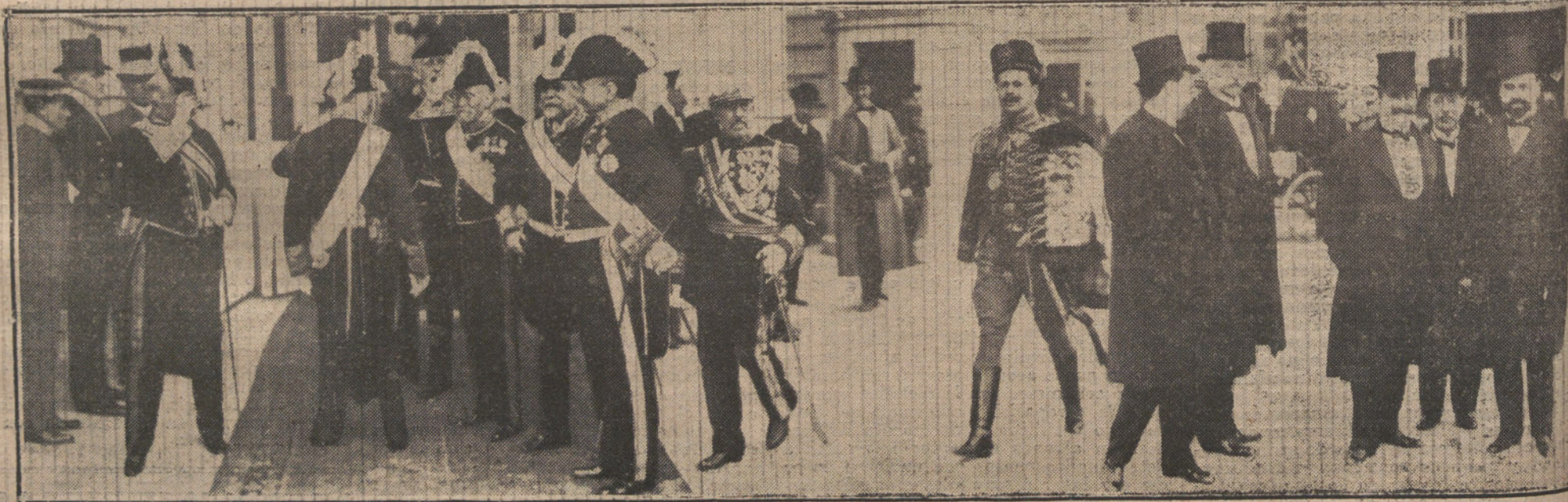
EL CUMPLEAÑOS DE S. M. EL REY.—El Consejo de Estado, presidido por el duque de Mandas; el general Weyler y el conde de Romanones, con la Comisión del partido liberal, saliendo de la recepción verificada en Palacio.

Al zoco de Arruit han concurrido pocos benibuyahis, los cuales aseguran que los revoltosos sufrieron durísimo castigo por la agresión que llevaron á cabo el día 11. También participa le anuncia que