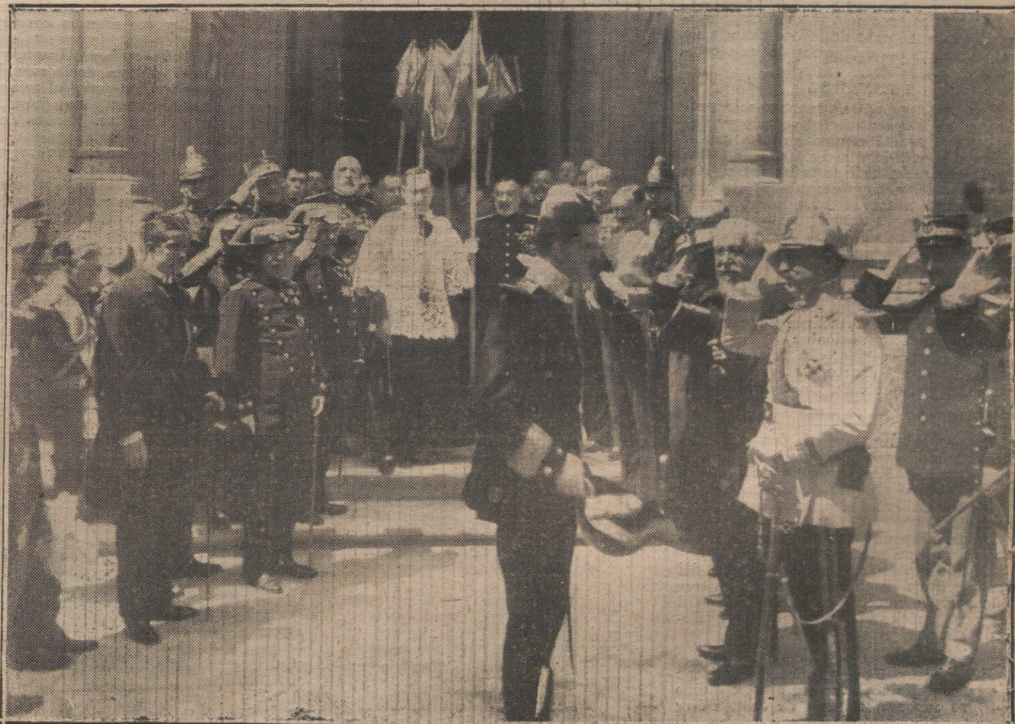
S. A. el Infante Don Fernando al salir esta mañana del templo del Buen Suceso, donde se ha celebrado la solemnidad religiosa con que dan comienzo las fiestas conmemorativas del L aniversario de la fundación de la Cruz Roja Española.

Para todo lo referente á publicidad francesa en LA TRIBUNA, dirigirse á nuestra agencia en París, rue VIVIERNE, 22.