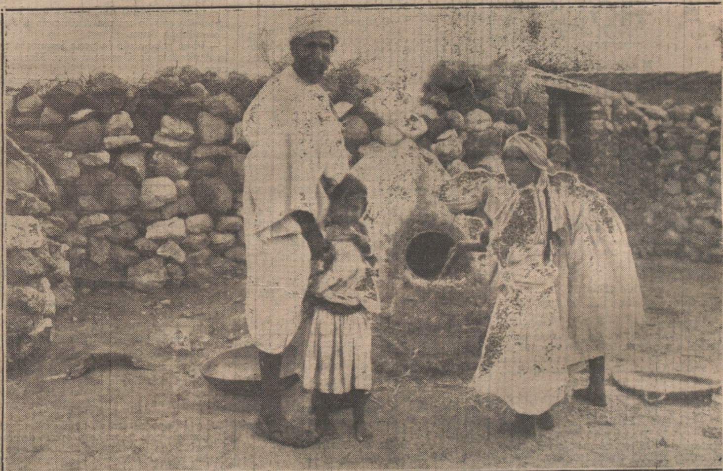
LAS INDUSTRIAS PRIMITIVAS DEL RIF.—Moros cociendo pan de cebada en un horno de las proximidades.

El jefe del Gobierno, preocupado con la cuestión de la huelga de los oficiales de vapores mercantes, lleva tres días sin parecer por su despacho oficial. Hoy, lo mismo que ayer y que anteayer, los periodistas han sido recibidos por el subsecretario de la Presidencia, marqués de Santa Cruz, el cual, con su amabilidad exquisita, ha dicho á los repórters que el Sr. Dato, ocupadísimo con la cuestión de la huelga, no tenía tiempo para ocuparse de otros asuntos. La huelga, no obstante llevar tantos días dedicado á ella el presidente, sigue en igual estado, y es un