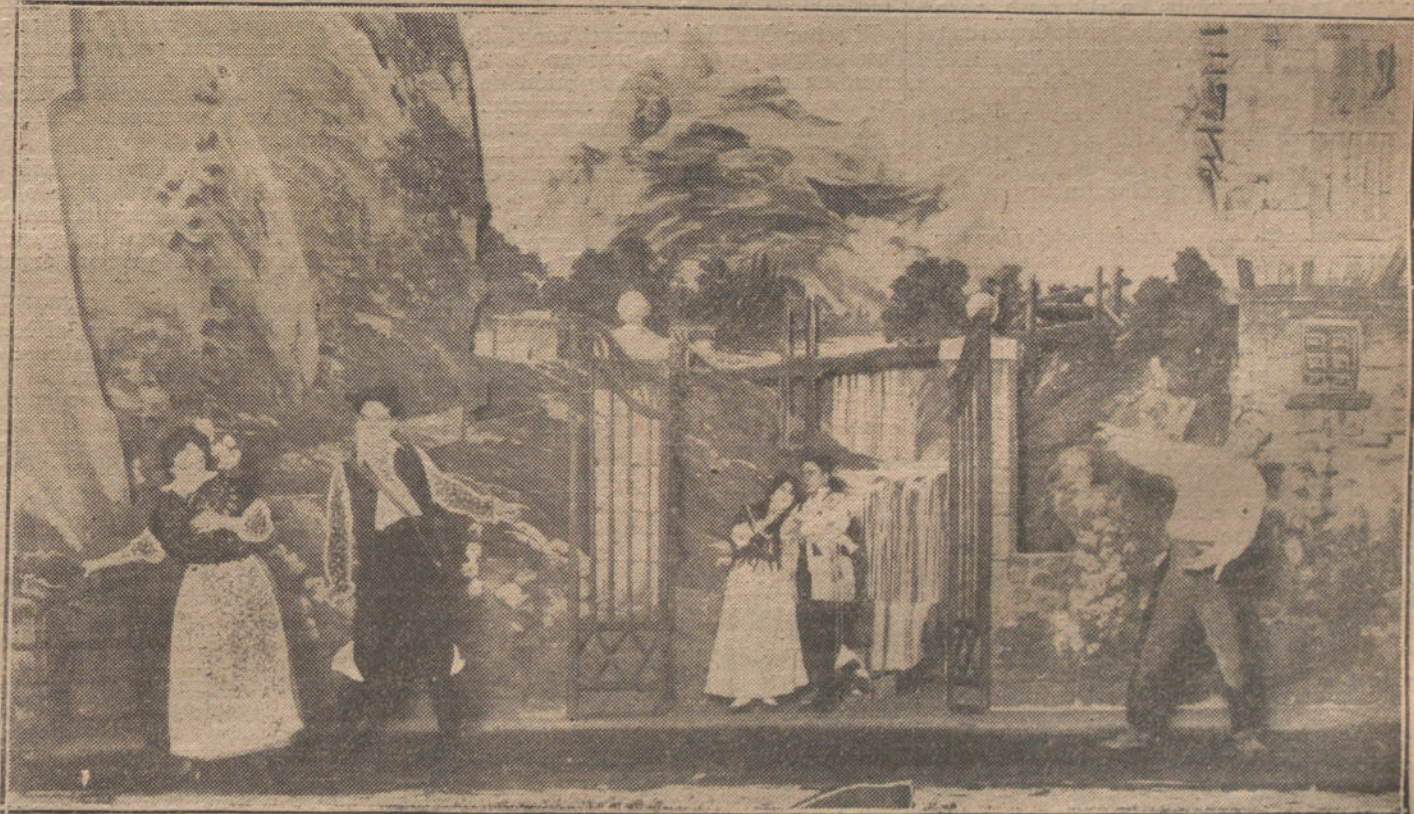
Escena final de la ópera del maestro Vives «Maruxa», que se estrena esta noche en el teatro de la Zarzuela.

El PRESIDENTE dispone que se lea un artículo del reglamento, y deduce lue- go que este asunto, por afectar al decoro