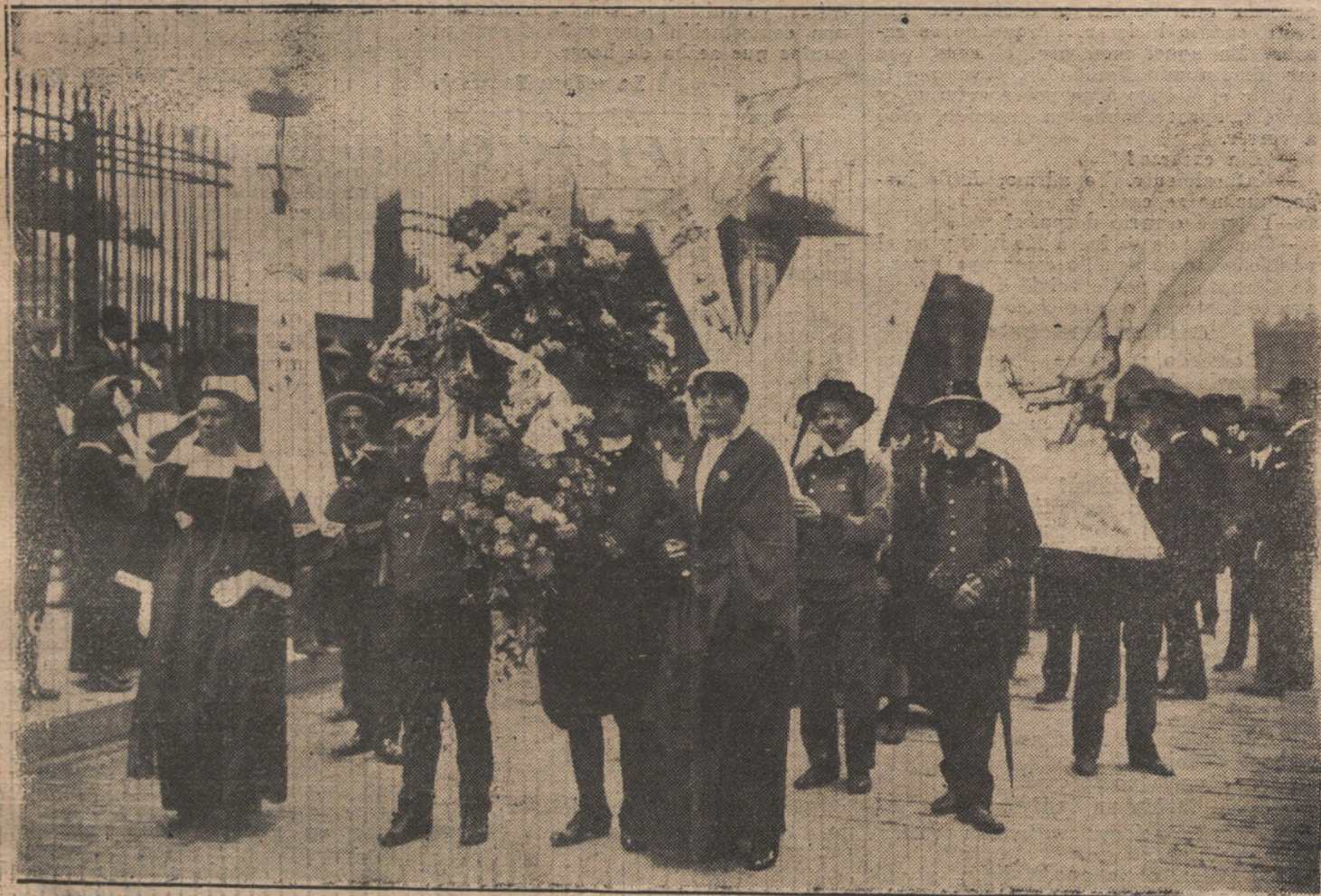
LAS FIESTAS DE JUANA DE ARCO EN PARIS.—Los representantes de la Bretaña, típicamente vestidos, que figuraban en la procesión cívica que fué a colocar coronas en el monumento de Juana de Arco. (Fot. BOL-VIDAL)

Los cardenales-jefes recibieron a sus nuevos colegas y les tomaron juramento, según la fórmula reformada por el Papa Nesi.