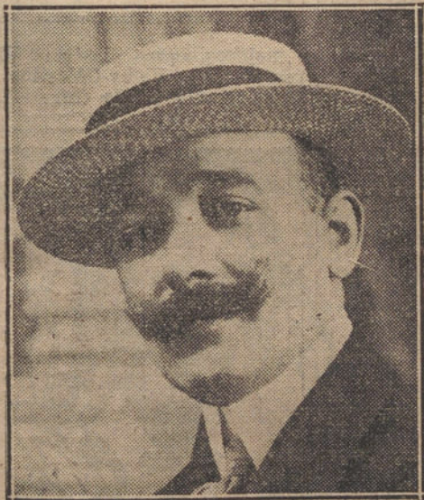
El maestro Vives, autor de la música de «Maruxa».

El jueves irá á inspeccionar la tropa de San Feliú de Llobregat, y para el viernes se prepara una conferencia de escultismo que el Sr. Iradier dará en el Fomento de las Artes.