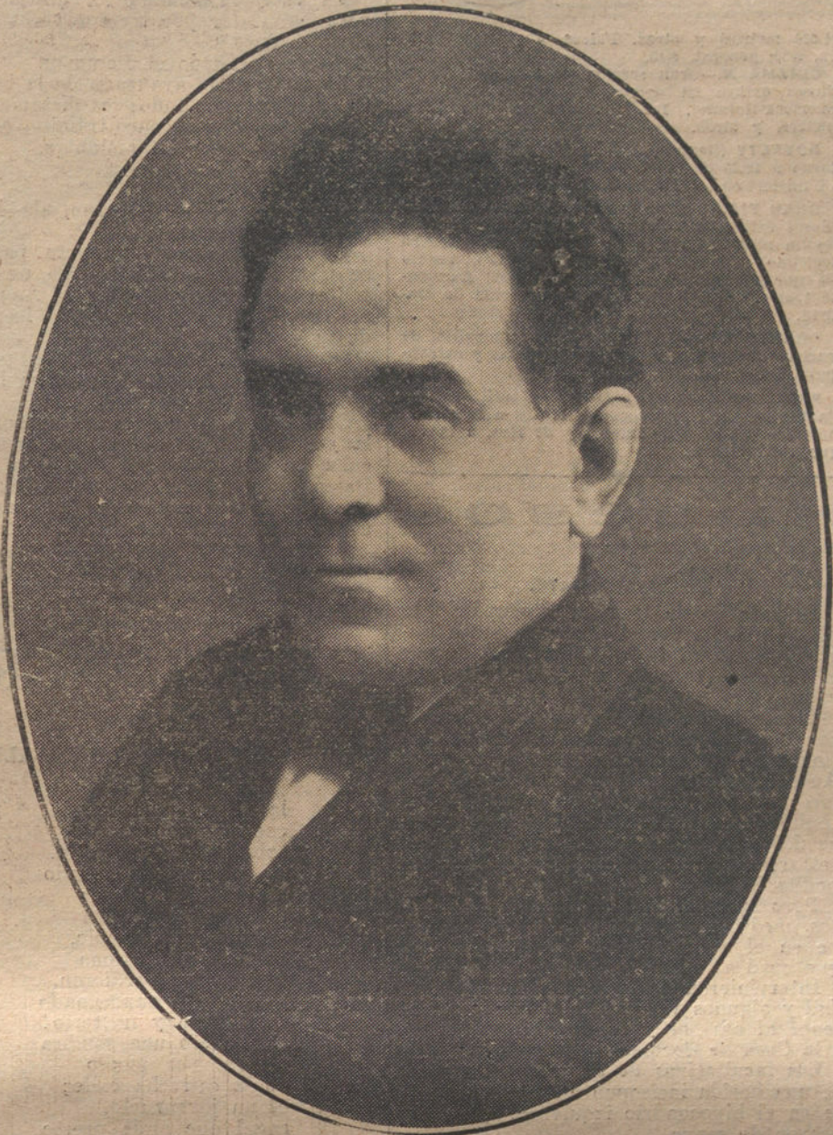
El maestro Vives, autor de la música de «Maruxa».