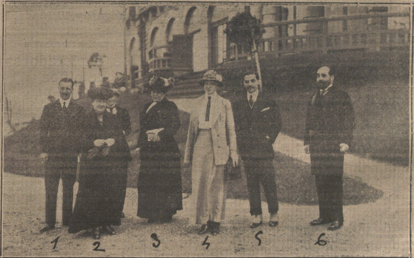
LA INFANTA PAZ EN SAN SEBASTIAN.—Núm. 1, duque de Ansoa; 2, Infanta Doña Paz; 3, marquesa de Atarfe; 4, Princesa Pilar; 5, duque de Hernani; 6, marqués de Atarfe, gobernador civil de Guipúzcoa.

Entre los invitados figuraban los condes de Romanones, los duques de la Victoria, el Príncipe y la Princesa Pío de Saboya, el ministro de Estado, la marquesa de Lema, los marqueses de Viana, los de la Mina, el marqués de la Torre-