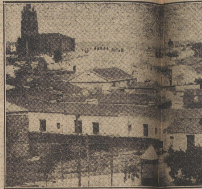
Vista general de Almendralejo

fué conjurada con la creación de un Cuerpo de guardas rurales perfectamente uniformados y equipados, el cual demostró, desde los primeros instantes, un celo al que la población no estaba acostumbrada. Y la prueba se vió palpablemente al hacer la primera subasta de los aprovechamientos que los propietarios habían cedido a la Comunidad en el acta de constitución de ésta; la fanega de tierra de los referidos aprovechamientos, que antes había valido, como máximo, dos pesetas, llegaba mediante la puja de los ganaderos, a seis, siete y hasta nueve pesetas. Y tanto subieron las subastas que hoy se da el caso de ser la guardería no un censo de los labradores, sino la causa de que los propietarios cobren a razón de diez reales anuales por fanega de rastrojo, después de ser pagada con los productos de esas subastas; es decir, que los labradores de Almendralejo tienen guardados sus campos gratuitamente, y además perciben un dinero que antes no percibían.