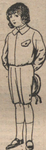
Trajes de lanilla, vicuña o jerga para niños de 4 a 9 años. De pesetas 5 a 10.