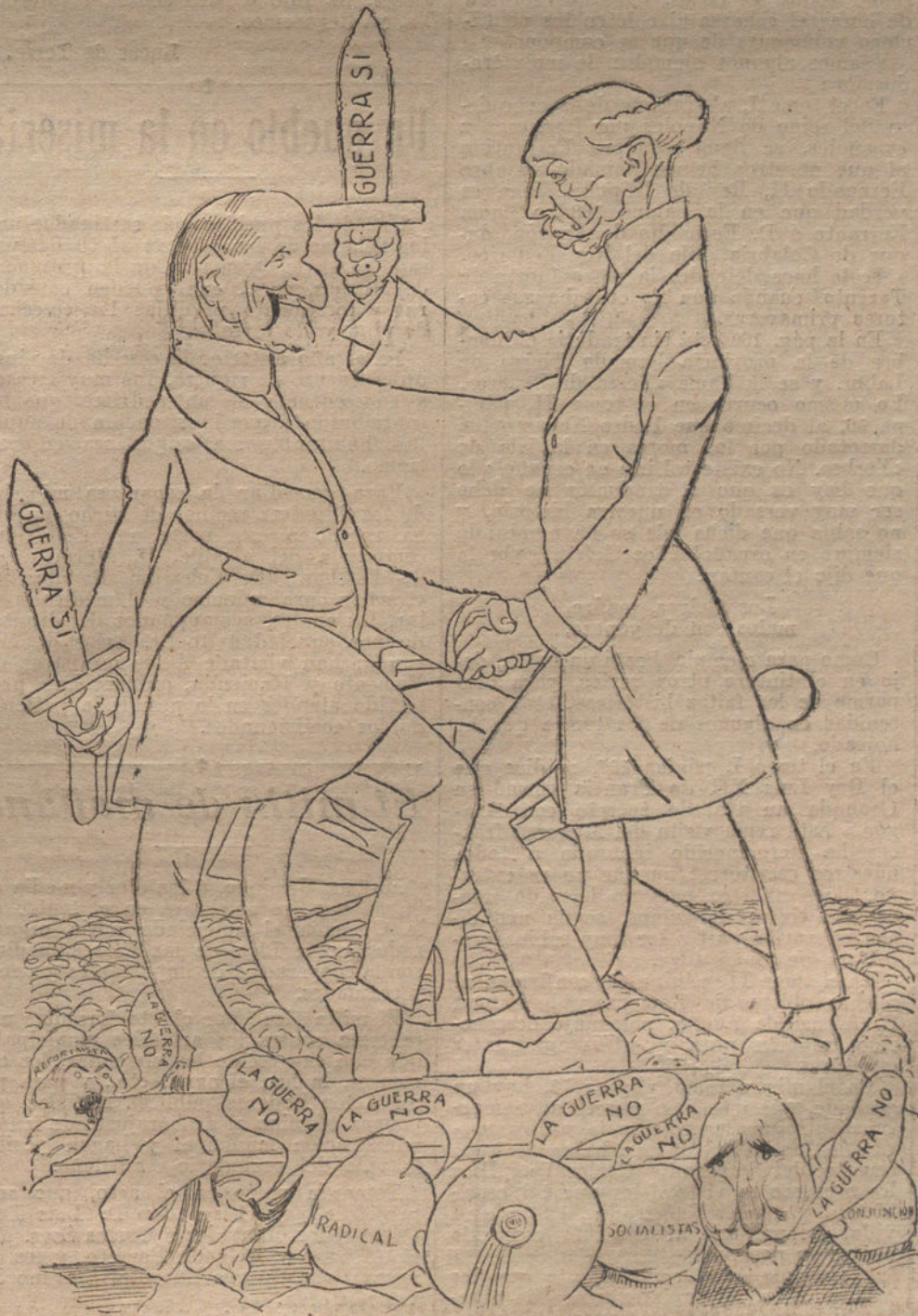
Los Modernos. Dato y Vejarde.

2.º Ejecución de las obras en seis años y pago de su importe de 72 millones de pesetas en doce presupuestos. La reparación de las carreteras será definitiva, y después no necesitarán más que conservación.