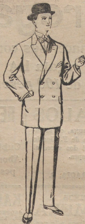
Trajes de vicuña o jerga, negros y azules. De pesetas 35 a 73.