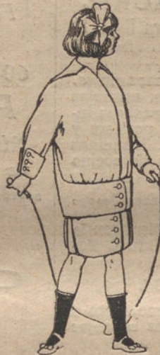
Trajes de lanilla para niñas de 4 a 10 años. De pesetas 30 a 34.