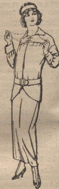
Trajes de lanilla para jovencitas de 13 a 15 años. De pesetas 37 a 40.