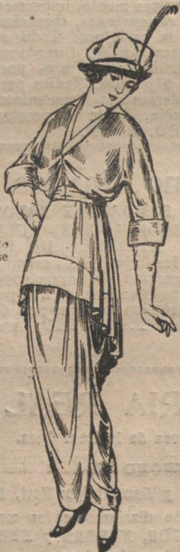
Vestidos de nipsis, voile o crespón, para señora. De pesetas 35 a 40.