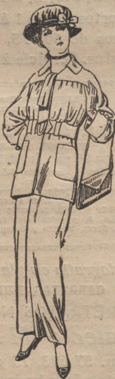
Trajes de lanilla, para señora. De otras 50 a 73.