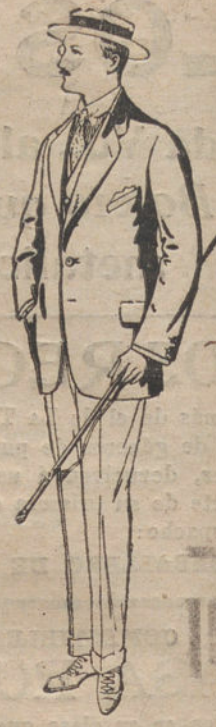
Trajes de alpaca, negra. De pesetas 32 a 56.