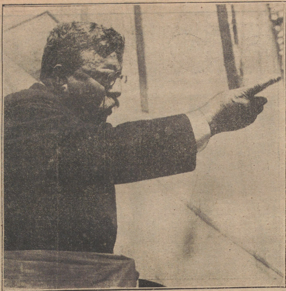
El ex Presidente de los Estados Unidos Mr. Roosevelt, que ha llegado esta mañana a Madrid, para asistir a la boda de su hijo. (Fotografía obtenida durante la última campaña electoral.)

mil cortesanos es el sujeto a quien más adelante «La Historia del Mundo en la Edad Moderna» aplica las cariñosas y corteses frases siguientes: