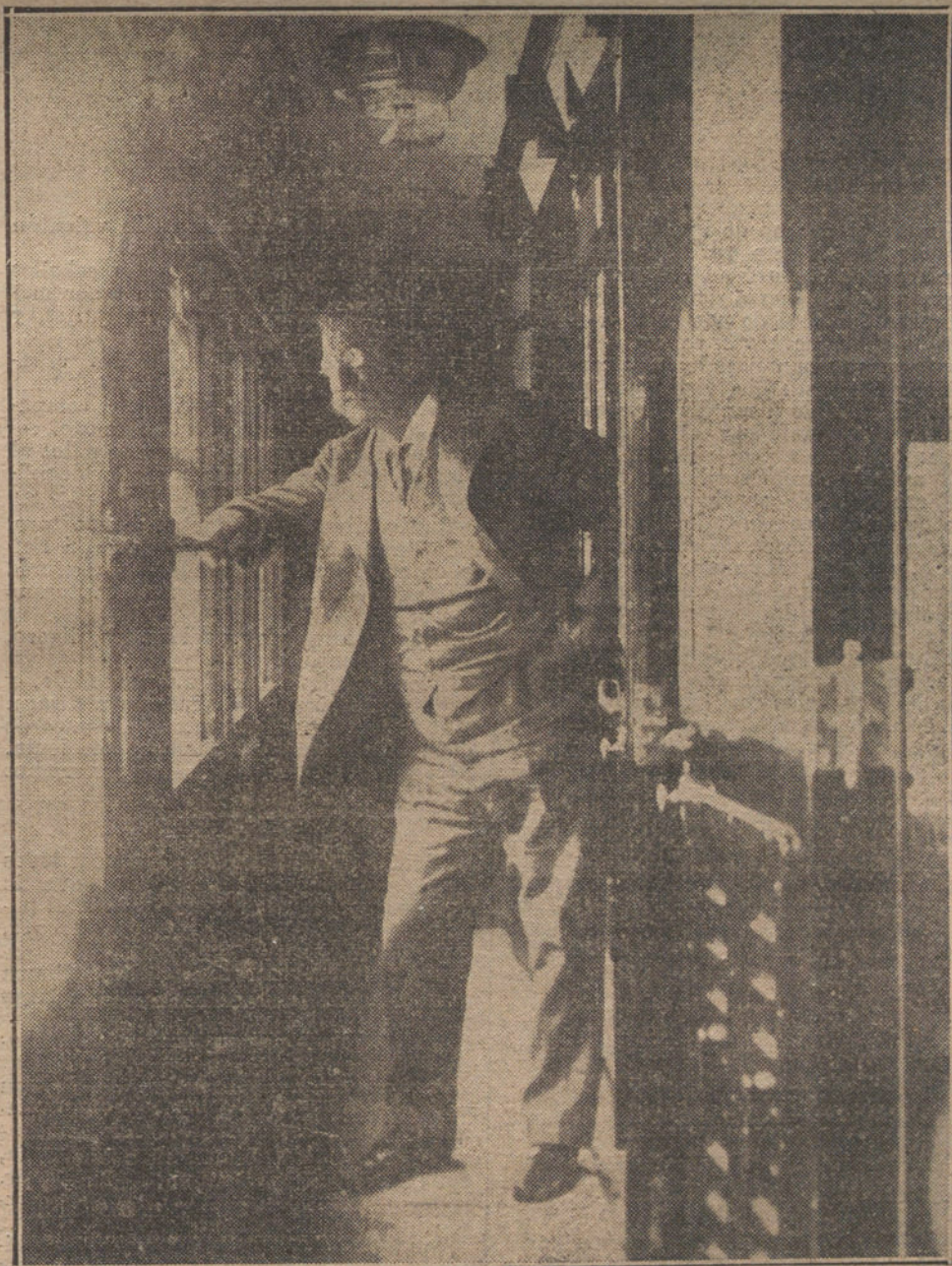
MR. ROOSEVELT EN ESPAÑA.—El ex Presidente de los Estados Unidos en el vagón del tren, durante el trayecto Irún-Madrid. (Primera fotografía de Roosevelt obtenida en España.)

Su influencia en España ha sido un abuso de fuerza, un caso de tiranía de un poder irresponsable, que ha muerto, precisamente, de una indigestión de soberbia. El mismo «trust»,