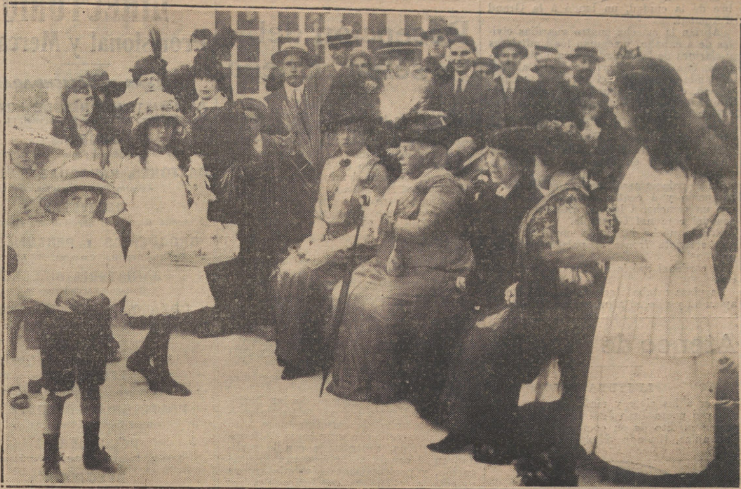
La Infanta Isabel presidiendo la fiesta verificada en el Retiro, a beneficio del Instituto Rubio.

el alto comisario, asintiendo a estas palabras el comandante Castro.