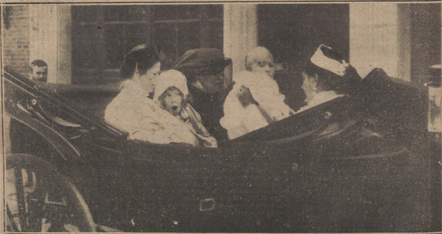
SS. AA. los Infantitos Beatriz y Juan al llegar a la estación del Norte, para dirigirse a La Granja.