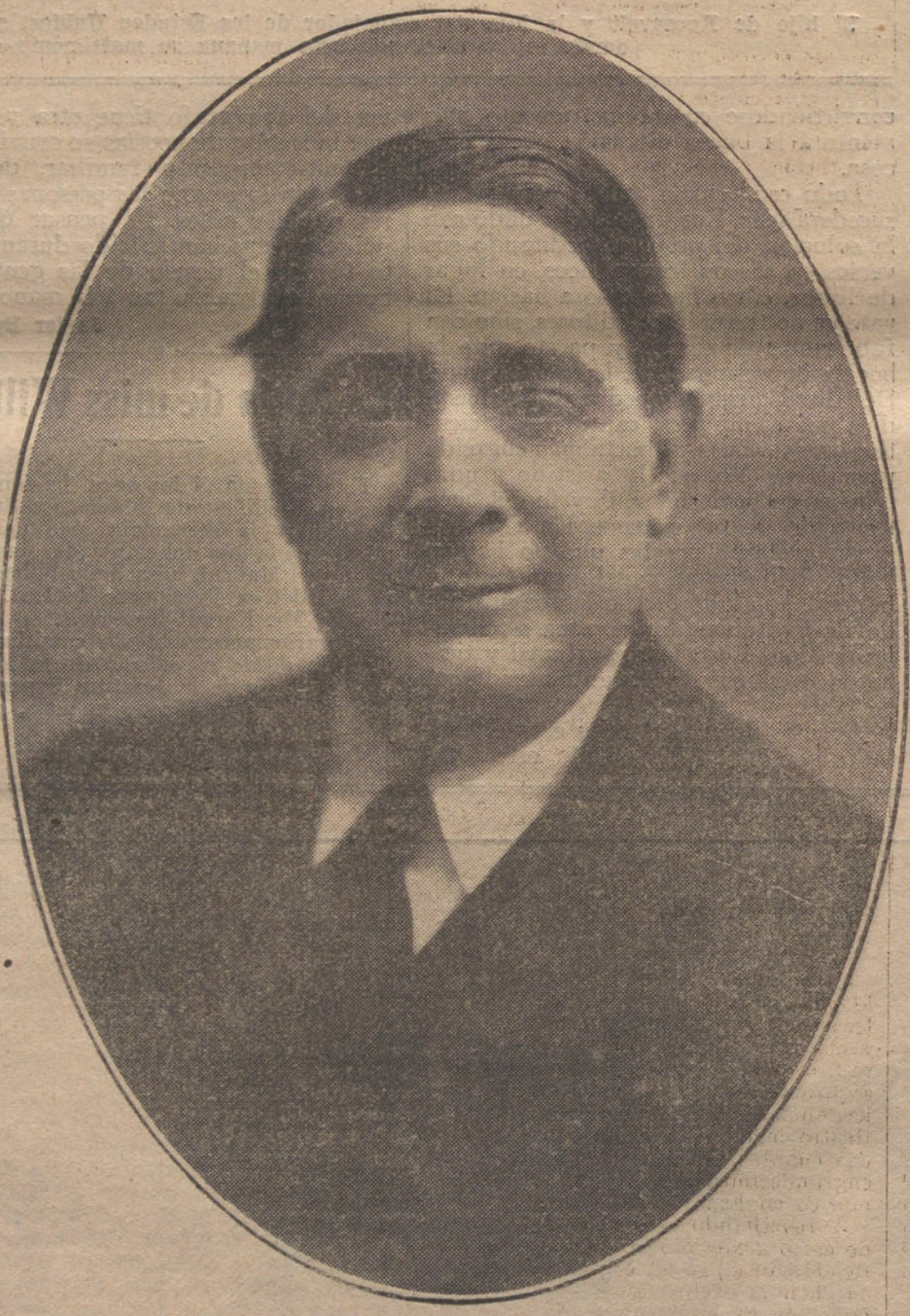
ENRIQUE CHICOTE, que celebra esta noche su beneficio.