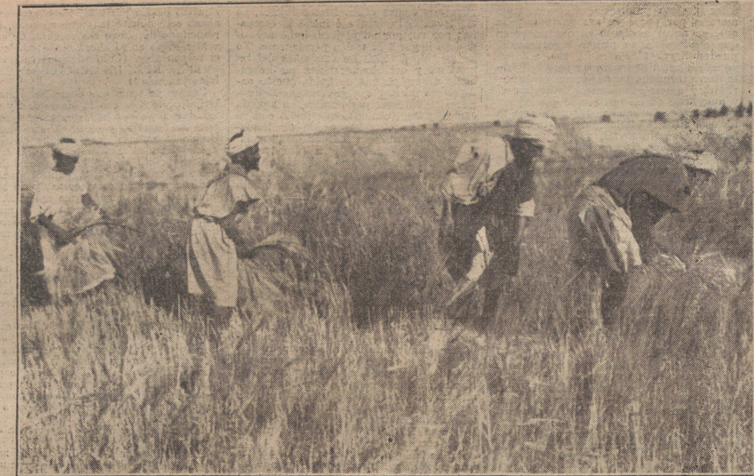
LAS FAENAS DEL CAMPO EN EL RIF.—Cuadrillas de segadores moros, trabajando en las proximidades del monte Arrui.

Se concede la de segunda clase del Mérito Militar, blanca, con pasador de In-