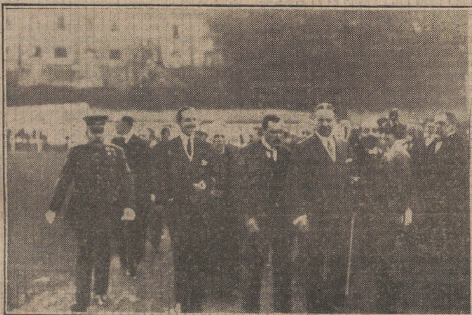
S. M. el Rey entrando en el campo de deportes del Real Racing Club de Irún, donde presenció un interesante partido de «foot-ball», que jugaron el primer equipo del Racing y el notable equipo inglés Englis-Wenderers.

PARA TODO LO REFERENTE A PUBLICIDAD FRANCESA EN «LA TRIBUNA», DIRIGIRSE A NUESTRA AGENCIA EN PARÍS: 22, RUE VIENNE, 22.