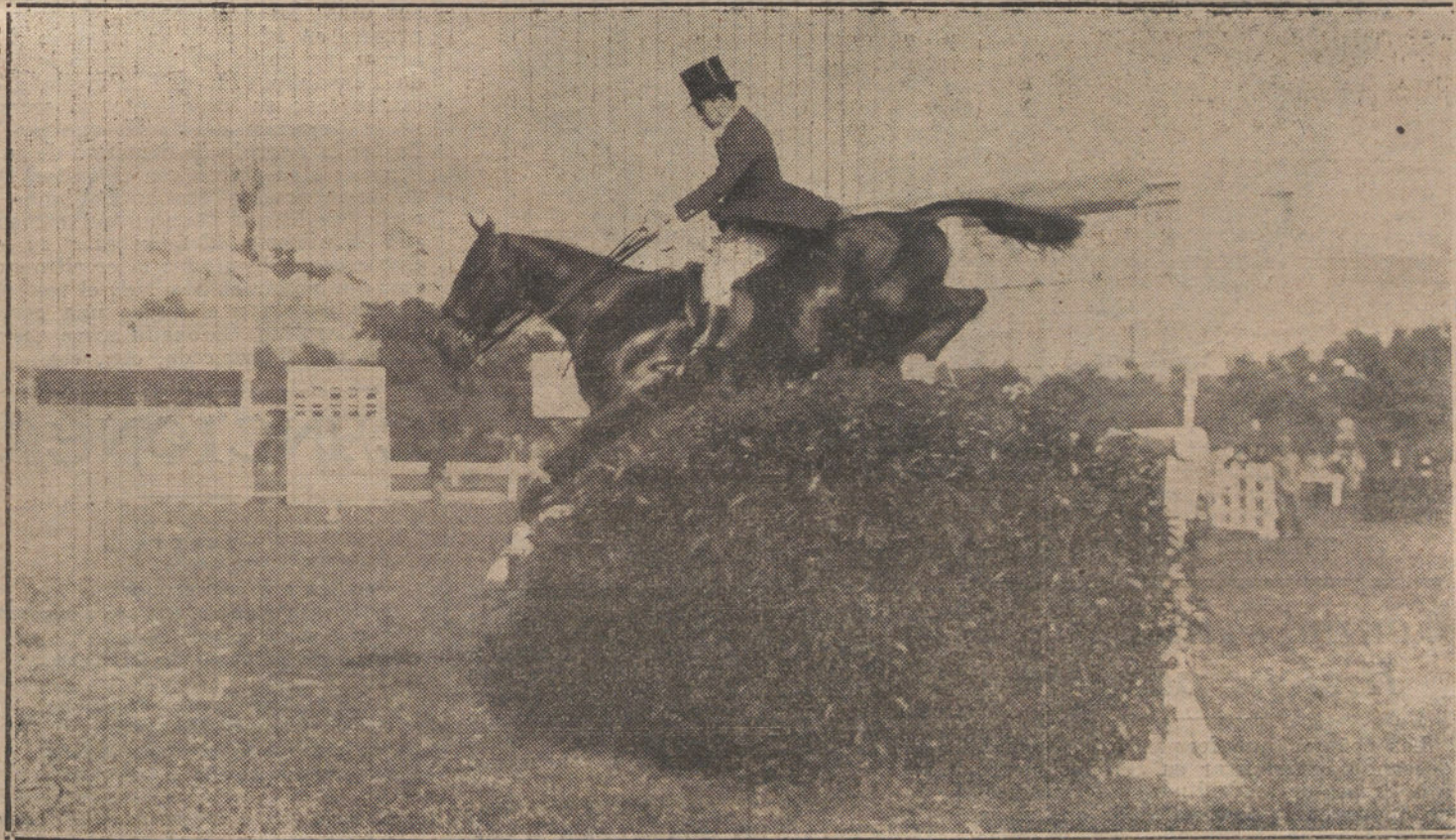
EL CONCURSO HIPICO.—Don Carlos Figueroa en una de las pruebas de saltos verificadas ayer en el Hipódromo de la Castellana.