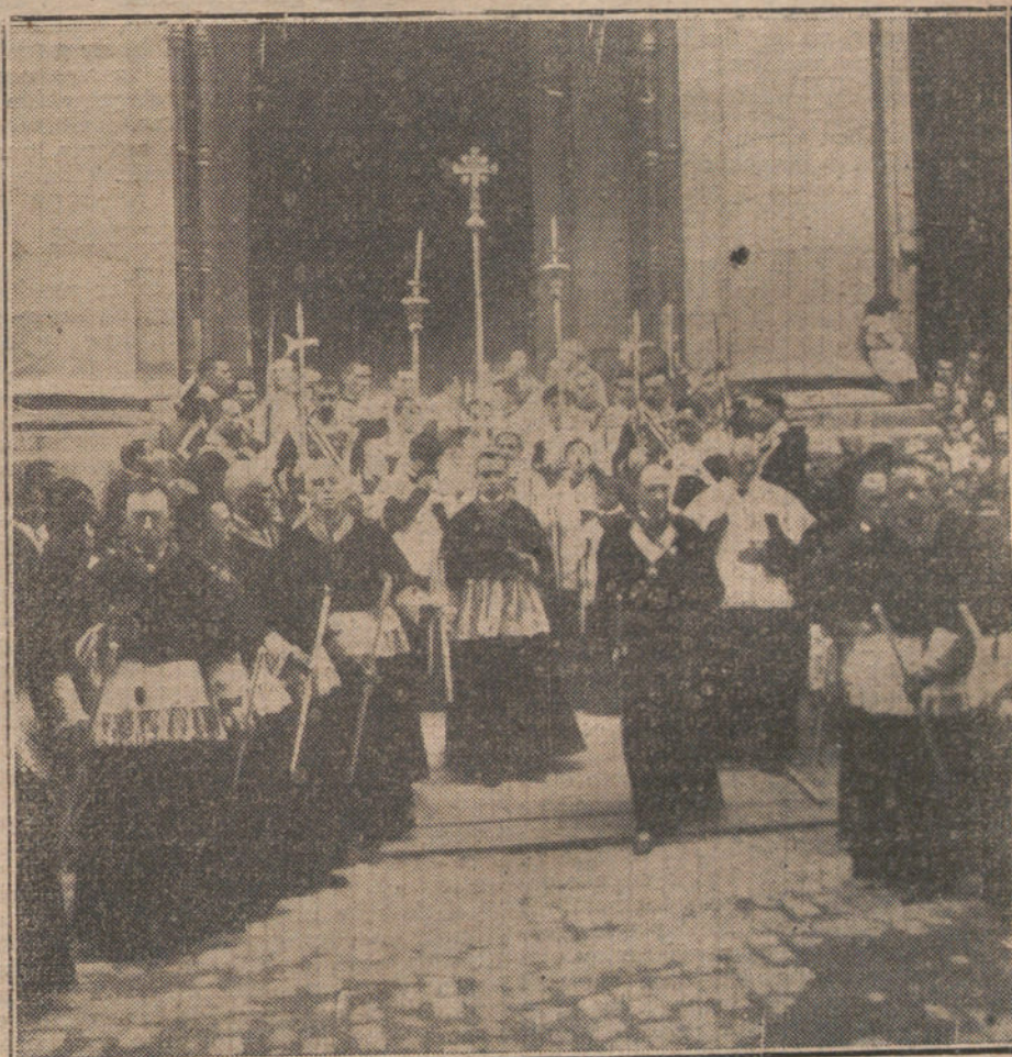
EL CORPUS EN MADRID. —Salida de la tradicional procesión, que después fué suspendida, de la iglesia catedral. (Fot. VIDAL)

Pues bien, señores: después de la crisis de Octubre no se puede negar que gran parte de esas fuerzas que se habían organizado y otros importantes elementos políticos y sociales del país han iniciado un movimiento de protesta contra ese Gobierno. Registro el hecho; lo ofrezco a la consideración del Gobierno de Su Ma-