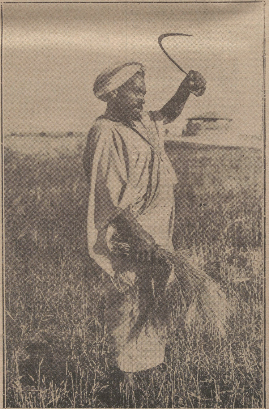
TIPOS MARROQUIES DE NUESTRA ZONA. —Segador moro trabajando en las proximidades de Zeluán, donde siembran los rifeños al amparo de nuestras tropas.

Lo que tenía que percibir necesariamente el gran público de la nación española, y no digo sólo de la nación española, sino el del extranjero, es que durante aquellos años de la oposición del partido conservador se habían fulminado constantemente amenazas, vetos, a los