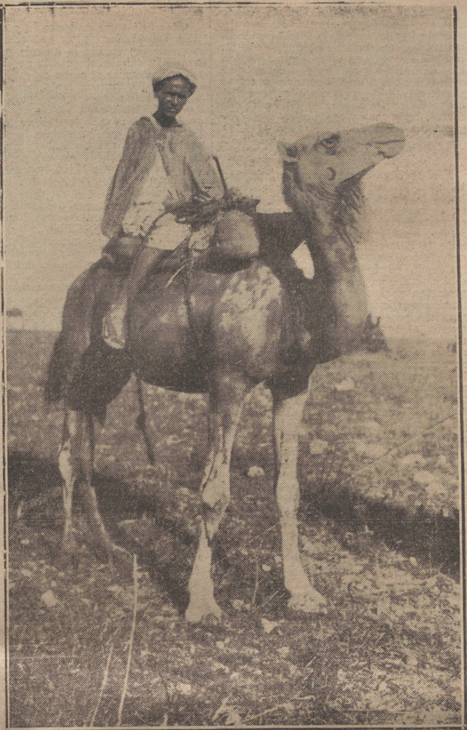
LOS MARR QUIES DE NUESTRA ZONA. —Moro de Beni-bu-Yahí trasladándose en un carro desde Zeluán hasta el campo enemigo.

personas, al Sr. Maura y a mí. Eso estaba en el conocimiento de todos; eso constituía una realidad política; estamos hablando aquí con toda sinceridad, y yo he de cumplir la promesa que hice en este sentido al principio de este discurso; eso lo creía todo el mundo. Y cuando sobrevino la crisis de Octubre y resultó constituido un Gobierno con la eliminación del Sr. Maura, a este modesto diputado ni se le invitó, ni se le consultó, ni se le buscó, ni se le notificó. Eso, que en otras circunstancias y con esta misma insignificante persona habría pasado absolutamente inadvertido, entonces era la confirmación de que se había ejecutado una operación, por virtud de la cual quedaban aquellos vetos cumplidos. (Rumores.)