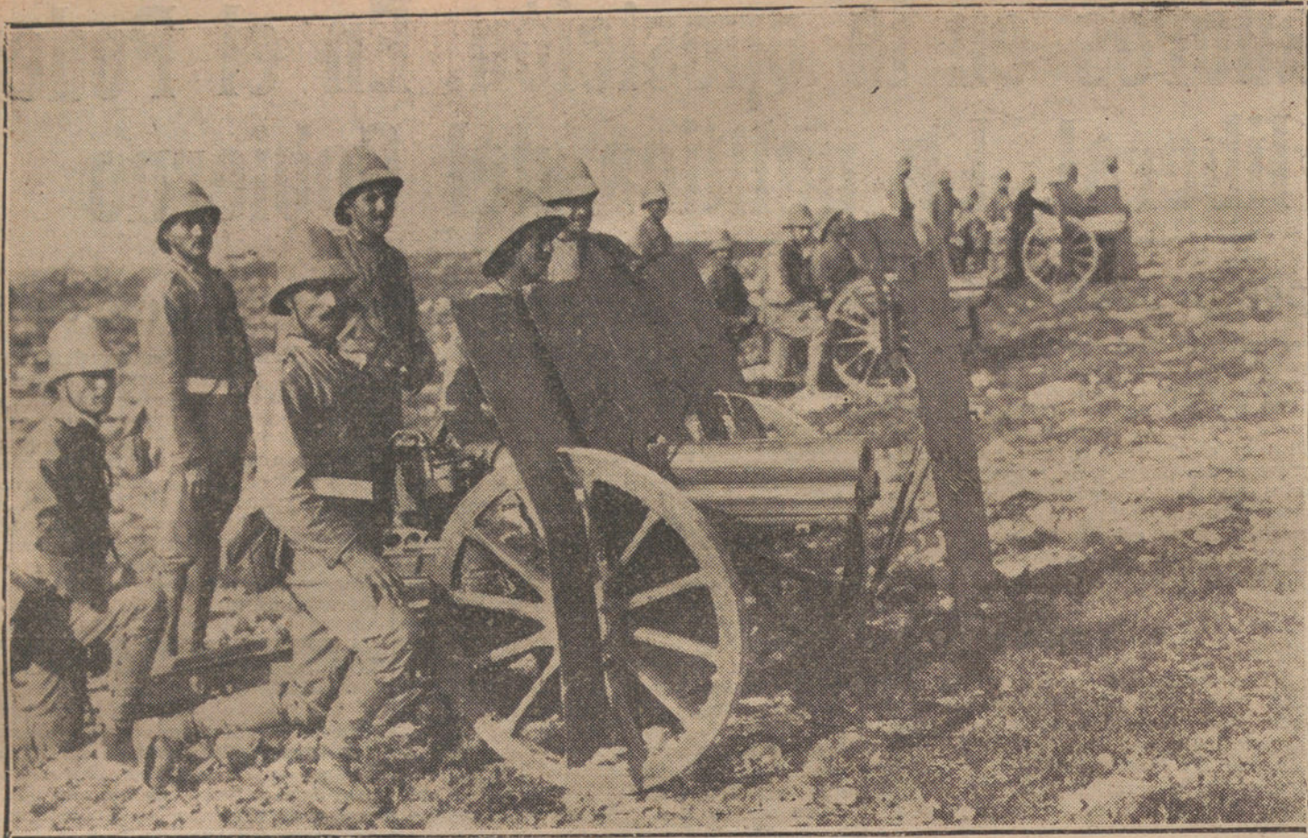
NUESTRA ACCION EN AFRICA. —Batería emplazada en el monte Gazu, momentos después de ser ocupado por las tropas del general Jordana, para proteger la ocupación de los montes Ámeyer y Cansesva.

No volví a ver al Sr. Maura. Salió de Madrid, como él ha explicado, y yo no tuve más noticias que la de que no se encargaba de formar Gobierno. Transcurrieron dos días, me parece; se constituyó el Gobierno del Sr. Dato; el Sr. Dato, ni directa ni indirectamente, a mí, ni me vió ni me consultó (El señor presidente del CONSEJO DE MINISTROS: Exacto), ni tenía para qué.