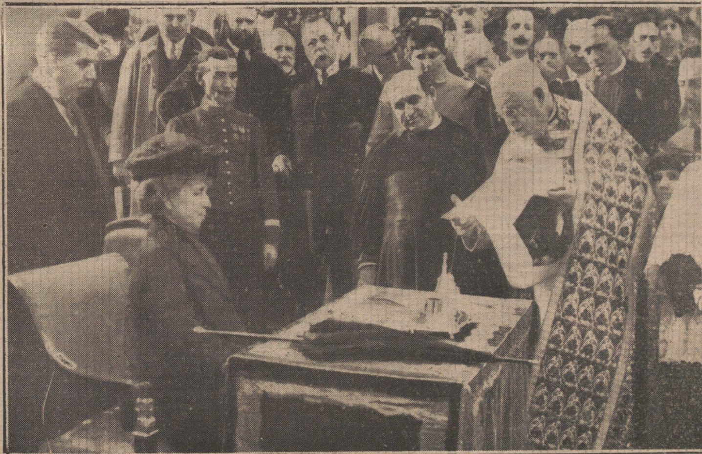
Ceremonia de la colocación de la primera piedra para el edificio destinado a Escuelas del Ave María. S. M. la Reina Cristina oyendo la lectura del acta.

Hoy celebraron los exploradores la promesa a la bandera, asistiendo patrullas de Zaragoza, Miranda, Vitoria y Bilbao, a quienes se les obsequió con un banquete. Esta tarde celebraron un festival en la Plaza de Toros.