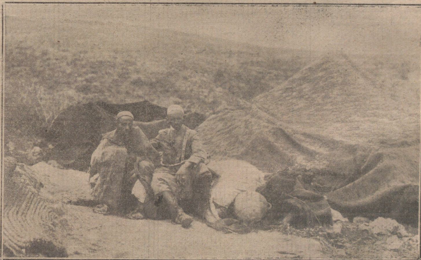
LOS ULTIMOS COMBATES EN MELILLA.—Policia moro custodiando á un prisionero que hizo fuego sobre nuestras tropas, por lo cual fué destruida su casa, en la falda del monte Ziata.

Es un exceso de cortesía, un alarde de longanimidad. ¿Para qué le sirve al maurismo toda esa taifa de conservadores «idóneos» que ha armado el «artefacto subalterno del tinglado del conde de Romanones»? Más tarde, cuando después del paso por la opinión pública suba la ortodoxia conservadora á gobernar, entonces se cuidarán