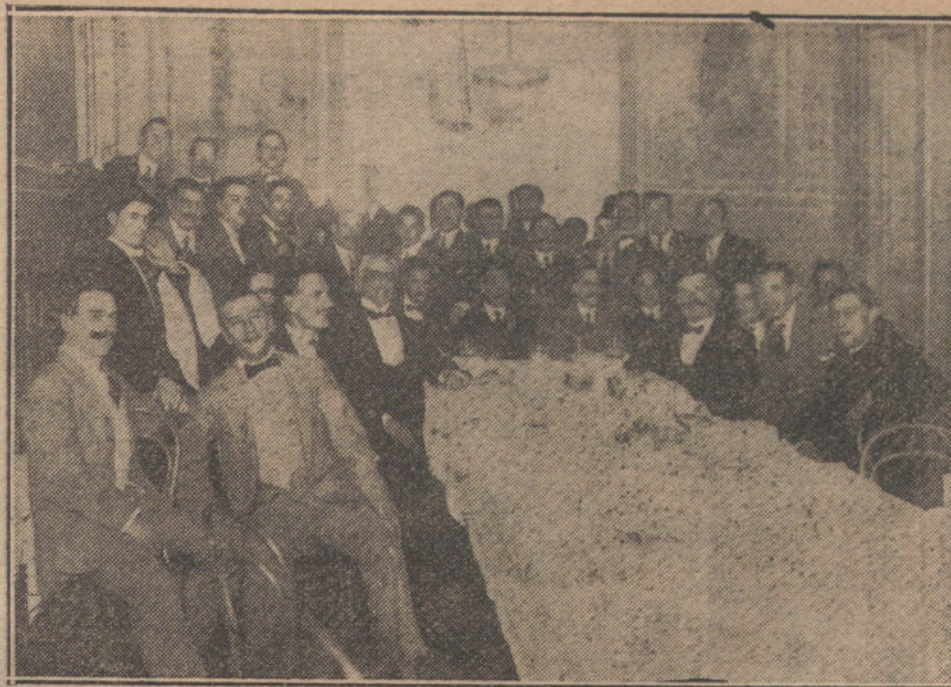
Banquete celebrado por la Unión Velocipédica Española con motivo del Campeonato de España, (Fot. BERRIATUA)

llama por teléfono preguntándome lo mismo.