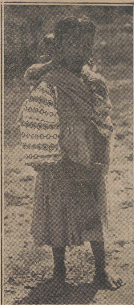
TIPOS MOROS DE LA ORILLA DEL KERT.—Niña mora típicamente ataviada, conduciendo a su hermanito.

Se oyó fulminante la voz del prior: —¿Queréis mi respuesta? Pues bien, monseñor, me importa muy poco la furia papal, decid a Alejandro que tiemble por él.