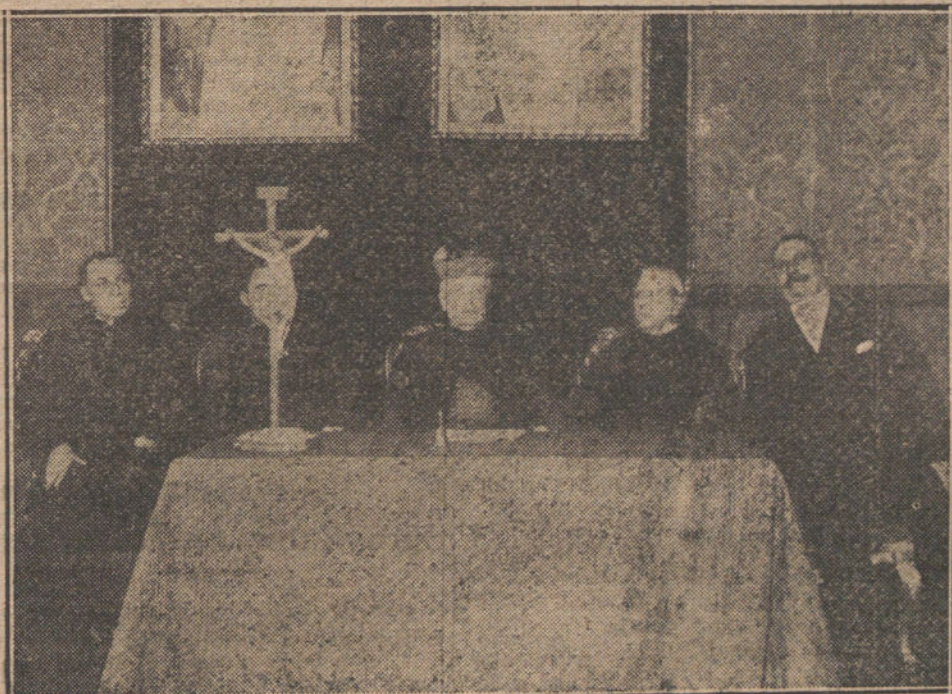
El obispo de Madrid-Alcalá presidiendo la primera sesión de la Asamblea Diocesana, verificada esta mañana en el palacio arzobispal.

Por el servicio telefónico de nuestro corresponsal vieron que el diestro, a pesar de la gravedad de la herida que sufre, hay gran confianza en que pueda curar.