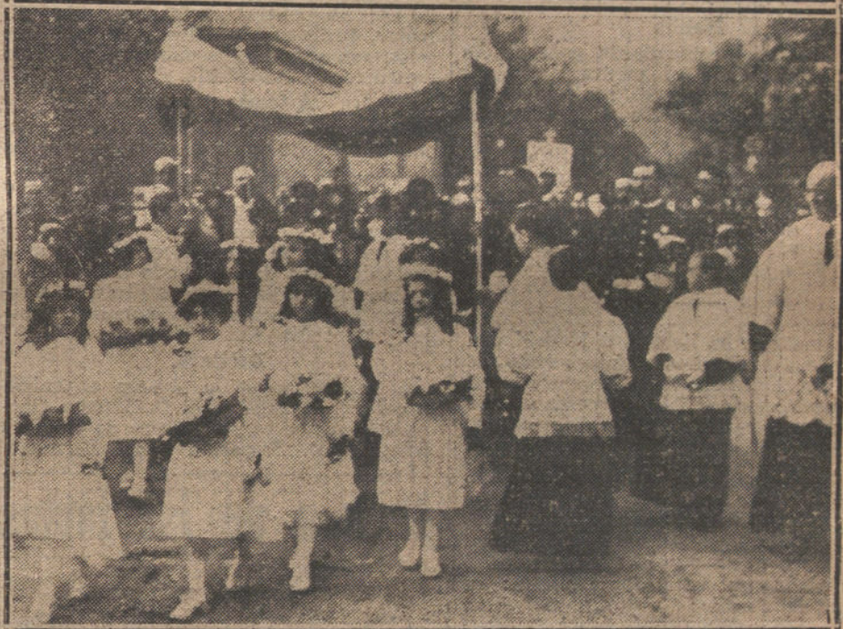
LA OCTAVA DEL CORPUS EN EL COLEGIO DE LAS URSULINAS.—Niños y niñas de la aristocracia que tomaron parte en la procesión verificada ayer tarde, (Fot. VIDAL)

ca con su palabra efectos análogos, fuera de la clientela? Observad el fenómeno. ¿Será ó no será arte la «grandilocuencia»? ¿La grandilocuencia no, y el estilo telegráfico sí?