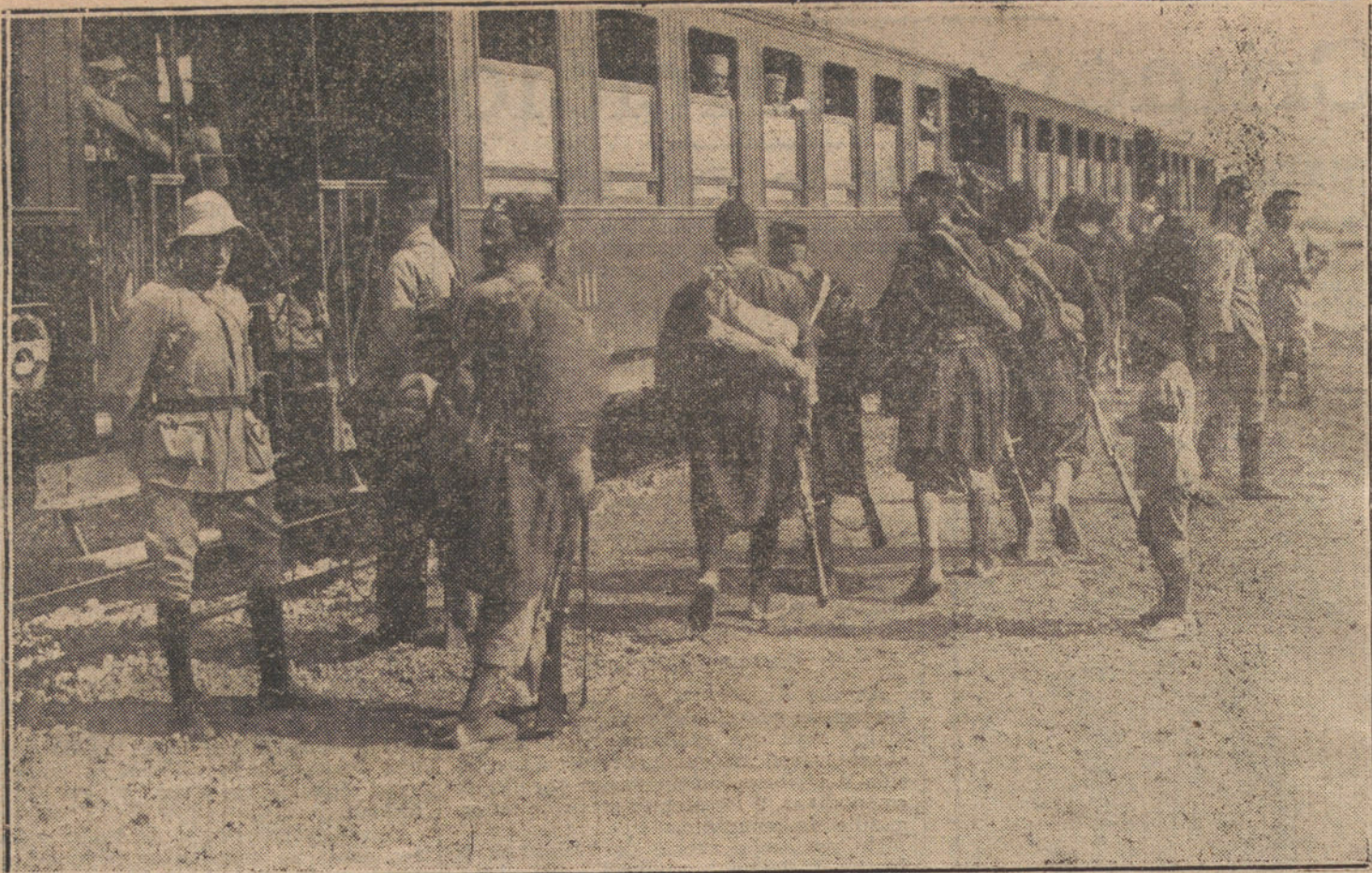
NUESTRAS TROPAS EN AFRICA.—Soldados de la Policía indígena montando en el ferrocarril de Nador a Zeluán, para trasladarse a las nuevas posiciones del monte Ziata.