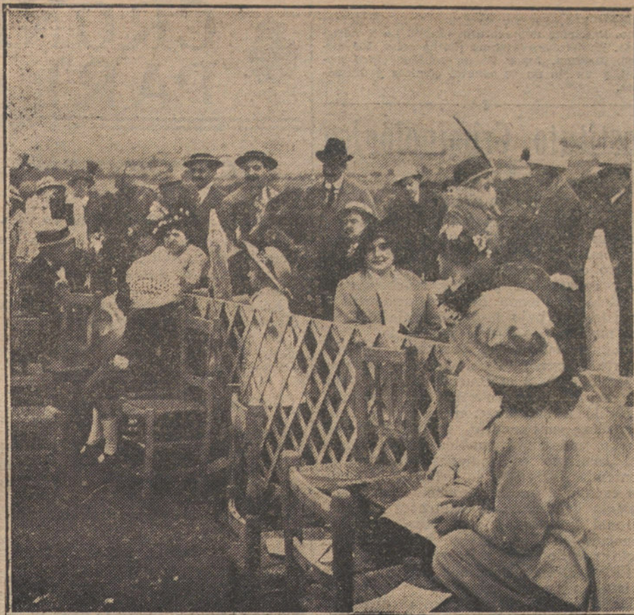
LAS FIESTAS DE TOLEDO.—Un detalle del Campo de Tiro de Toledo, donde se está celebrando el Concurso de tiro de pichón, organizado con motivo de las fiestas.

PARIS. Dicen de Lourdes que el número de obispos y cardenales inscriptos para tomar parte en el próximo Congreso Eucarístico, que se celebrará en aquella ciudad, se eleva a 79, de los que hay siete españoles. Hallet.