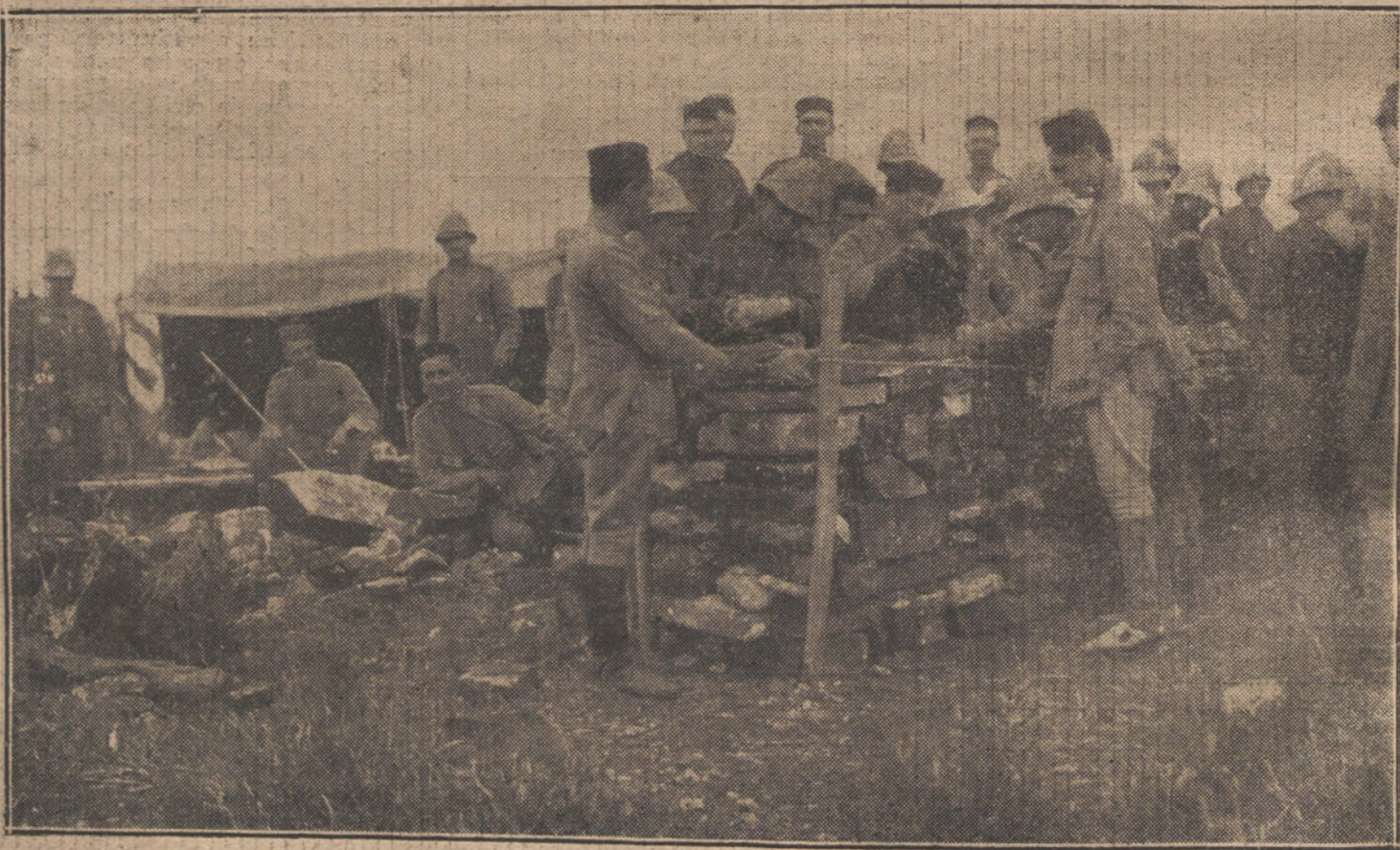
NUESTRAS TROPAS EN AFRICA.—Fuerzas del regimiento de Melilla construyendo parapetos en el Arsú, posición recientemente ocupada.

Las inscripciones para este Campeonato deben ser dirigidas al «Secretario del Comité directivo del Campeonato nacional de Espada», Jardines, 4, hasta el día 26 del actual.