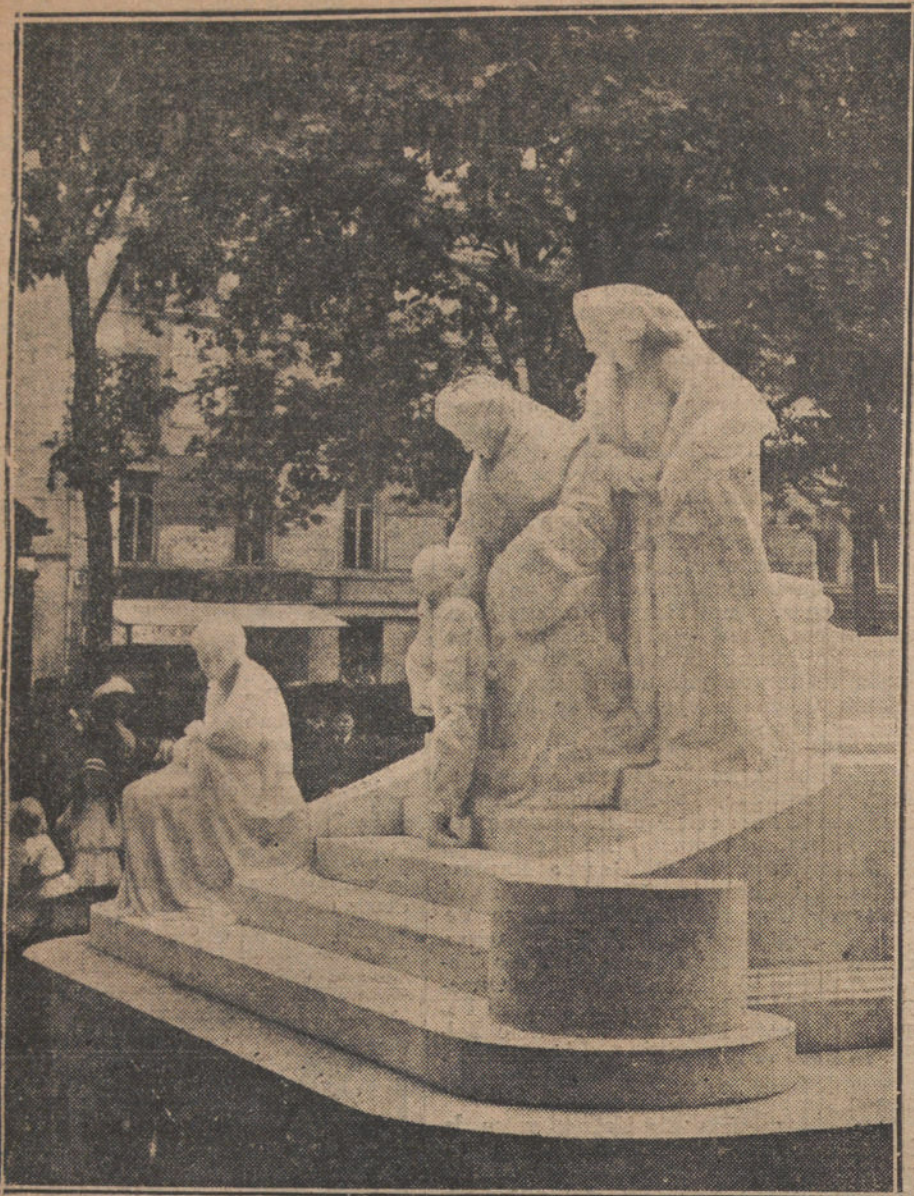
Monumento á Mme. Boucicaut y la baronesa de Hirsch, caritativas damas francesas á las que se deben importantes obras de beneficencia, erigido recientemente en París, por disposición testamentaria de M. Osiris, que legó para la obra 100.000 francos.

En estas Escuelas se daban también conferencias sobre colonización y expansión comercial, sobre historia y geografía de nuestra zona, sobre las costumbres y psicología del país marroquí, y se hacía una intensa y próspera obra educativa popular, difundiendo los grandes deberes que en este Imperio habíamos de cumplir, los fundamentos de nuestra empresa civilizadora, sin falsear nunca el problema africano, sin hablar de guerra, ni de razias ni de la necesidad de amontonar haces de cabezas de cabileños en la plaza de Es-