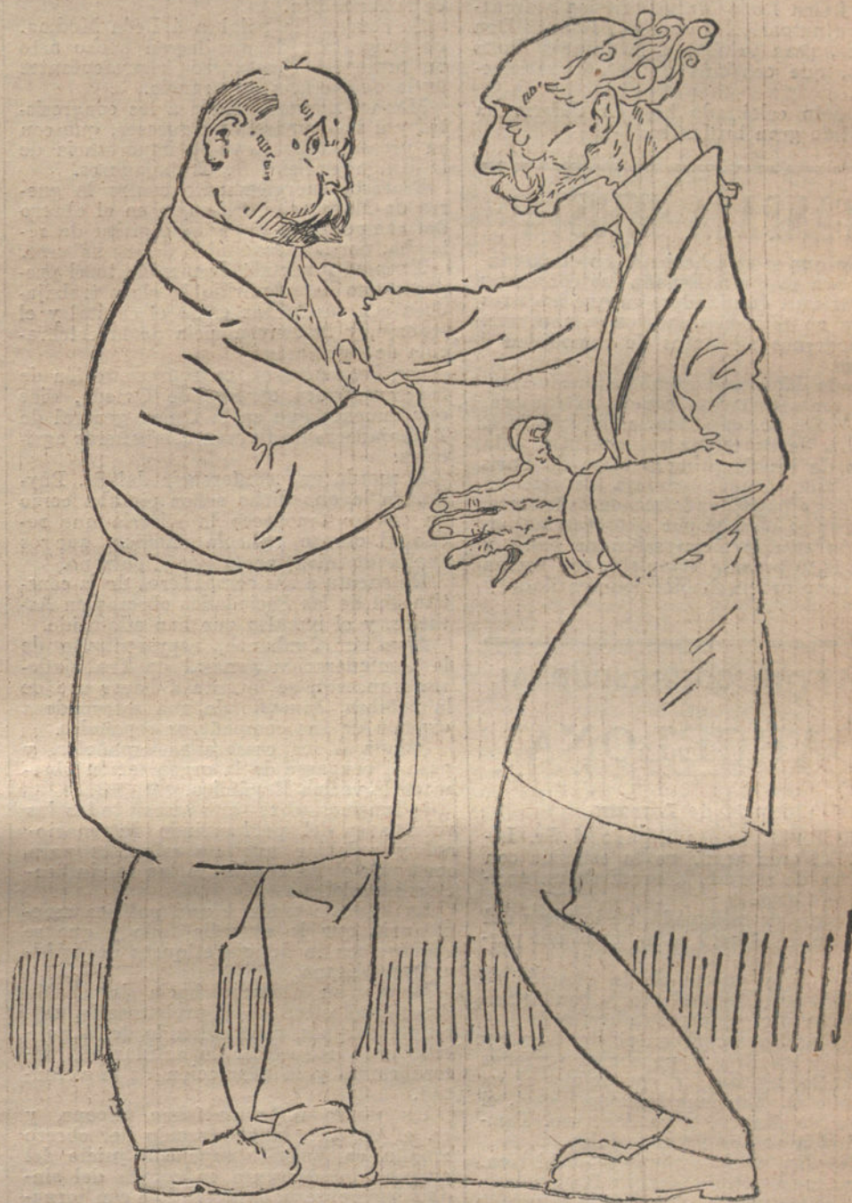
DON JUAN. —Esté usted tranquilo, querido Dato; ya verá usted hasta donde llega mi apoyo.