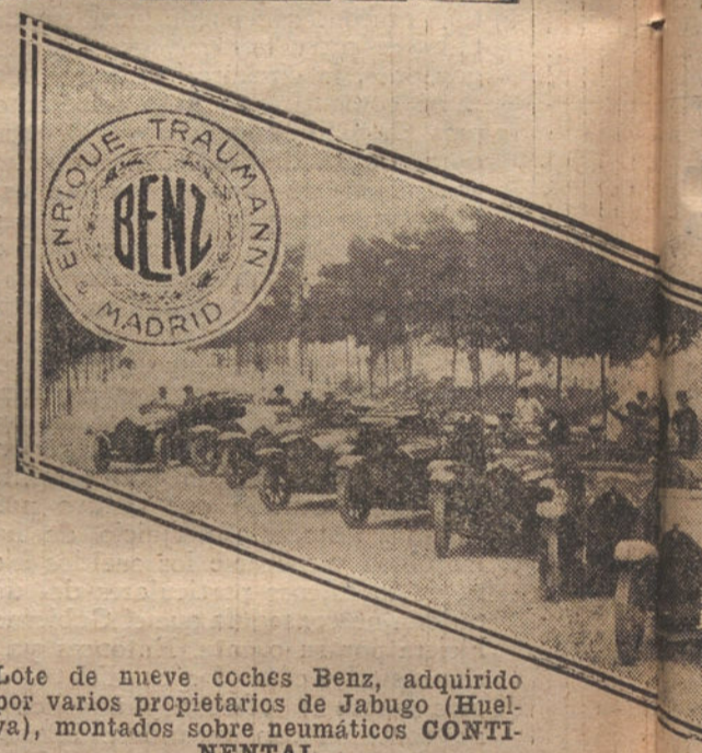
Lote de nueve coches Benz, adquirido por varios propietarios de Jabugo (Huelva), montados sobre neumáticos CONTINENTAL

Esto es lo que ha podido calcularse; pero seguramente algunos corredores saron de estas cifras, y algún coche maravillará a los espectadores.