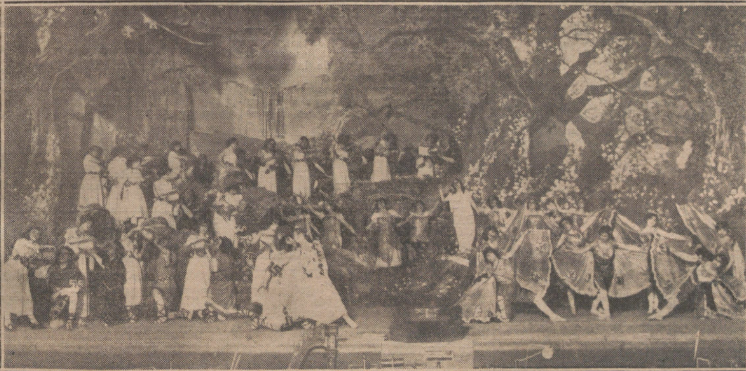
Escena final del segundo acto de la opereta de Sánd Armesa y Compañía de Campo «La flor del Campo», que se estrena esta noche en la Zarzuela.

El estado de los dos desdichados es muy grave.