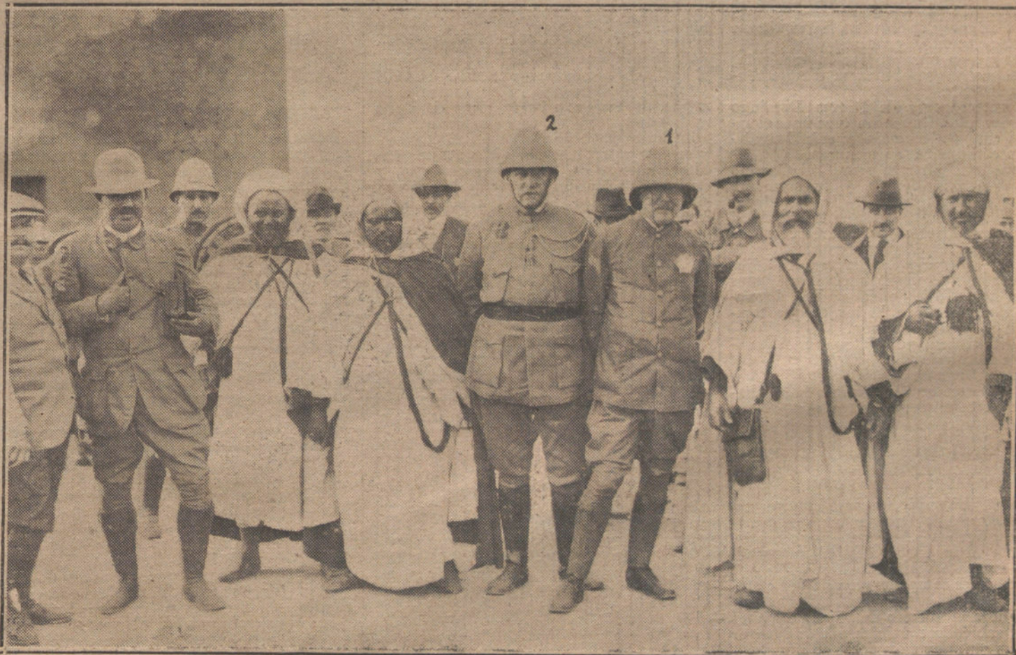
VISITA DEL EMBAJADOR INGLÉS A MELILLA.—El general Jordana y el embajador inglés, sir Arthur Hardinge, con los jefes de las tropas que fueron á Melilla por la ocupación de Ziata y el Garet.