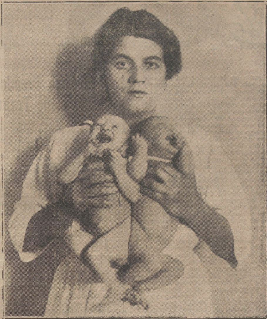
Las dos gemelas unidas por el hueso sacro, á las que piensa operar el doctor Mignot. Las niñas nacieron en París el 22 de Mayo último, pesan 5 kilos y 950 gramos y se encuentran en perfecto estado de salud.

La lucha fué sangrienta y los moros tuvieron que retirarse con grandes pérdidas. Entre las bajas de los franceses figuraba un coronel y varios muertos y numerosos heridos.—Hallet.