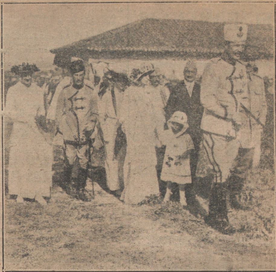
LOS SUCESOS DE ALBANIA.—Los Soberanos de Albania y su familia revistan a un destacamento de tropas leales.

Y agregamos nosotros que nos parece de perlas la idea de influir en Bruselas