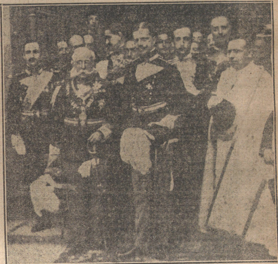
El Infante Don Fernando y el Capítulo de la Orden de San Juan de Malta, saliendo de la iglesia del Sacramento, donde se ha celebrado esta mañana la función religiosa que anualmente se dedica á San Juan.

Yo estoy seguro que el Sr. Maura contempla sus antiguas huestes con más compasión que encono; yo estoy seguro que comprende, y hasta disculpa, sus flaquezas, que tan humanas son; porque él sabe que vicios seculares no se desarraigan en un solo día; porque el águila no puede pretender que en su vuelo le sigan los gorriónes.