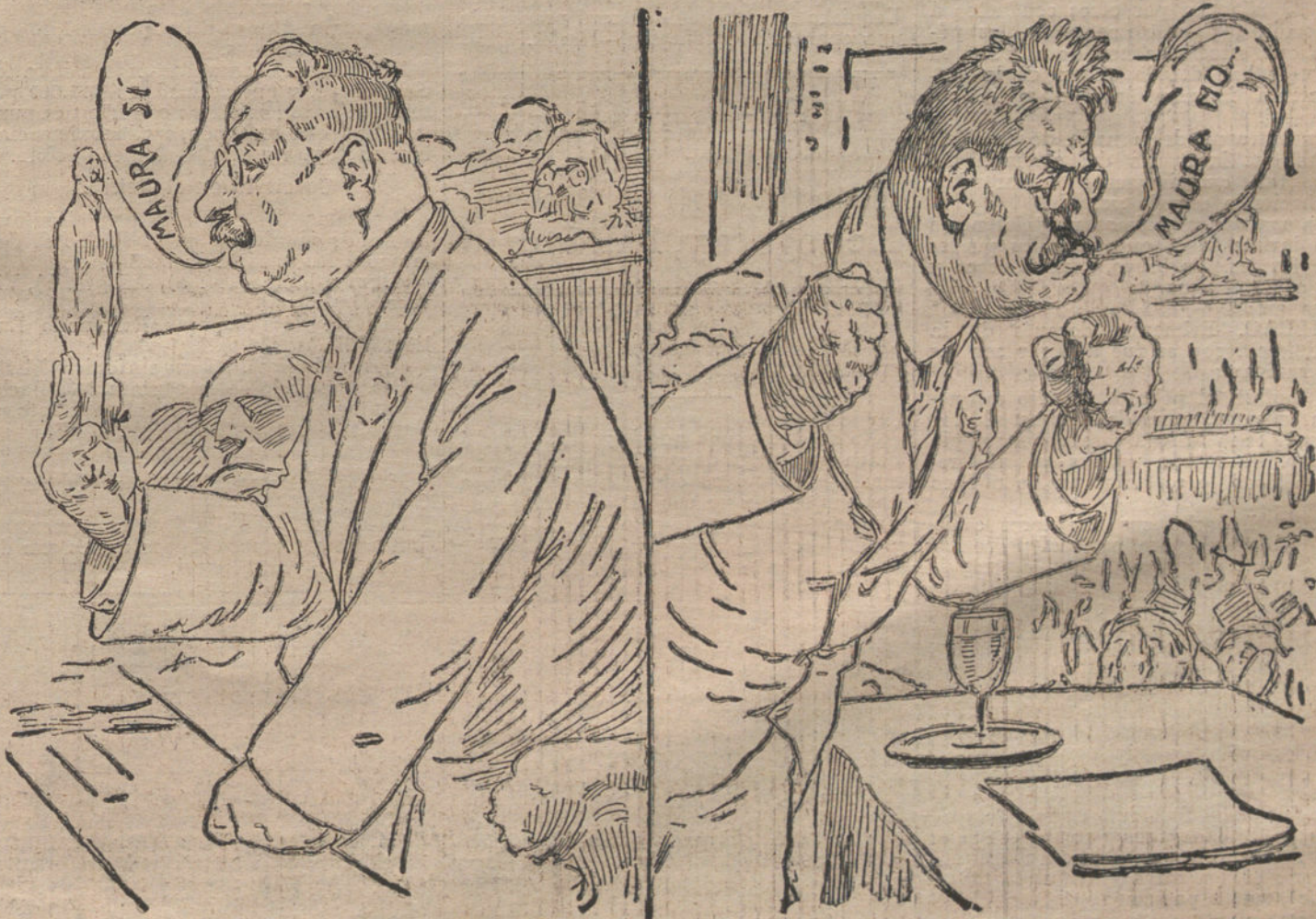
EN EL PARLAMENTO