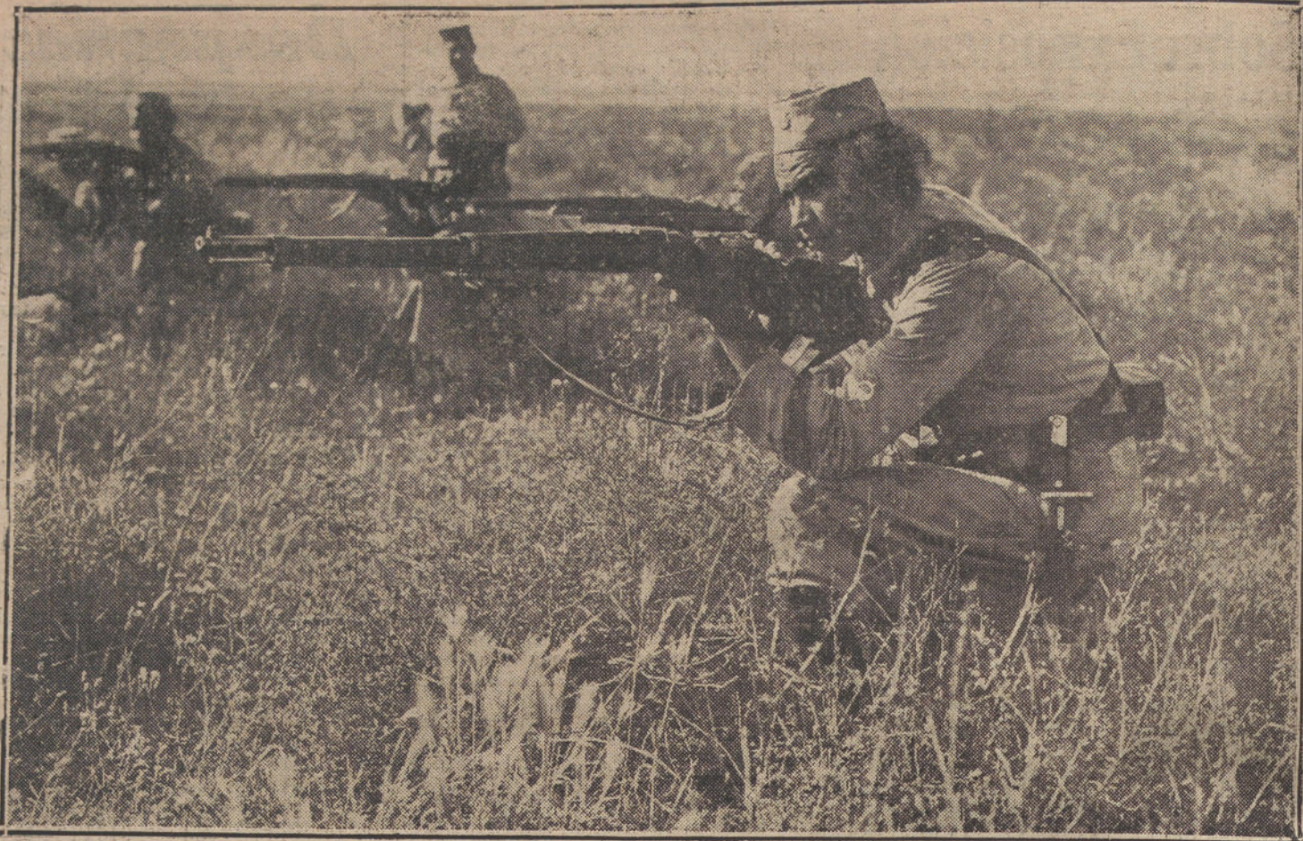
LAS ULTIMAS OPERACIONES EN MELILLA. —Moros del tabor de Alhucemas haciendo fuego contra el enemigo en las estribaciones del Garet, para proteger el avance de nuestras tropas.

NUMERO DEL TELEFONO DE LA REDACCION, ADMINISTRACION Y TALLERES DE «LA TRIBUNA»: 4.444