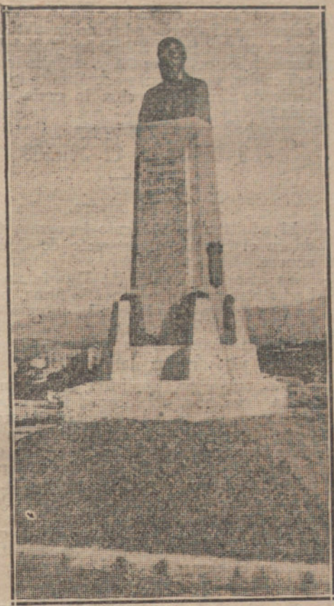
Monumento al sabio polígrafo Eduardo Saavedra, erigido en Tarragona por suscripción popular. Obra del gran escultor Julio Antonio.

(1) Pirenne, «Histoire de Belgique», tomo IV, libro I, cap. I.