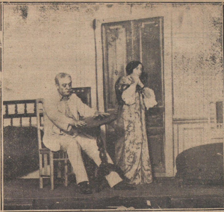
Una escena del primer acto de la comedia «Su afectísimo amigo», del Sr. Avelilla, estrenada anoche en el teatro Alvarez Quintero.

Nosotros hemos procurado esclarecer la parte oscura de lo sucedido, y de nuestros informes se deduce que Epifania sostenía relaciones con un caballero, del que