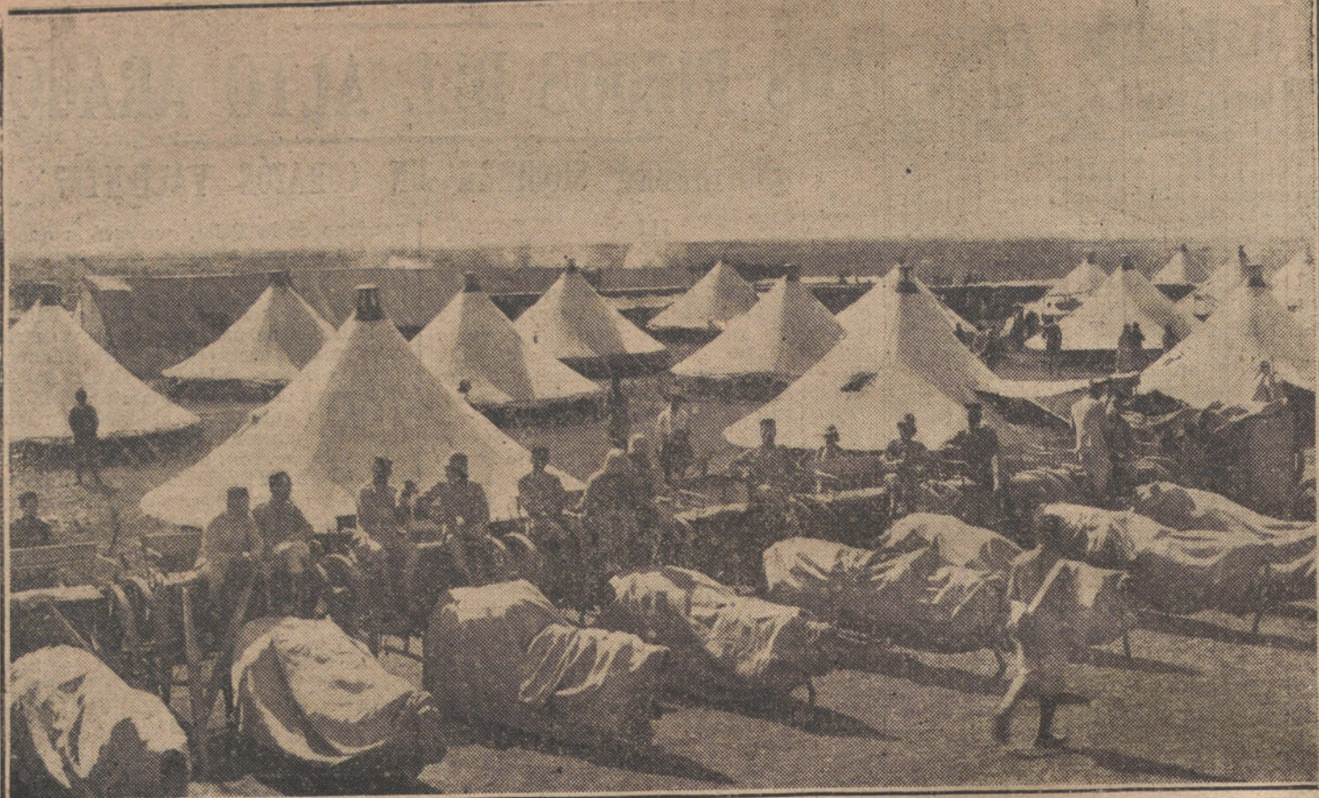
LAS NUEVAS POSICIONES DEL GARET.—Campamento de Kudia-El-Uta, ocupado por nuestros soldados en el último avance.