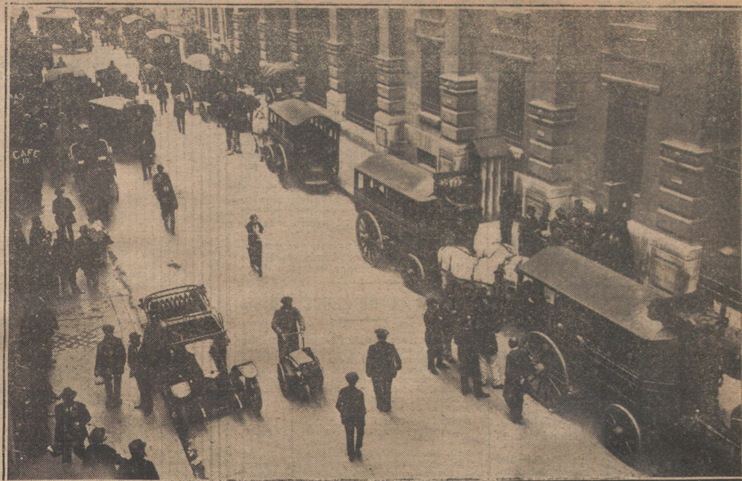
LA HUELGA DE CARTEROS DE PARÍS.—Coches del servicio de Correos de tenidos frente al palacio de Comunicaciones.

El caso de todo un señor ministro que acude á las dependencias de la Casa de Correos de París para discutir, suplicar, rogar y hacer promesas á sus subordinados levantiscos, es insólito y difícilmente lo comprenderían otros señores ministros de otros países. Antes que «descender» á la discusión, antes que aparecer como sometido á las exigencias de los rebeldes, cualquier otro ministro de cualesquiera otro país habría juzgado que su prestigio y su representación exigían el fusilamiento de quince ó veinte insubordinados. ¿Cómo tolerar que unos insolentes carteros impongan su voluntad á grito pelado, con amenazas, cerrando las verjas de la Casa de Correos é interrumpiendo el reparto de cartas? ¿Cómo podría todo un señor ministro dejar la poltrona para ir á predicar orden y calma? ¿Para cuándo quedan los fusiles de la fuerza pública? ¿No se expone un Gobierno que obra así á que las gentes digan que no tiene energía y que tiene miedo? Y en España, donde los riñones son el supremo argumento en todas las cuestiones, esto será más inexplicable aún. Un Gobierno español no hará nada para demostrar que no prevaricó ó que los ministros no son acéfalos; pero, en cambio, es capaz de degollar á varias docenas de ciudadanos sólo porque haya habido alguien que ponga en duda la cantidad de ri-