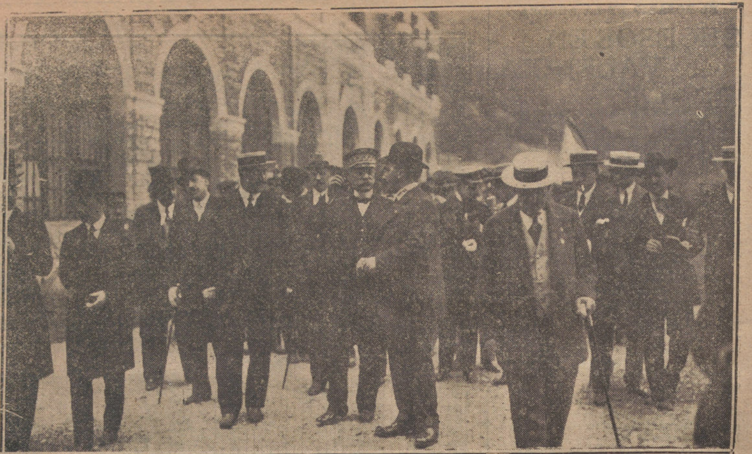
LA EXPOSICION DE EIBAR.—El ministro de Fomento, acompañado del arquitecto Sr. Aguirre y las autoridades de San Sebastián y Eibar, inaugurando la Exposición.

El campamento fué visitado también por numerosas familias de Madrid.