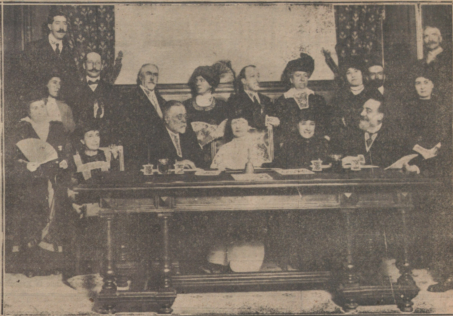
La reunión celebrada esta mañana en el Senado, para solicitar el ingreso de la condesa de Pardo Bazán en la Real Academia Española.

PARA TODO LO REFERENTE A PUBLICIDAD FRANCESA EN «LA TRIBUNA», DIRIGIRSE A NUESTRA AGENCIA EN PARÍS: 22, RUE VIENNE, 22.