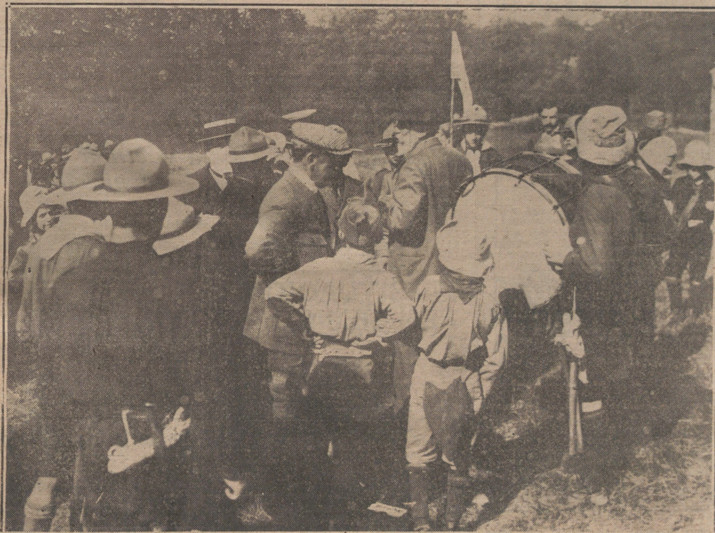
LOS EXPLORADORES EN RIOFRIO.—El ministro de la Guerra durante la visita que hizo ayer tarde al campamento de los exploradores.

El conde de Romanones ha estado en Argel en Julio de 1911. Libre.