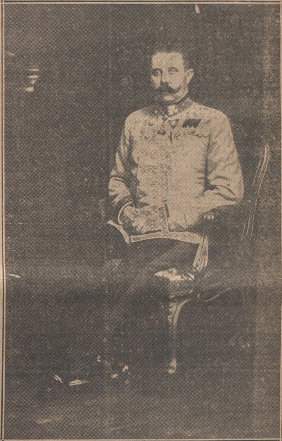
El Archiduque Francisco Fernando, asesinado ayer en Sereievo.

¿No es absurdo, lector, que el órgano de un partido popular y revolucionario, que se arroga la representación de las quintaesencias democráticas, se oponga y ridiculice la celebración de un mitin político? Cuando los radicales hayan agotado todos los razonamientos y todas las arbitrariedades, nadie estará convencido de la lógica