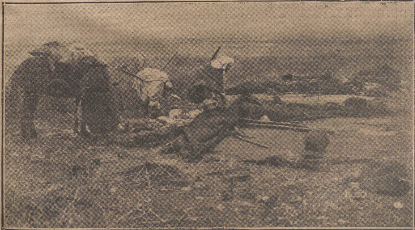
Los moros de Ulad-Abdam levantando sus «almás» y cargando sus enseres para ir al campo enemigo ante la presencia de nuestras tropas en Testudin.

LA TAREA DE DEVOLVER TODOS LOS TRABAJOS QUE NO PUBLICAMOS SERIA ABRUMADORA, Y PARA EVITARLA, COMO PARA PREVENIR RECLAMACIONES, QUE RESULTARIA IMPOSIBLE ATENDER, RECORDAMOS QUE NO SE DEVUELVEN LOS ORIGINALES.