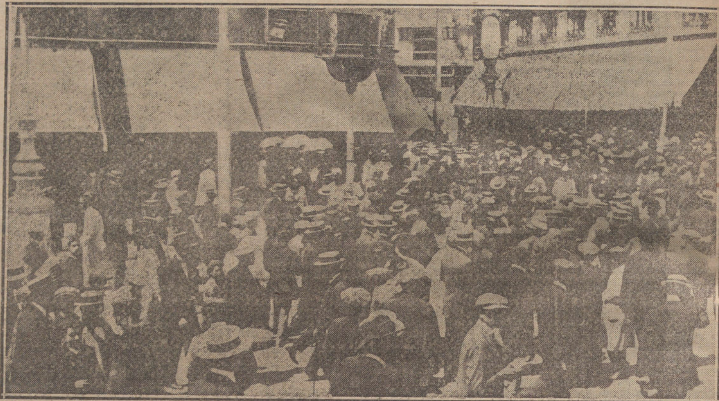
La manifestación de esta tarde al entrar en la calle de Preciados, después de protestar ante el ministerio de la Gobernación.

El pueblo, en indignado. Manifestaciones públicas. En el Ayuntamiento. Recorriendo las calles. La actitud del alcalde. Continúa la excitación. Otras noticias.