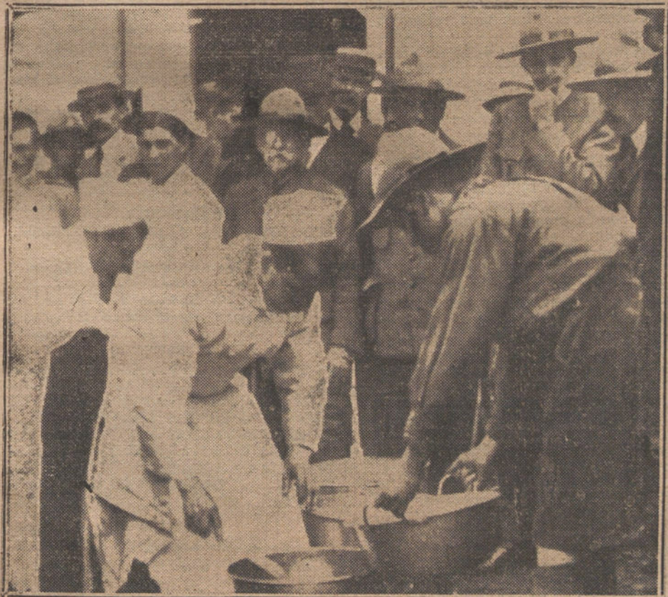
LOS EXPLORADORES EN RIOFRÍO.—S. M. el Rey probando el rancho de los explorados en el campamento de Riofrío. (Ampliación de una película de la «Revista-Pathé».)

de su conducta, y quedará una sola razón: la amenaza contenida en las últimas líneas del artículo.