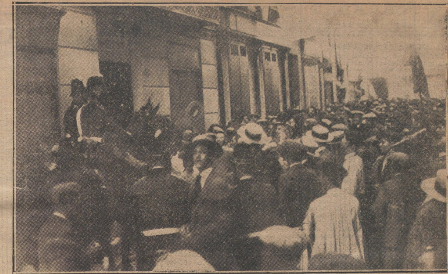
LA PROTESTA CONTRA LOS FABRICANTES DE PAN.—Grupos asaltando una tahona en la calle de Barbieri, y la Policía conteniendo el tumulto.

Todos trabajaron como buenos; pero seríamos injustos si no citáramos a los barceloneses, los cartageneros y los madri-