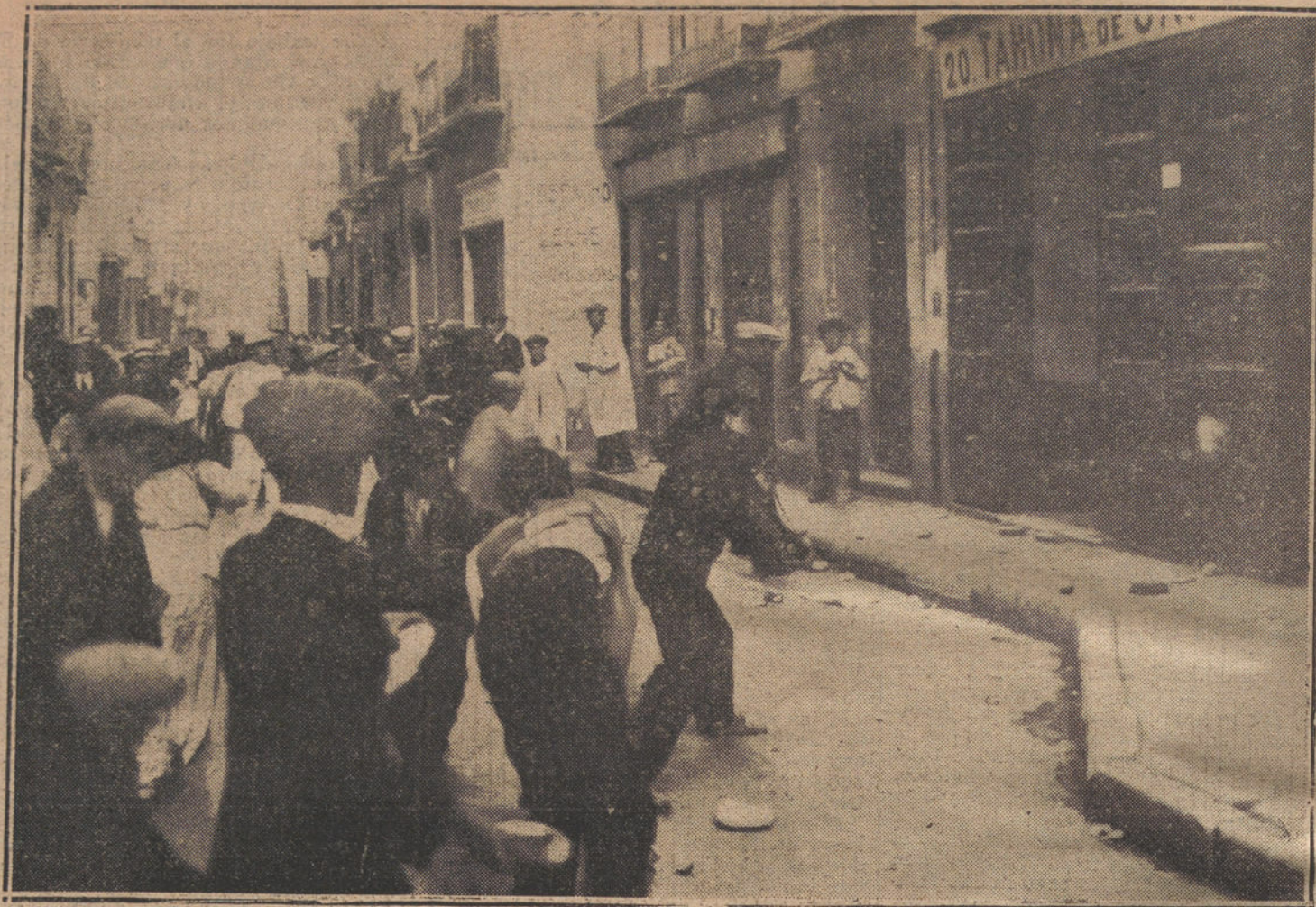
LA PROTESTA CONTRA LOS FABRICANTES DE PAN.—Grupo de manifestantes destruyendo la puerta de una tahona en la calle de Jardines.