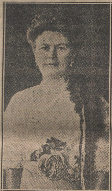
La Archiduquesa Sofia Chotek, asesina en las calles de Sarajevo.

VIENA. Los restos del Archiduque heredero y de su esposa, que fueron embalsamados anoche, han sido trasladados por ferrocarril desde Sarajevo á Mitkowitz; de donde serán transportados á Dalmacia.