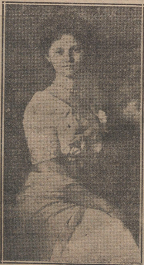
La Princesa Zita, esposa del Archiduque Carlos Francisco Fernando, heredero del Trono de Austria.

servia, el propietario del hotel de Europa en Sarajevo.