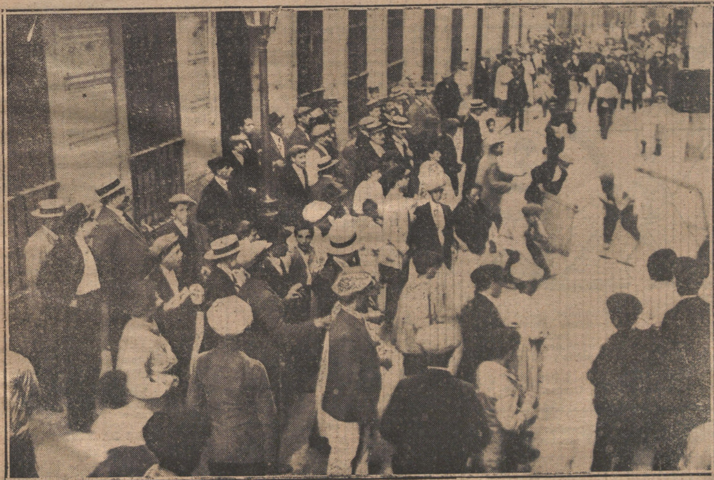
LA PROTESTA CONTRA LOS FABRICANTES DE PAN.—Público presenciando la destrucción de una tahona.

Para todo lo referente a publicidad francesa en LA TRIBUNA, dirigirse a nuestra agencia en París, rue VIVIENNE, 22.