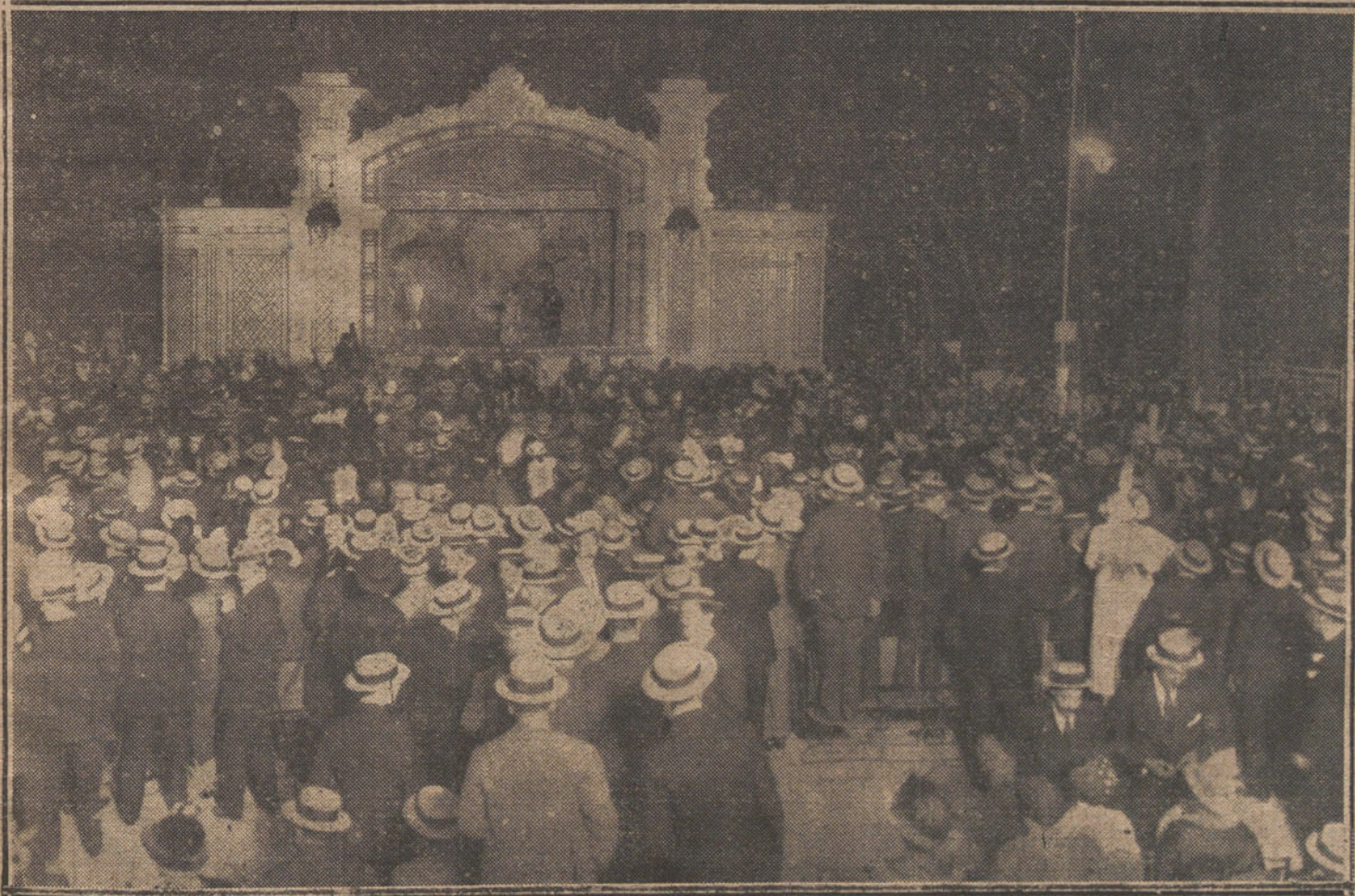
Aspecto del teatro del Retiro durante la función a beneficio de la Asociación de la Prensa, verificada anoche, para inau-

re la temporada de verano.