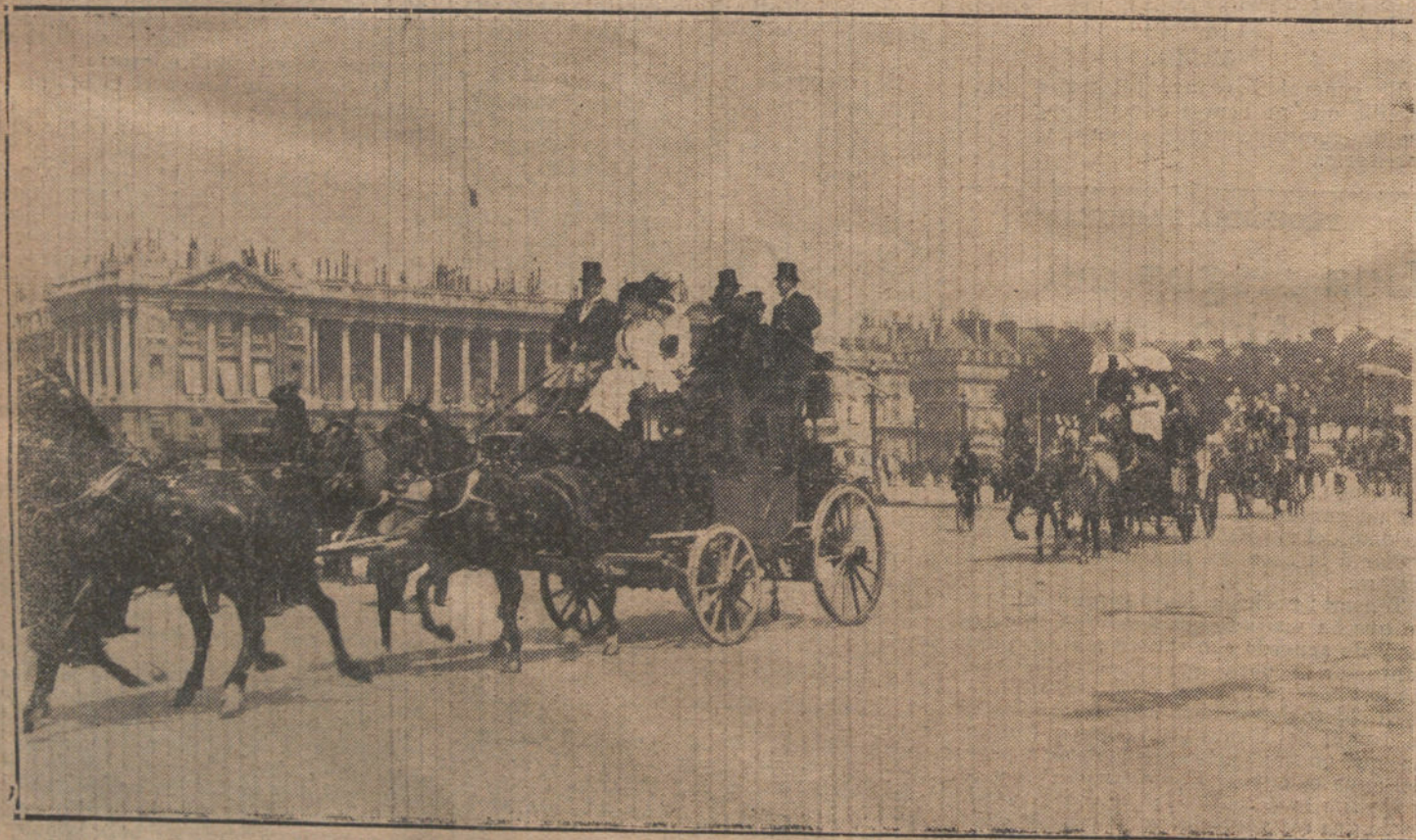
LAS CARRERAS DEL GRAND-PRIX.—El día de los «mail-coaches».—Los típicos «mail-coaches» saliendo de la plaza de la Concordia.