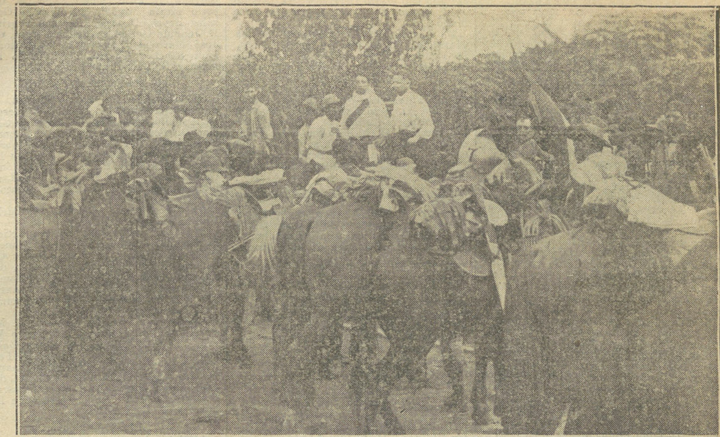
Grupo de guerrilleros constitucionalistas escuchando una arenga.

En estas condiciones llegó Madero á las muchedumbres. Era Madero, ante