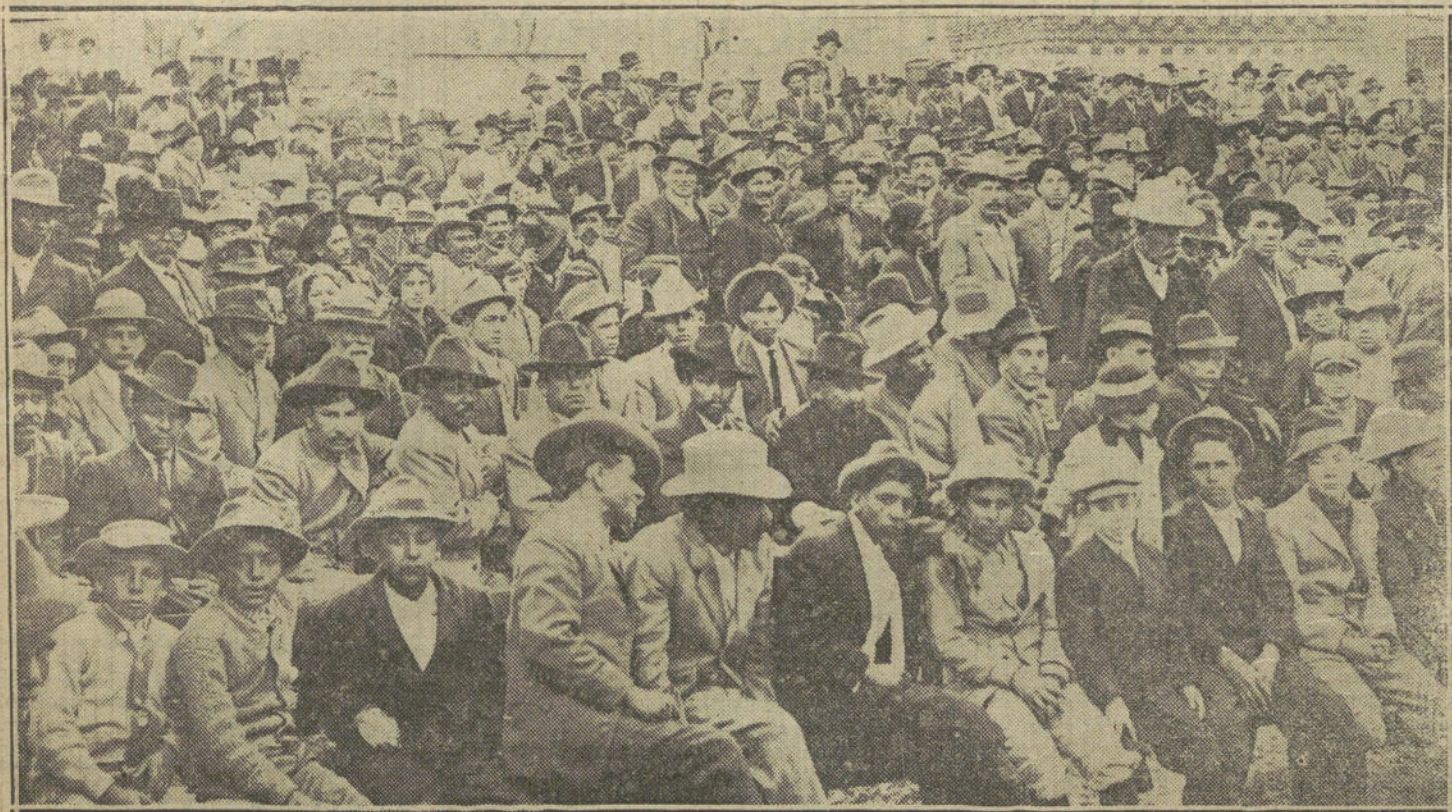
Mitín constitucionalista, celebrado en Laredo.

«El respeto al derecho y á la majestad del Estado se habría destruido en la con- ciencia pública. La verdadera fuerza del Estado está en la equidad y en la justi- cia, que nosotros aspiramos á robustecer, condenando siempre la anarquía, y el comercio de Madrid sólo pide á los Po- deres públicos, orden y garantía para todos los ciudadanos, y todo el rigor de la ley para los que á ella faltan.»