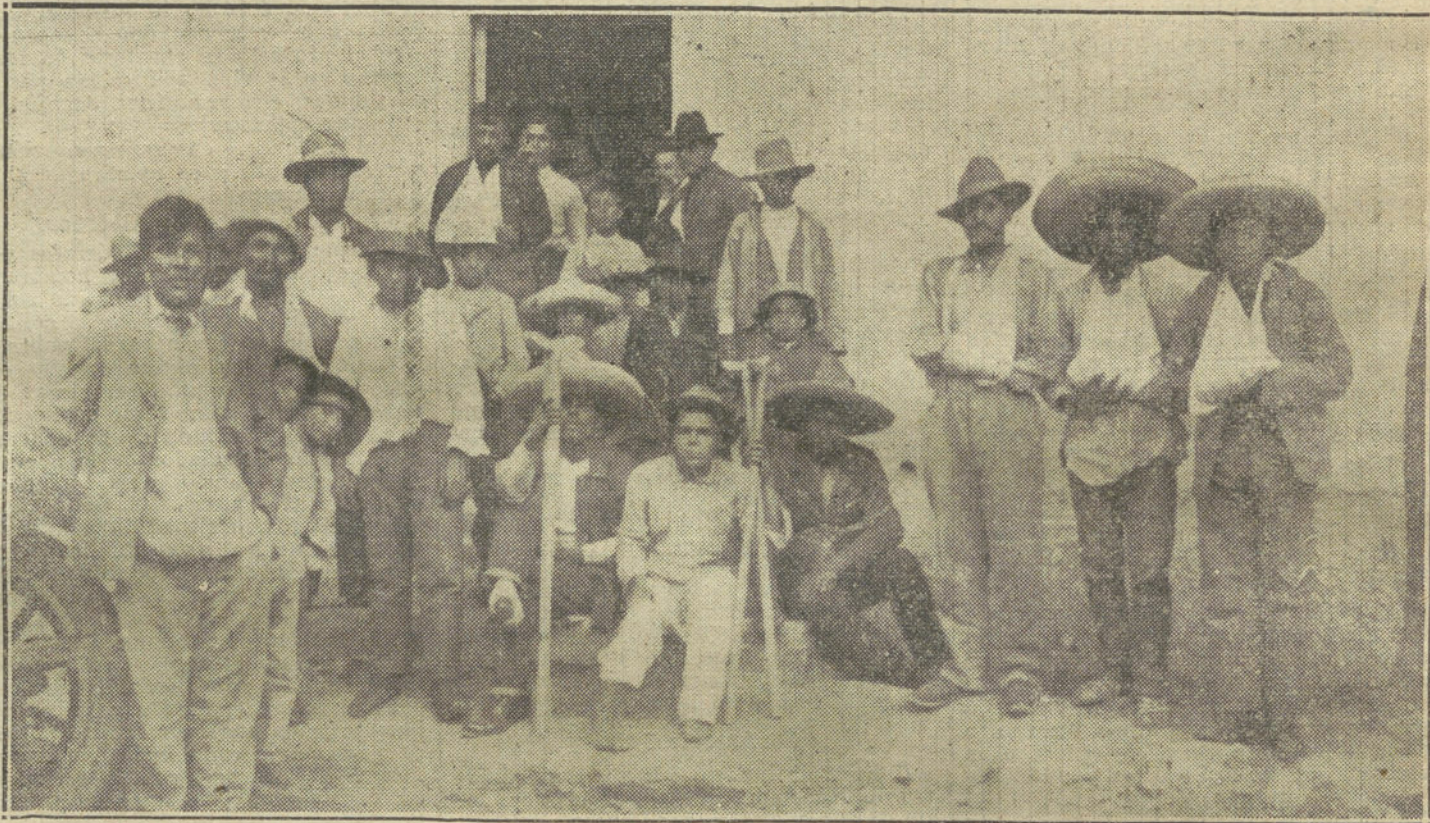
Heridos constitucionalistas á la puerta de un hospital.

Entre algunos miembros de la Corte se observa marcado disgusto por los incidentes á que ha dado lugar la muerte del Archiduque y su esposa, y se dice que algunos dignatarios palatinos piensan dimitir sus cargos como protesta contra el carácter mezquino que se ha dado al ceremonial de los funerales, del cual hacen