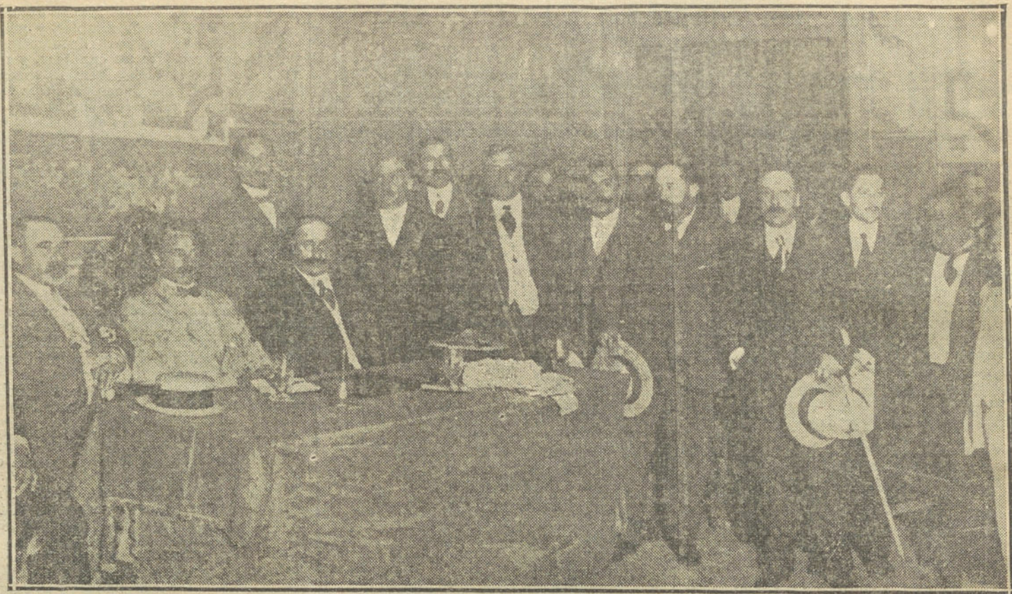
Mesa presidencial y oradores del mitin contra el impuesto sobre la sal, verificado esta mañana en el teatro Español.