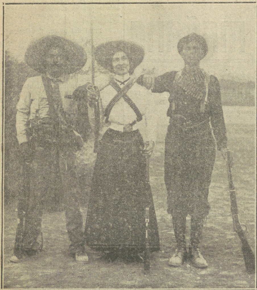
«La Mascota», popular guerrillera constitucionalista, que ha tomado parte en todas las acciones contra los federales.

Cuéntase que Protógenes dibujaba y coloreaba calmamente su más célebre cuadro, el Yalyso, en medio del campamento en que Demetrio estaba asediando la patria del pintor.