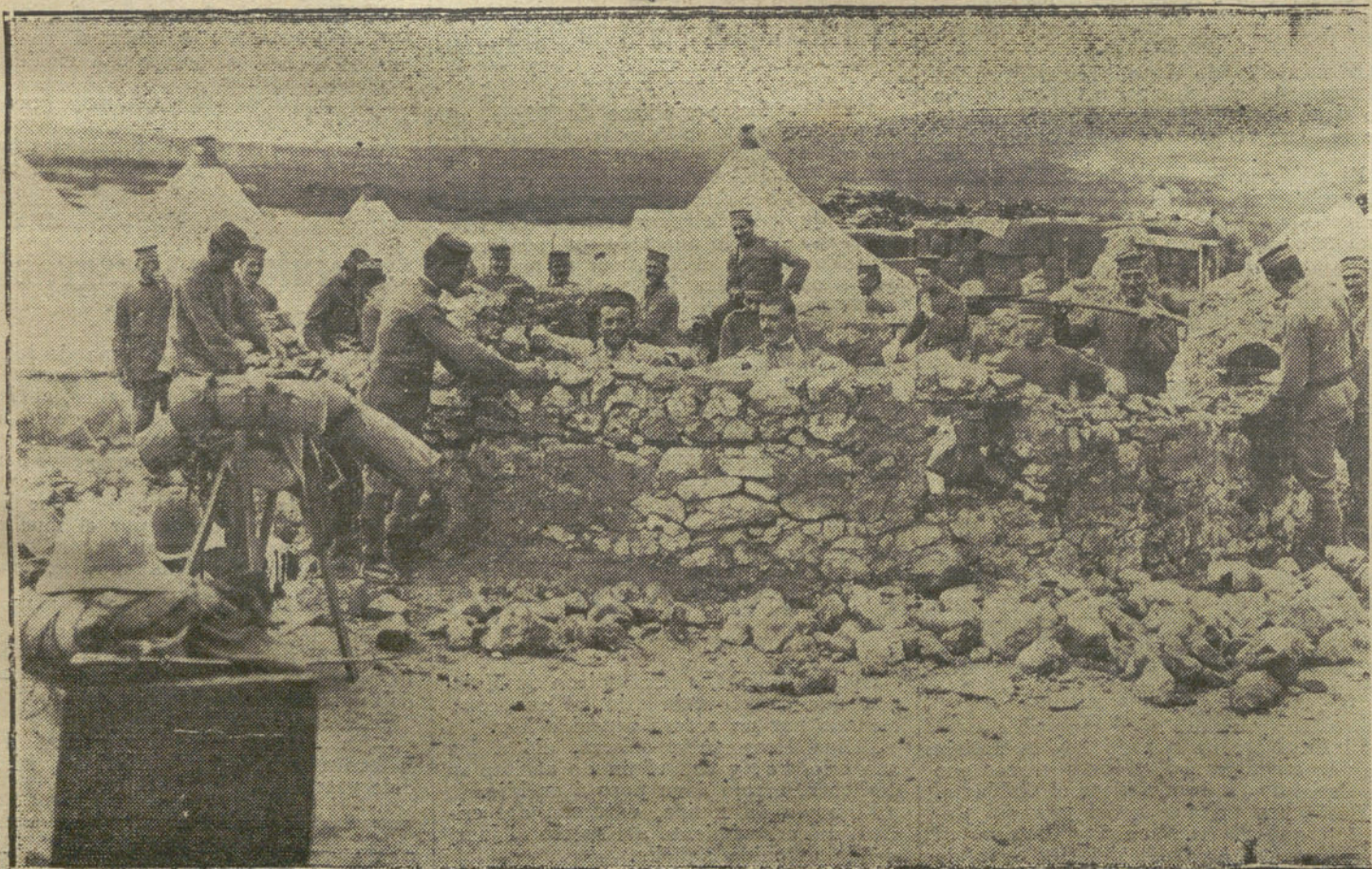
MELILLA.—En las posiciones últimamente conquistadas. Soldados de Infantería levantando un muro en círculo, para instalar una tienda de campaña.

NUMERO DEL TELEFONO DE LA REDACCION, ADMINISTRACION Y TALLERES DE «LA TRIBUNA».