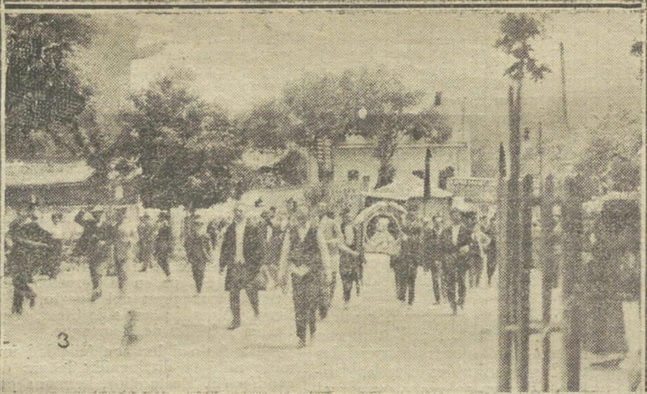
DESPUES DEL ATENTADO A LOS ARCHIDUQUES.—1. Banda de croatas asaltando en Seralveo los domicilios de los servios.—2. Destrucción del mobiliario de un servio.—3. Manifestación de croatas paseando un retrato de Francisco José.