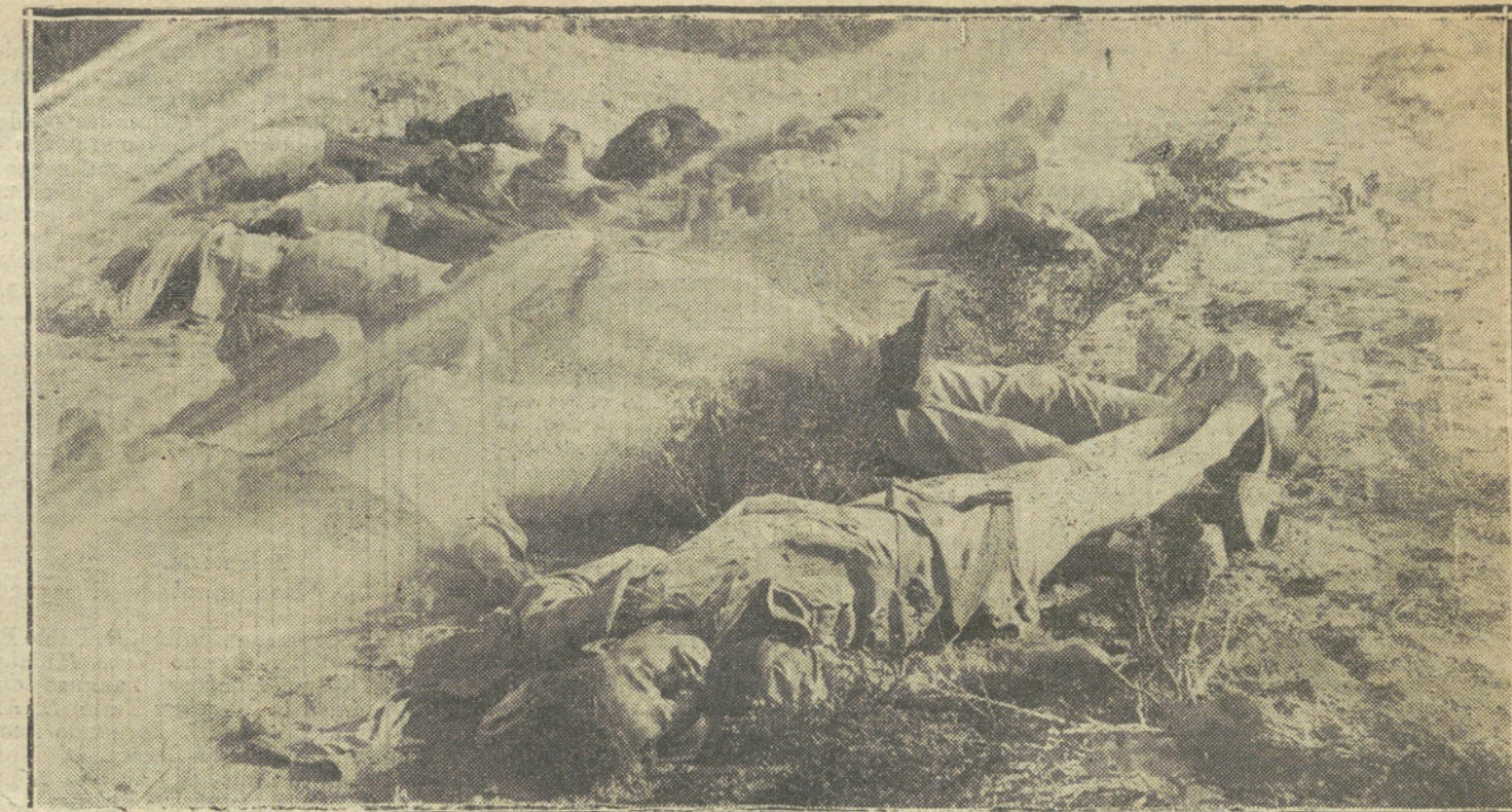
LA REVOLUCION EN MEJICO.—Cadáveres de constitucionalistas después de un combate con los federales en Saltillo.

negó las actas de costumbre a los periódicos de costumbre, impidió su ingerencia clandestina en los negocios de Estado que les hacía árbitros irresponsables de los destinos de país: conjura de los reptiles, de los desposeídos y de los despechados por ese atrevimiento sin nombre, merecedor del fuego eterno.