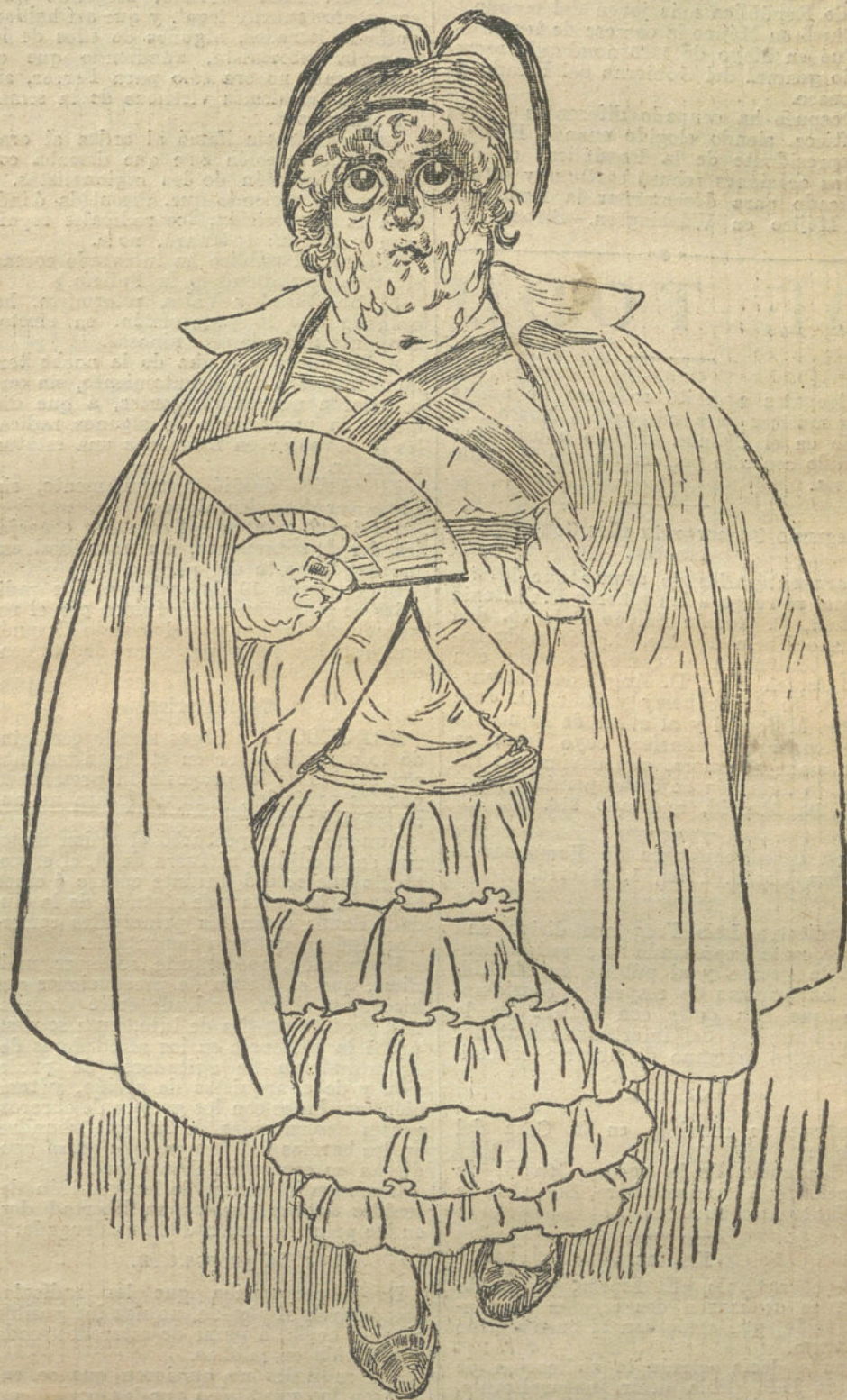
VENTAJAS DE LA MODA.—Con esta capita no tendrá usted frío, ¿eh? (Caricatura de AGUSTIN)

Tan absurdo como creer que fabricar en España grandes piezas forjadas y planchas de blindaje va a impedir el hecho de que los extranjeros se lleven