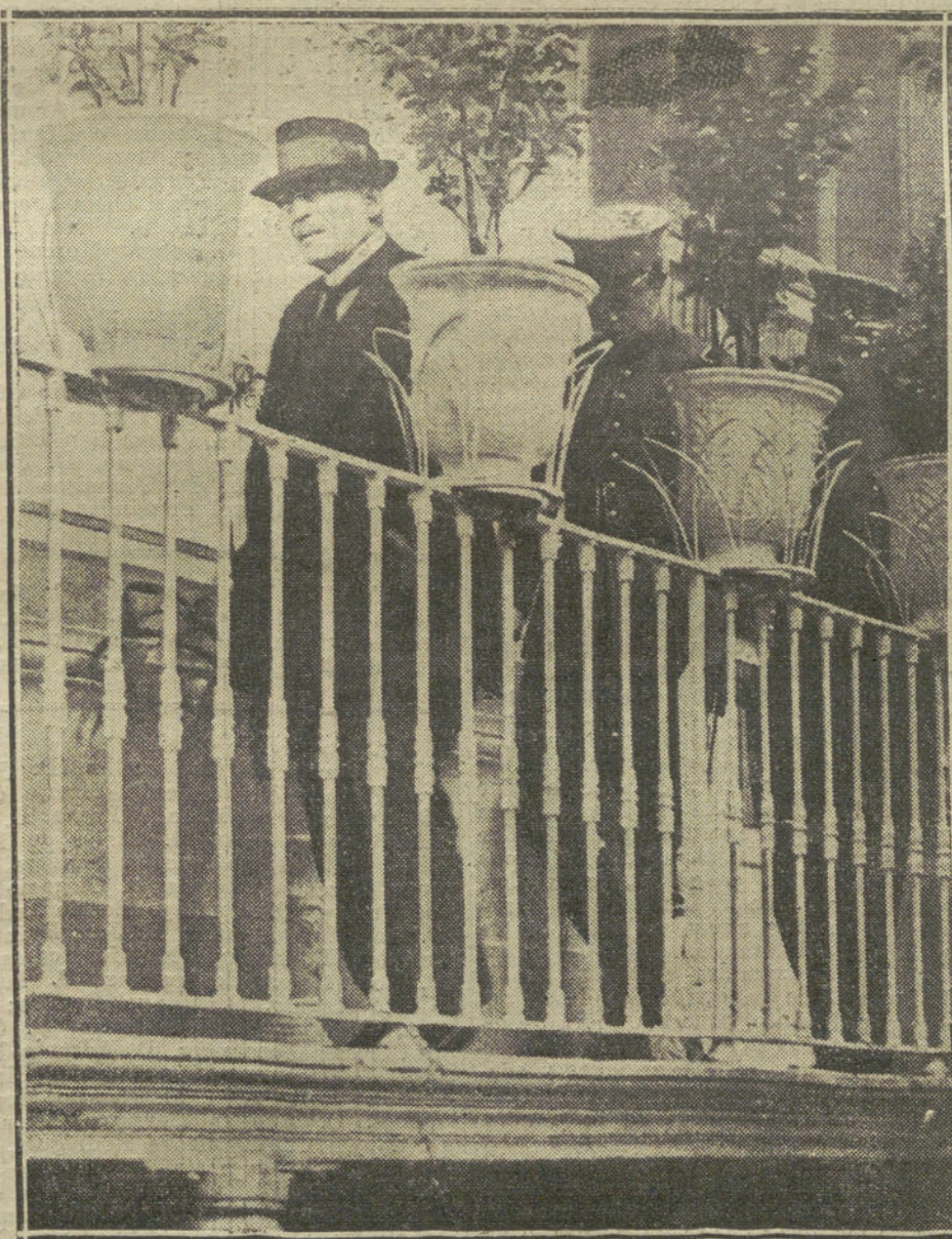
LA QUESTION MEJICANA.—El ex Presidente Huerta al salir del domicilio del Sr. Carvajal, después de una larga conferencia que sostuvo con éste, y en la que quedó convenida la renuncia del general Huerta a la Presidencia de la República.

Parece que se trata de un caso de infección intestinal de carácter tífico. —Nessi.