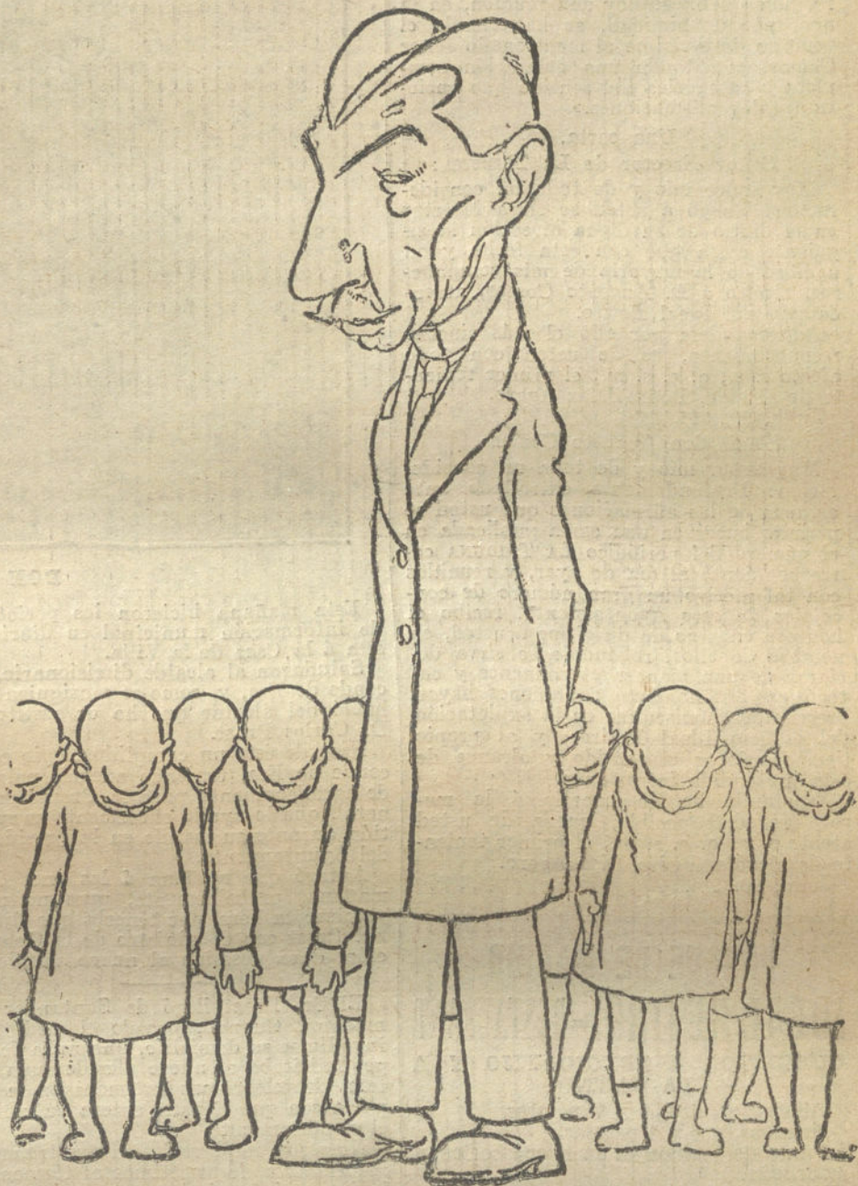
EL DECRETO BACHILLERIL

Para todo lo referente á publicidad francesa en LA TRIBUNA, dirigirse á nuestra agencia en París, rue VIVIENNE, 22.