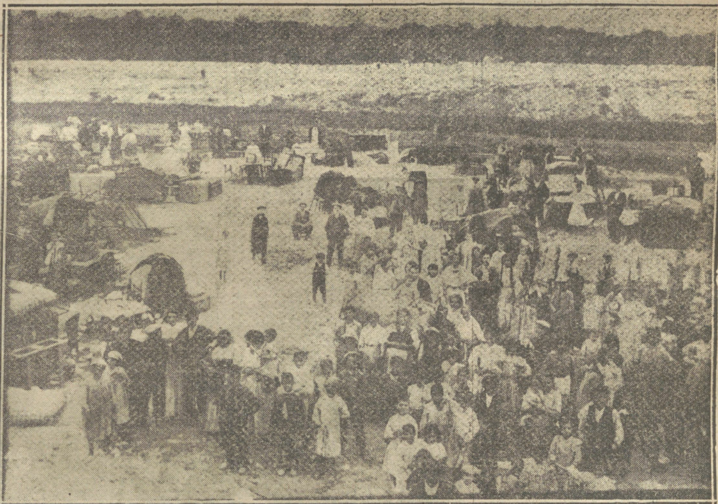
EL INCENDIO DE AYER.—Aspecto que ofrecían los alrededores de la calle del Laurel, en el barrio de las Cambronerías, poco después de iniciado el siniestro.

El tabor francés que presta sus servicios en el exterior de Tánger ha tenido fuego con los indígenas en la zona internacional, resultando un ascari muerto.