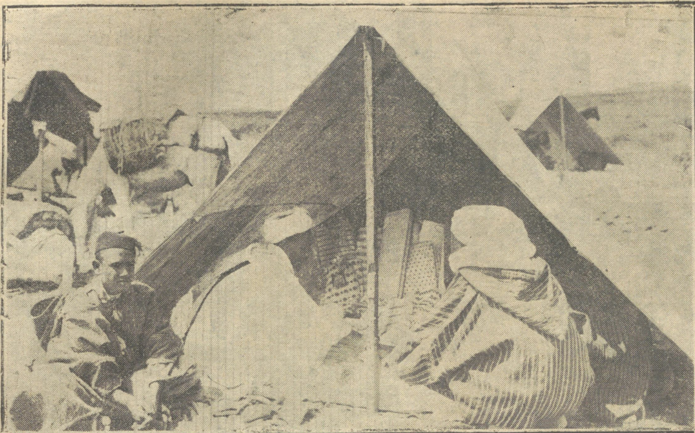
EL COMERCIO EN MARRUECOS.—En el zoco de Beni-bu-Yah. Un moro de Ulad-abd-Dain comprando telas en una tienda moruna del zoco.

Todos hubieron de expresarle su agradecimiento por la brillante campaña llevada a cabo en el Parlamento en pro de los intereses del Arsenal.