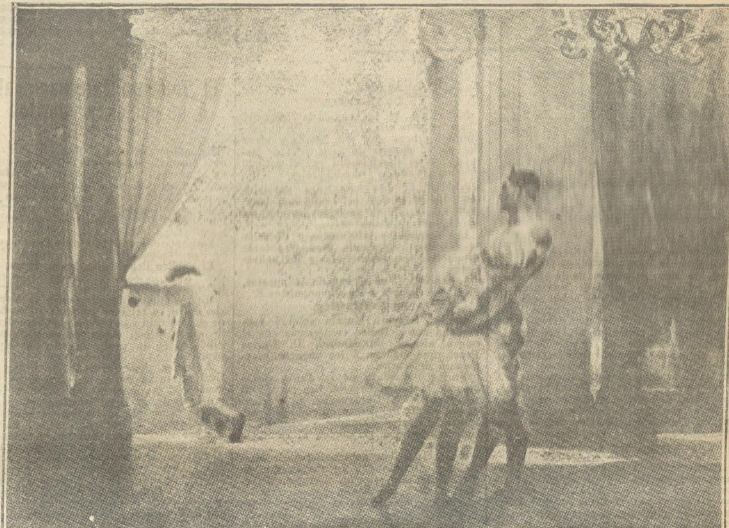
EL TRIUNFO DE ARLEQUIN, cuadro del pintor inglés Federico G. Swaish, que ha llamado poderosamente la atención en el último Salón de París.

La tercera solución es la conveniente, pues consiste en la aplicación del protectorado con sus verdaderos fines, dejando a los moros sus costumbres, su vida;