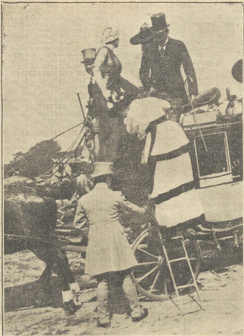
CARRERAS DE CABALLOS. —La llegada á Auteuil. Elegantes parisienses descendiendo del coche en el Hipódromo. Afortunadamente, el automóvil no ha derrotado completamente al caballo, y los aristócratas de buen gusto tienen al lado de los potentes 100 HP. hermosos engaños, que lucen los días de carreras.

PARA TODO LO REFERENTE A PUBLICIDAD FRANCESA EN «LA TRIBUNA», DIRIGIRSE A NUESTRA AGENCIA EN PARÍS: 22, RUE VIENNE, 22.