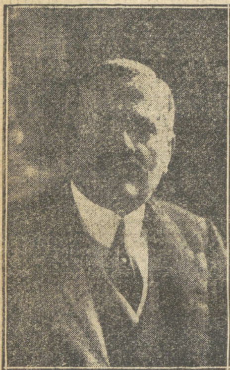
LA VISTA DE UN PROCESO EN PARIS. —El Sr. D. Gastón Calmette, director de «Le Figaro», asesinado por la señora Caillaux el día 16 de Marzo último.

Enfrente tomaron asiento el acusador y escribano, y detrás los jurados.