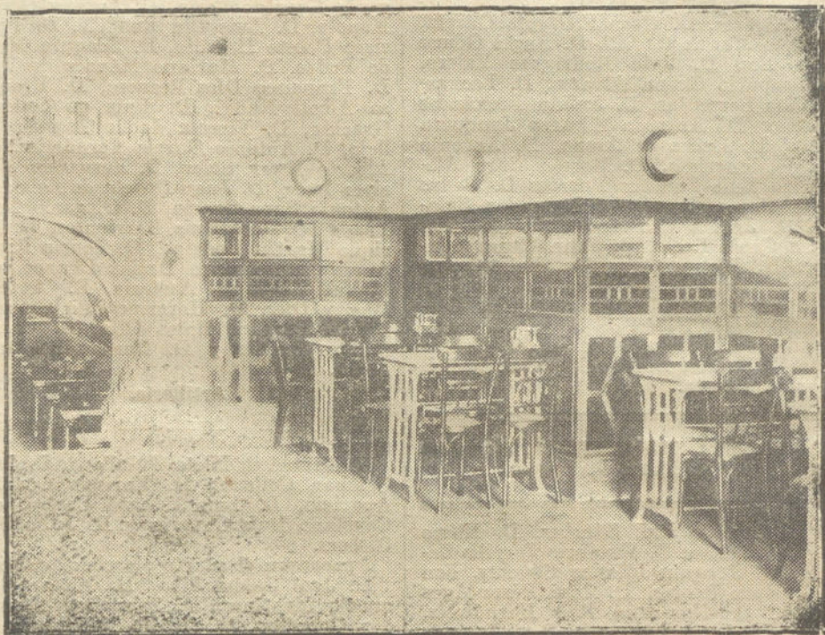
NUEVA ELIPA.—Un ángulo del salón estilo inglés

Hasta ahora no existía en Madrid un sitio donde se pudiera disfrutar de una baja temperatura durante los ardientes días caniculares.