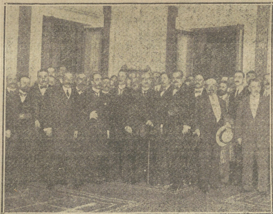
LA ALCALDIA DE MADRID.—El ministro de la Gobernación y el alcalde saliente, señor vizconde de Eza, dando posesión de la Alcaldía al Sr. Prast.—El nuevo alcalde, Sr. Prast, y el alto personal de la Alcaldía acompañando hasta la puerta del edificio al ministro de la Gobernación y al vizconde de Eza.