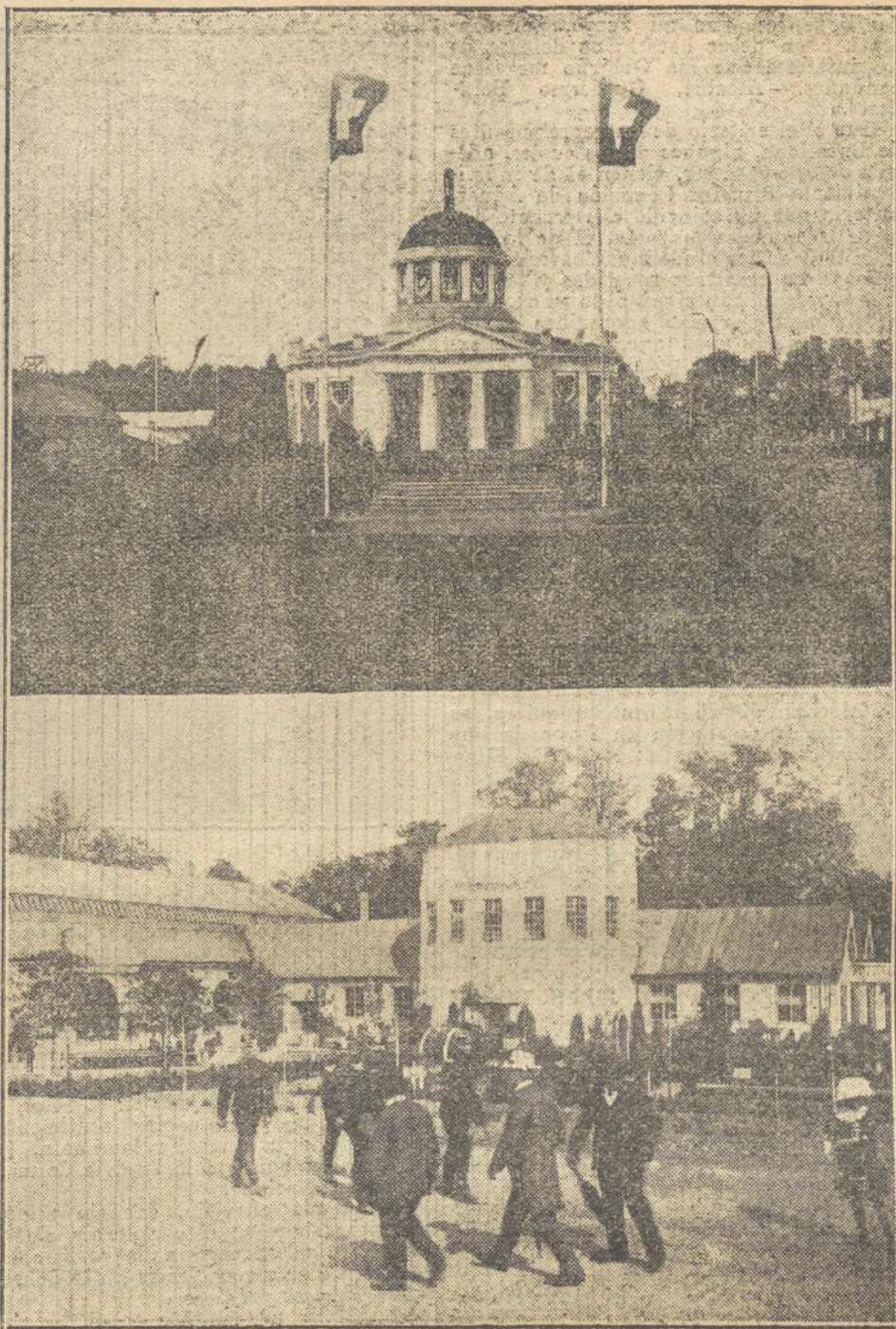
LA EXPOSICION NACIONAL DE BERNA.—Oficina internacional de la Exposición.—Pabellón de las industrias lácteas.

Seguimos andando. Subimos a un tranvía; pero él se resiste a tomar asiento. Los divanes se le antojan sucios hasta el peligro. Quedamos en la plataforma. En ella va sosteniendo un inverosímil equilibrio, por miedo a apoyarse sobre las portezuelas, cubiertas de un negro pegajoso barniz. De pronto se para el tranvía, y suben a su lado una robusta cocinera, que le embiste con su cesta repleta de comestibles, y un operario de pintor, envuelto en una larga blusa, llena de chafarrinones y salpicaduras policromas. Nuestro amigo suda, se debate, hace espantosos esfuerzos para aislarse de los dos temibles bloqueos. Al último descendemos. En aquel momento, los mangos de la villa riegan concienzudamente la calle. El instante es espeluznante. Logramos guarecernos en una esquina. Acaban. Salimos. Nuestro amigo ha recuperado la tranquilidad; estamos ya en el portal del sastre. Pasa una mujer. Nos detenemos. El se siente, al fin, poseído de