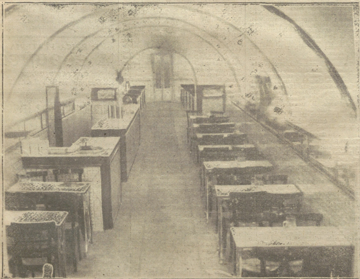
NUEVA ELIPA.—Ayuntamiento de Madrid

A continuación se retiraron tranquilamente los del grupo.