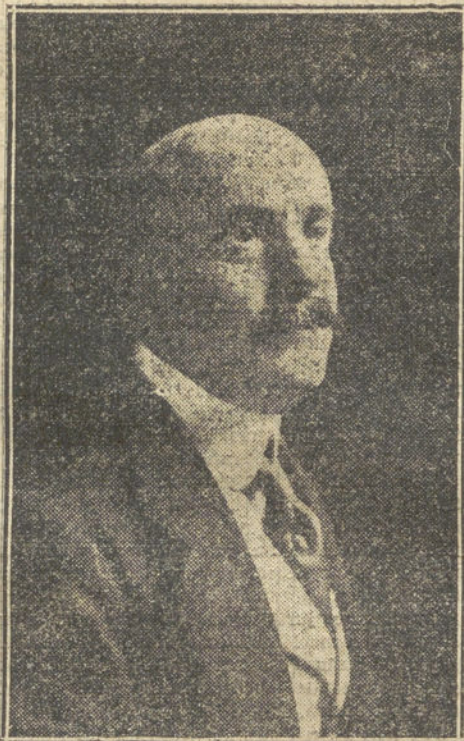
LA VISTA DE UN PROCESO EN PARIS. —El Sr. D. José Caillaux, ministro de Hacienda cuando su esposa realizó el asesinato del director de «Le Figaro».