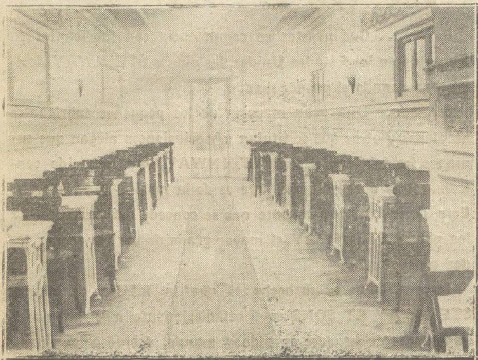
NUEVA ELIPA.—Salón estilo Luis XVI