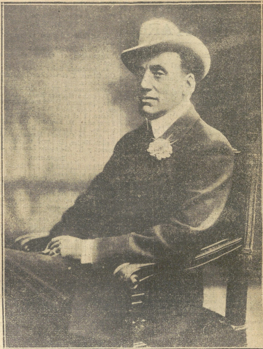
LOS SUCESOS DE IRLANDA POR EL «HOME RULE».—Sir Edward Henry Carson, jefe de los rebeldes ulsterianos, que se han organizado militarmente y se hallan preparados para la lucha contra las tropas del Gobierno.