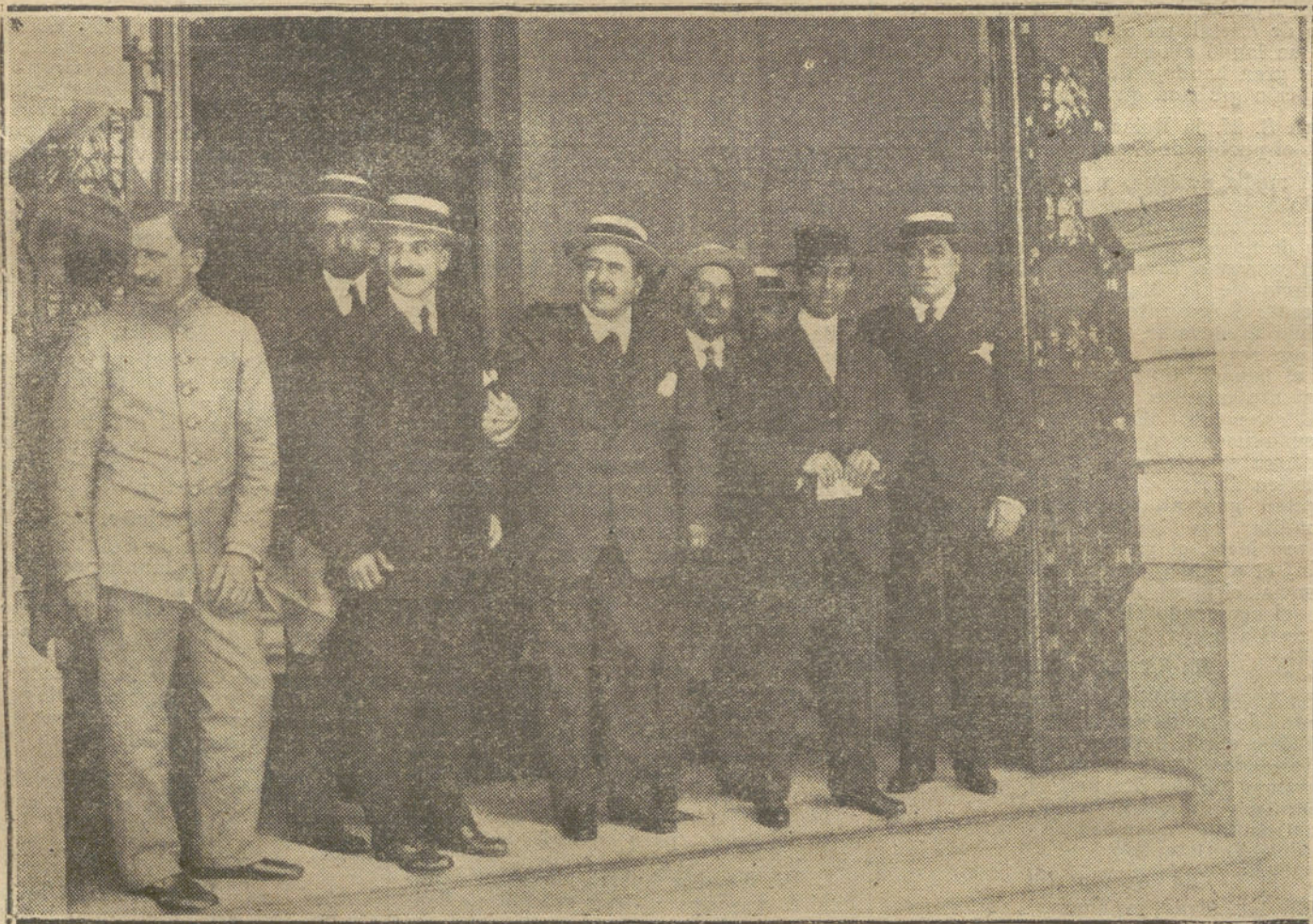
El Gallo rodeado de sus amigos a la puerta del hotel, poco después de su llegada a Madrid.

Un matrimonio vergonzante, antes en buena posición, con cuatro hijos pequeños, que están anémicos, uno de ellos raquítico, por falta de alimento; el marido enfermo hace más de un año y la esposa próxima a dar a luz, sin ninguna clase de ropas para envolver a la criatura que nazca, pasan muchos días sin comer, están desmayados por la debilidad, medio desnudos, durmiendo en el suelo, con un jergón de paja, sin sábanas, por carecer de todo género de recursos; suplican a las personas caritativas les socorran en la precaria situación. Habitan en la travesía del Conservatorio, núm. 11, principal derecha.