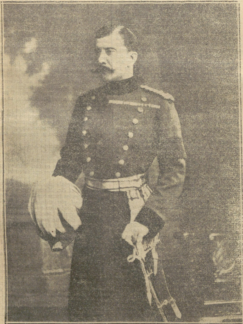
EL «HOME RULE».—El general sir Arthur Paget, jefe de las tropas que han marchado al Ulster, para sofocar el conato de guerra civil.