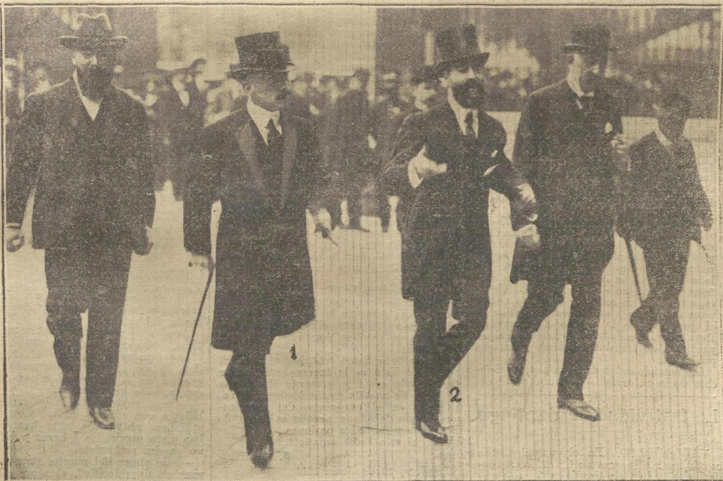
EL PROCESO DE MME. CAILLAUX.—El ex ministro M. Caillaux (1) y el diputado M. Ceccaldi (2) entrando en el palacio de Justicia.

Dejaron los salteadores sobre el campo diez y ocho muertos y muchos heridos.—Hallet.