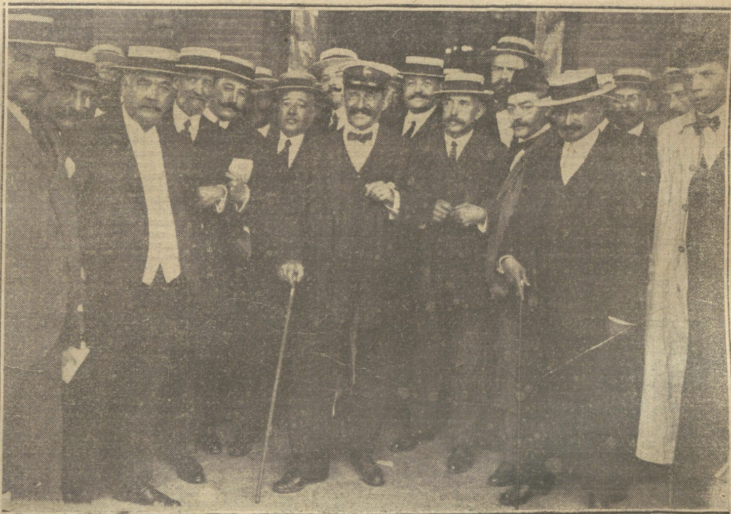
El conde de Romanones en la estación del Mediodía, á su llegada á Madrid esta mañana, de regreso de su viaje por Africa.

NUMERO DEL TELEFONO DE LA REDACCION, ADMINISTRACION Y TALLERES DE «LA TRIBUNA»: 4.444