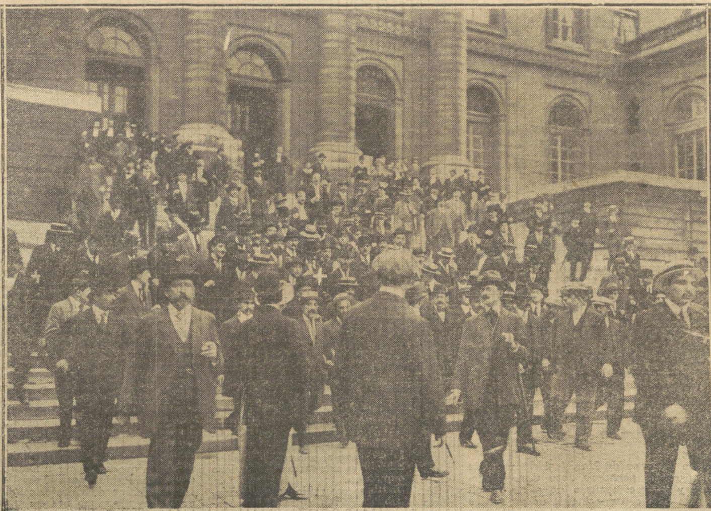
LAS MANIFESTACIONES CONTRA CAILLAUX.—Caillaux (X) á la salida del Palacio de Justicia, rodeado de los grupos de protestantes.