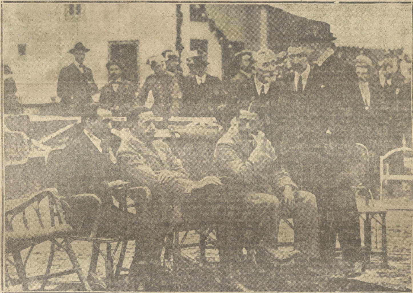
EN EL TIRO DE PICHON DE SANTANDER.—S. M. el Rey y el Infante Don Carlos durante uno de los descansos.