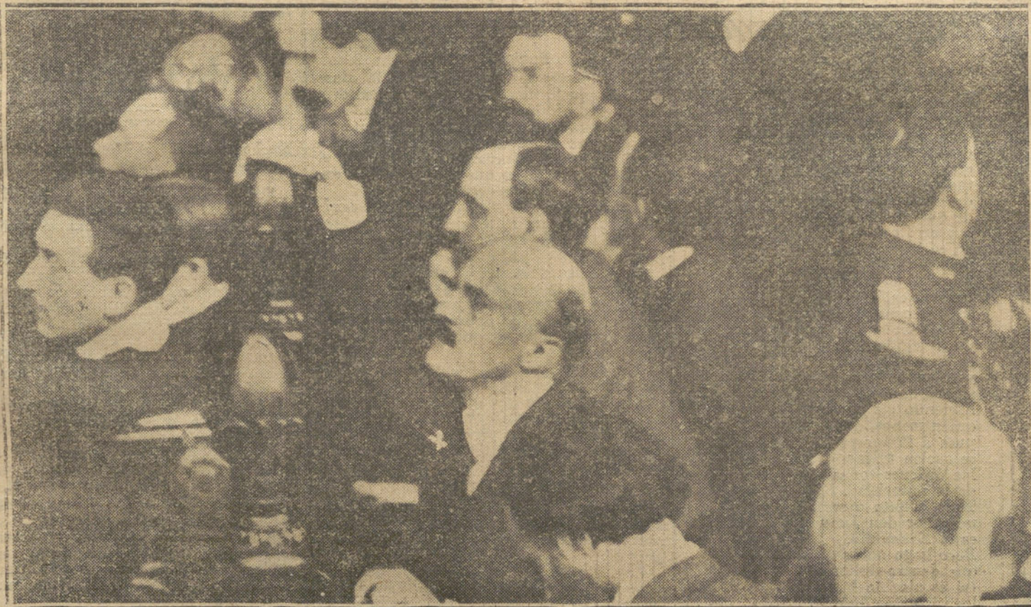
EL PROCESO DE MME. CAILLAUX.—El ex ministro M. Caillaux (X) oyendo la declaración de su primera esposa.

CASTELLON. El Ayuntamiento de Bechi realiza en el cauce del río, en término de Onda, obras de aprovechamiento de aguas. Sintiendo perjudicado el Ayuntamiento de Onda, el alcalde ha oficiado al gobernador pidiéndole que ordene la paralización, para evitar alteraciones de orden público, hallándose dispuestos, en caso de no ser atendidos, á presentar colectivamente la dimisión al alcalde y los concejales. El gobernador ha ordenado la suspensión de trabajos.