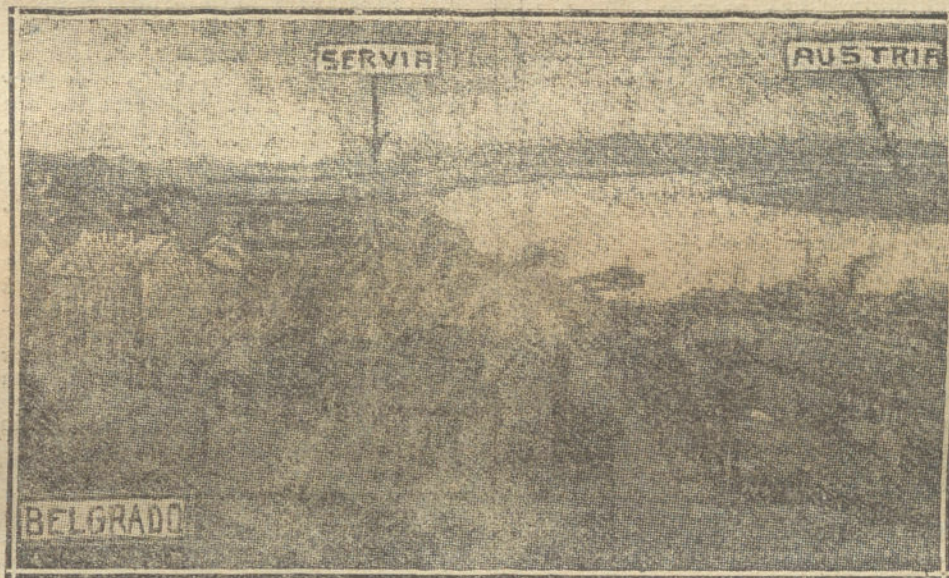
CROQUIS DE BELGRADO. —La capital de Serbia se encuentra exactamente en la frontera servio-austriaca. El río que separa Belgrado y Zelim sirve de frontera entre los dos países.

«No puede admitirse por nadie que una potencia, cualquiera que sea, preste su protección a los agentes revolucionarios y asesinos, en perpetuo movimiento de violencia contra un Estado vecino, y, por tanto, Serbia no tendrá dificultad para