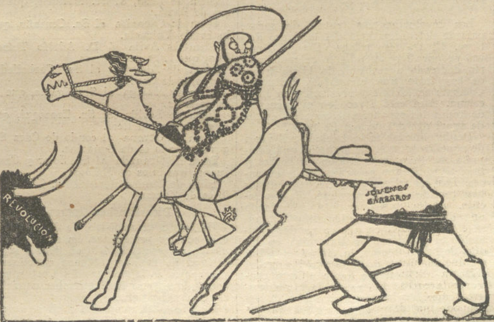
EL «EMPERADOR» TIENE JINDAMA

A pesar de todos los preparativos, quizá el conflicto no alcance las proporciones anunciadas.»