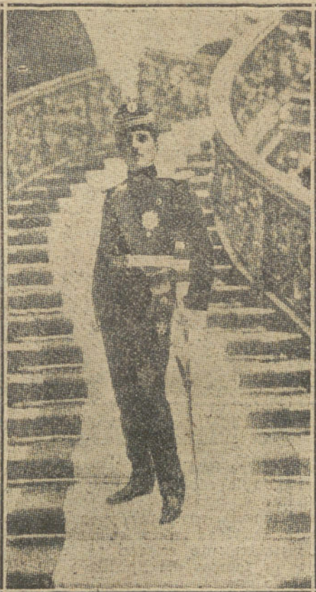
EL PRINCIPE ALEJANDRO DE SERBIA , en quien su padre, Pedro Karageorgewich, abdicó la corona poco antes de surgir el actual conflicto.

Si el conde Berchtold hubiese limitado a este punto su demanda, hubiera habido unanimidad en toda Europa para aprobarlo y prestarle su apoyo.