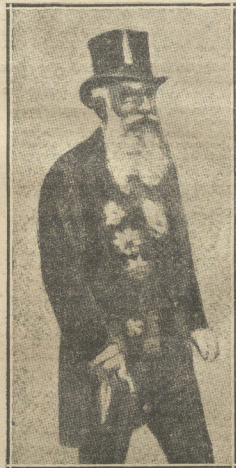
M. PACHITCH, presidente del Consejo de ministros de Servia.

En todas las poblaciones del Imperio reina enorme expectación.