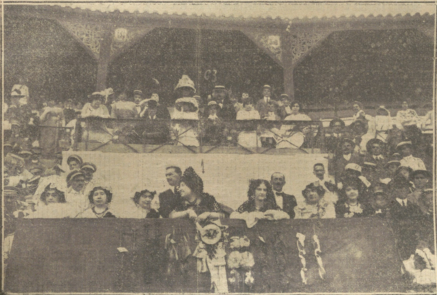
Grupo de bellas señoritas que presidieron la corrida á beneficio de la Cruz Roja, celebrada el día de Santiago en La Línea de la Concepción.

LA TAREA DE DEVOLVER TODOS LOS TRABAJOS QUE NO PUBLICAMOS SERIA ABRUMADORA, Y PARA EVITARLA, COMO PARA PREVENIR RECLAMACIONES, QUE RESULTARIA IMPOSIBLE ATENDER, RECORDAMOS QUE NO SE DEVUELVEN LOS ORIGINALES.