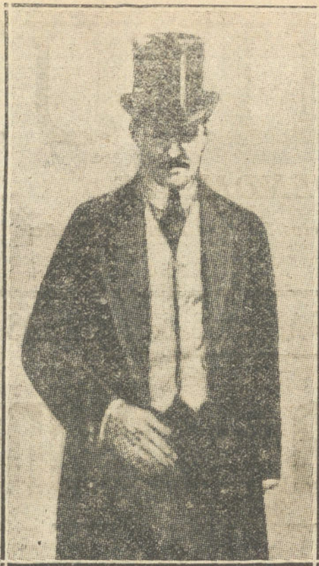
El conde BERCHTOLD, ministro de Negocios Extranjeros de Austria.

BERLIN. En Munich se realizó ayer una manifestación popular frente a la Legación de Austria, dándose entusiásticos