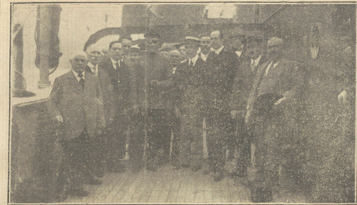
EL «PATRIA» EN SANTANDER.—El alcalde y los concejales a bordo del crucero cubano, entregando al comandante del buque una placa, como recuerdo de su paso por la capital.

—En el pueblo de Portugalete cuestionaron en una taberna dos individuos il-