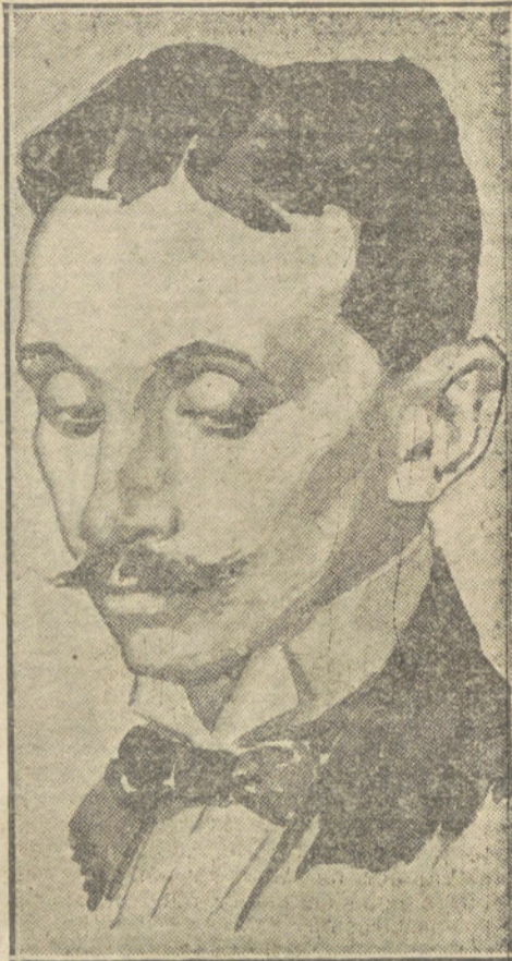
RAUL VILLAIN, asesino de M. Jaurés.

Almuerzos, á 4,50 y 7 pesetas. Comidas, á 6 y 8 pesetas. Punto de reunión de la buena sociedad madrileña.