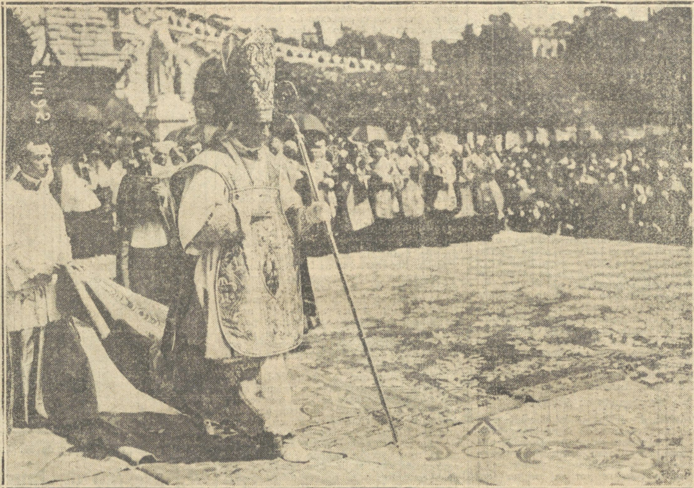
EL CONGRESO EUCHARISTICO DE LOURDES.—El cardenal Granito de Belmonte, legado de Su Santidad, presidiendo la procesión eucarística con que ha terminado el Congreso.

Pero el Sr. Dato es muy modesto, aun para sus expansiones sociológicas; muy dosimétrico, muy cauteloso para resolver. Si hubiera cultivado la Medicina, sería homeópata, en Terapéutica, y, en Cirugía, enamorado del emplastro. Por esta razón, todas sus energías de sociólogo se han resuelto en una ley deslizada entre la soledad y el aburrimiento de ambas Cámaras, en la que se conceden derechos protectores á los empleados de la Presidencia.