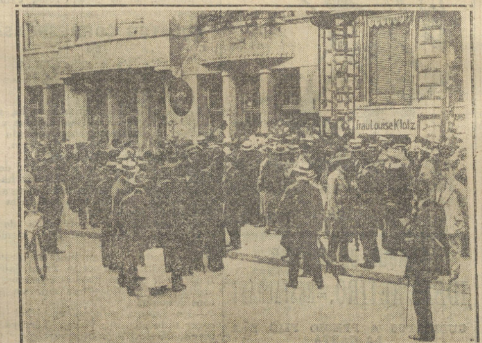
LA GUERRA VISTA EN BERLIN.—Los reservistas austriacos ante el Consulado de su país, en demanda de pasaportes.