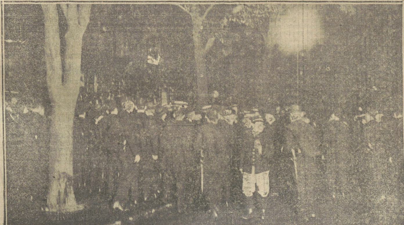
EL CONFLICTO EUROPEO.—La Policía disolviendo una manifestación socialista en las calles de París.

Para todo lo referente a publicidad francesa en LA TRIBUNA, dirigirse a nuestra agencia en París, rue VIVIENNE, 22