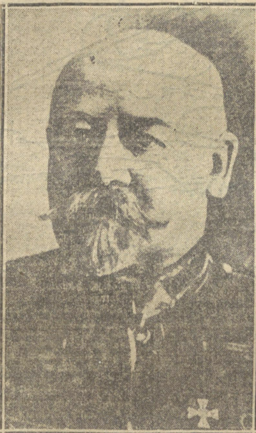
General SOUKHOMLIHOFF, ministro de la Guerra ruso.

operaciones. Austria y Servia. Expectación