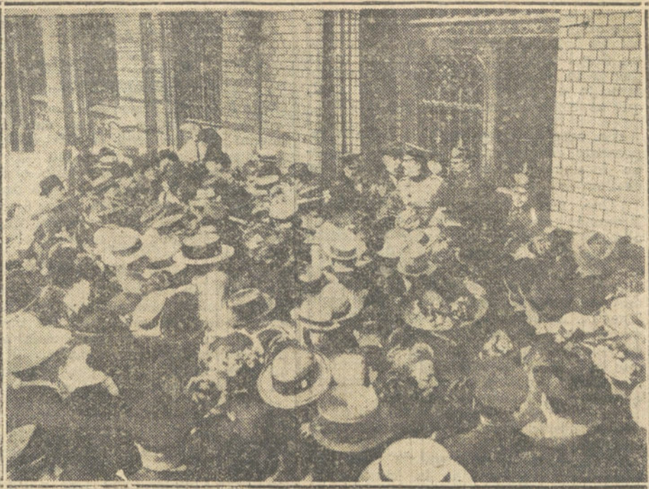
LA GUERRA VISTA EN BERLIN.—El pánico financiero hace que la multitud asalte las casas de Banca, para retirar sus depósitos y cuentas corrientes.

Hasta la fecha ha recorrido Palencia, Orense, Santiago, Coruña, Lugo, Oviedo y algunos pueblos de su provincia, donde ha arraigado la institución y actualmente se halla en Santander, para presenciar la promesa de los exploradores montañes.