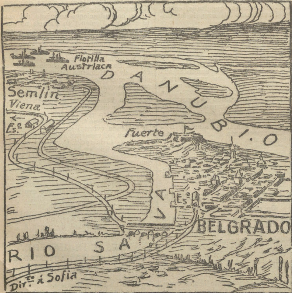
Croquis del teatro de la guerra austroserbia, en el que se ve el trayecto seguido por las tropas austriacas para penetrar en Belgrado.

BERLIN. El Consejo federal ha aprobado la publicación de tres Ordenanzas imperiales prohibiendo la exportación de forrajes, animales y productos animales, cereales, verduras, automóviles, piezas de automóviles, minerales, aceite, etc., etc.—Stern.