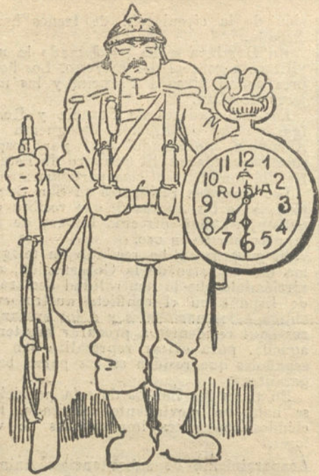
EL RELOJ DE LA GUERRA. —A las siete y media del 1 de Agosto de 1914, el embajador de Alemania en San Petersburgo pone en manos del Gobierno ruso la declaración de guerra. (Dibujo de AGUSTIN)

BILBAO. A pesar de cuanto se ha dicho en contrario, la Bolsa de Bilbao há-