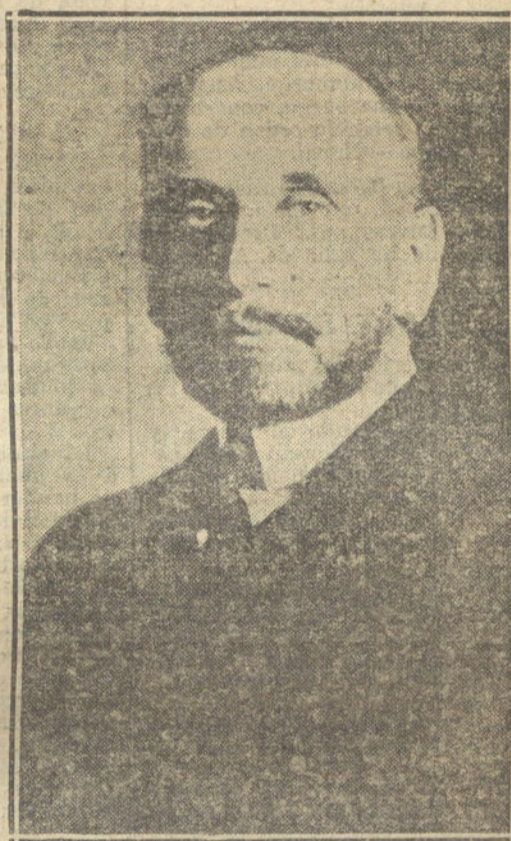
SERGIO SAZONOFF, ministro de Negocios Extranjeros de Rusia.

tos novísimos acorazados «Francia» y «París», que ya casi se hallan en situación de entrar en línea de combate.