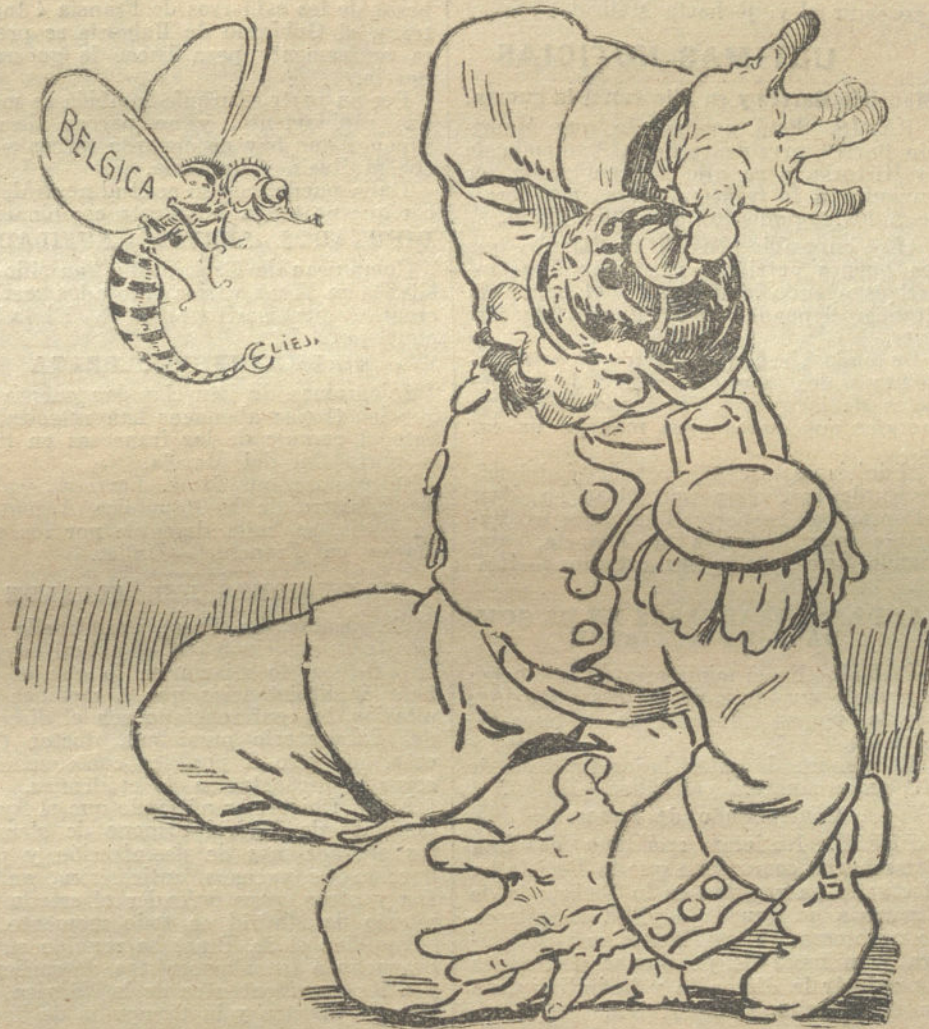
¡Con este bicho no contaba yo!

Según el gobernador, las subsistencias están por completo aseguradas, lo mis-