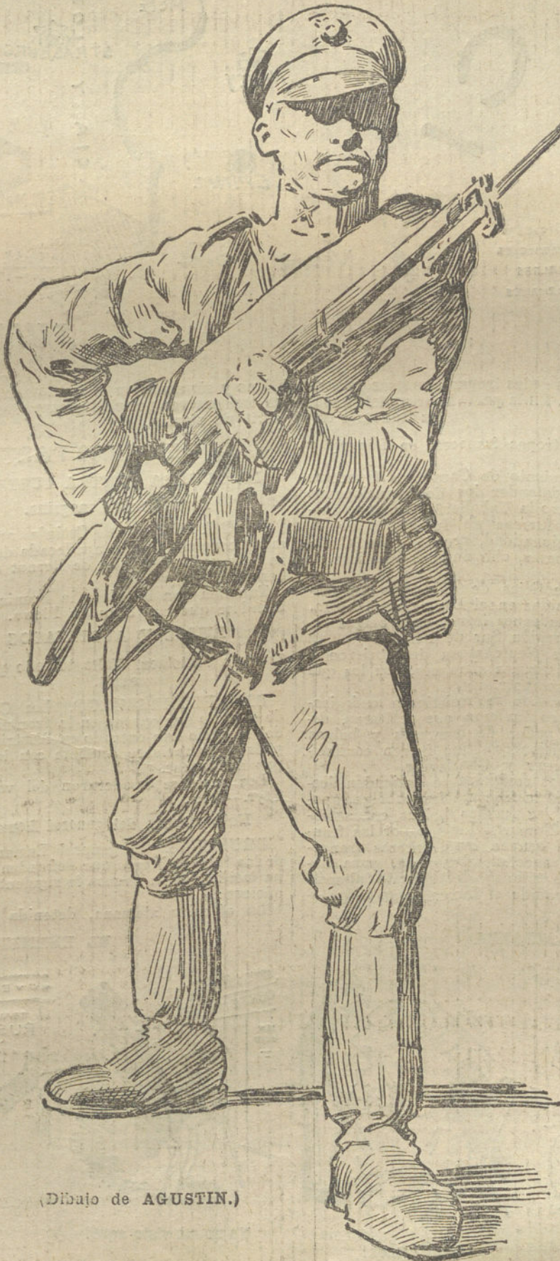
(Dibujo de AGUSTIN.)

Las bajas rusas fueron de mucha importancia. El ejército ruso dejó en poder de los alemanes muchos prisioneros, que han sido internados en Alemania.