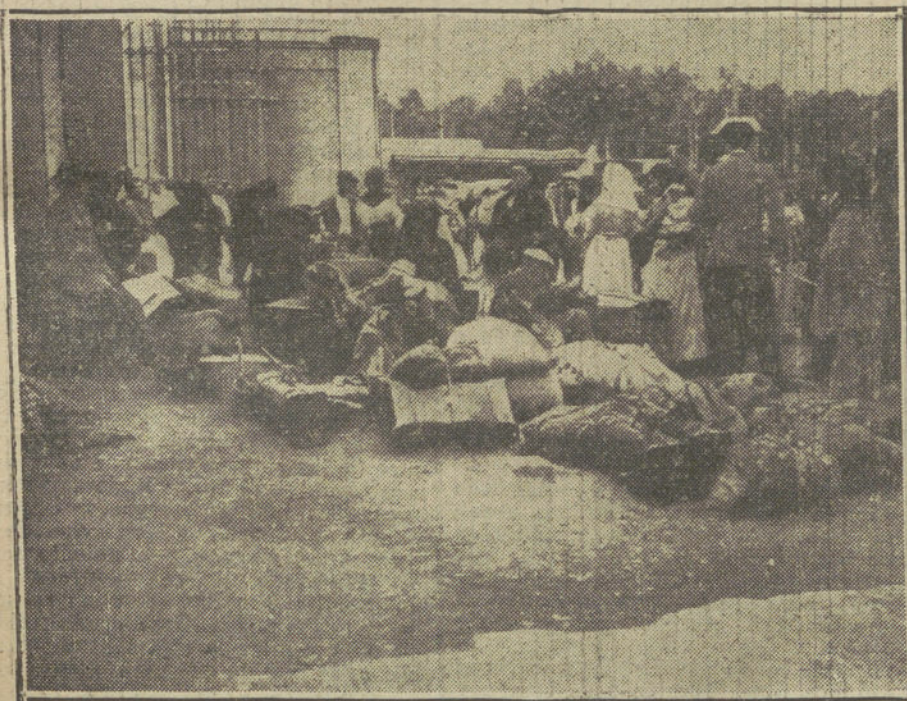
LA GUERRA VISTA EN BARCELONA.—Grupo de obreros españoles repatriados, acampados en la estación de Francia.

Recibid, señor, el testimonio de nuestra sincera consideración. Paul Deschanel.»