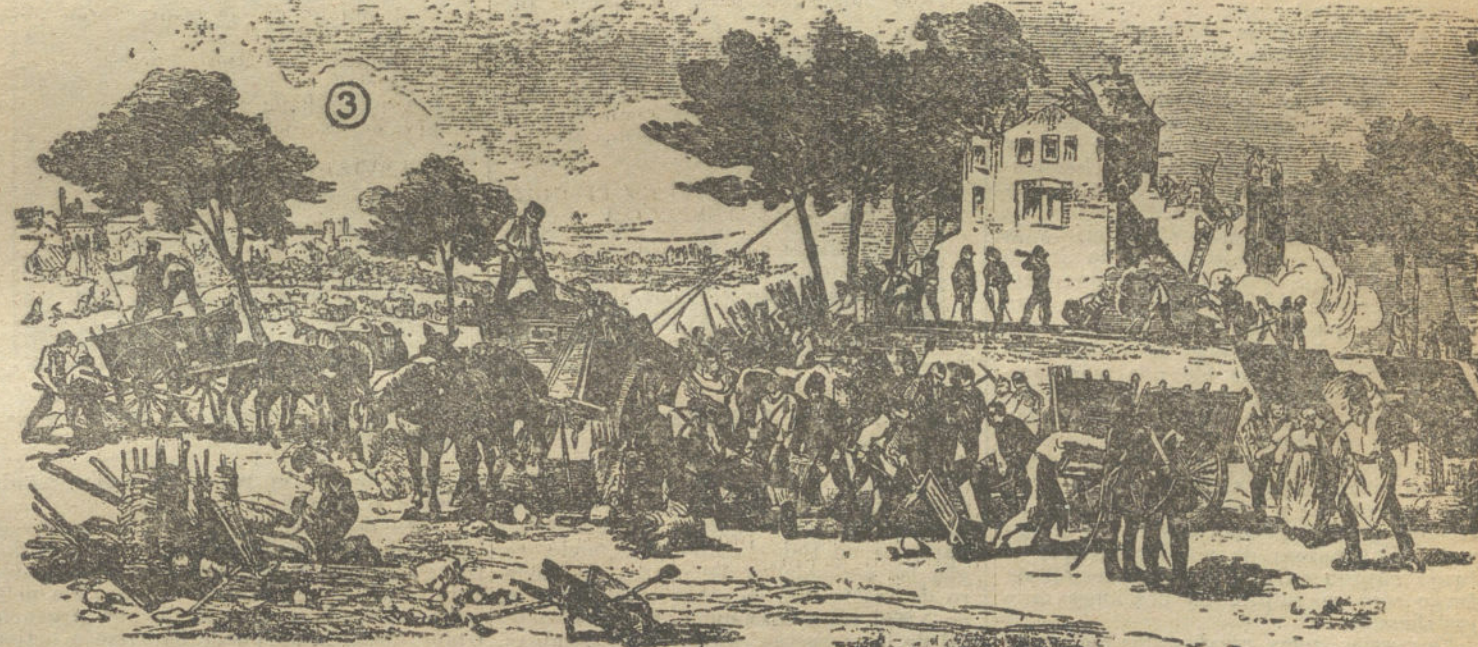
LA GUERRA FRANCOALEMANA DE 1870.—Núm. 1. Ambulancias para el socorro de heridos, establecidas en Doncourt. Núm. 2. La Artillería francesa protegiendo el paso del Mosela, en Longneville. Núm. 3. El pueblo de París destruyendo las fortificaciones de la ciudad. (DE UNOS GRABADOS DE LA EPOCA)

demonstrar que la Corona real que oprime su frente es llevada por ella con dignidad. Aunque Lieja caiga en sucesivos combates en poder del alemán invasor, su fe y su heroísmo la salva. Y es que contra la opresión y la tiranía, desde Numancia acá, los hombres han de tener siempre una sacudida patriótica, aunque en ella se jueguen la propia vida.