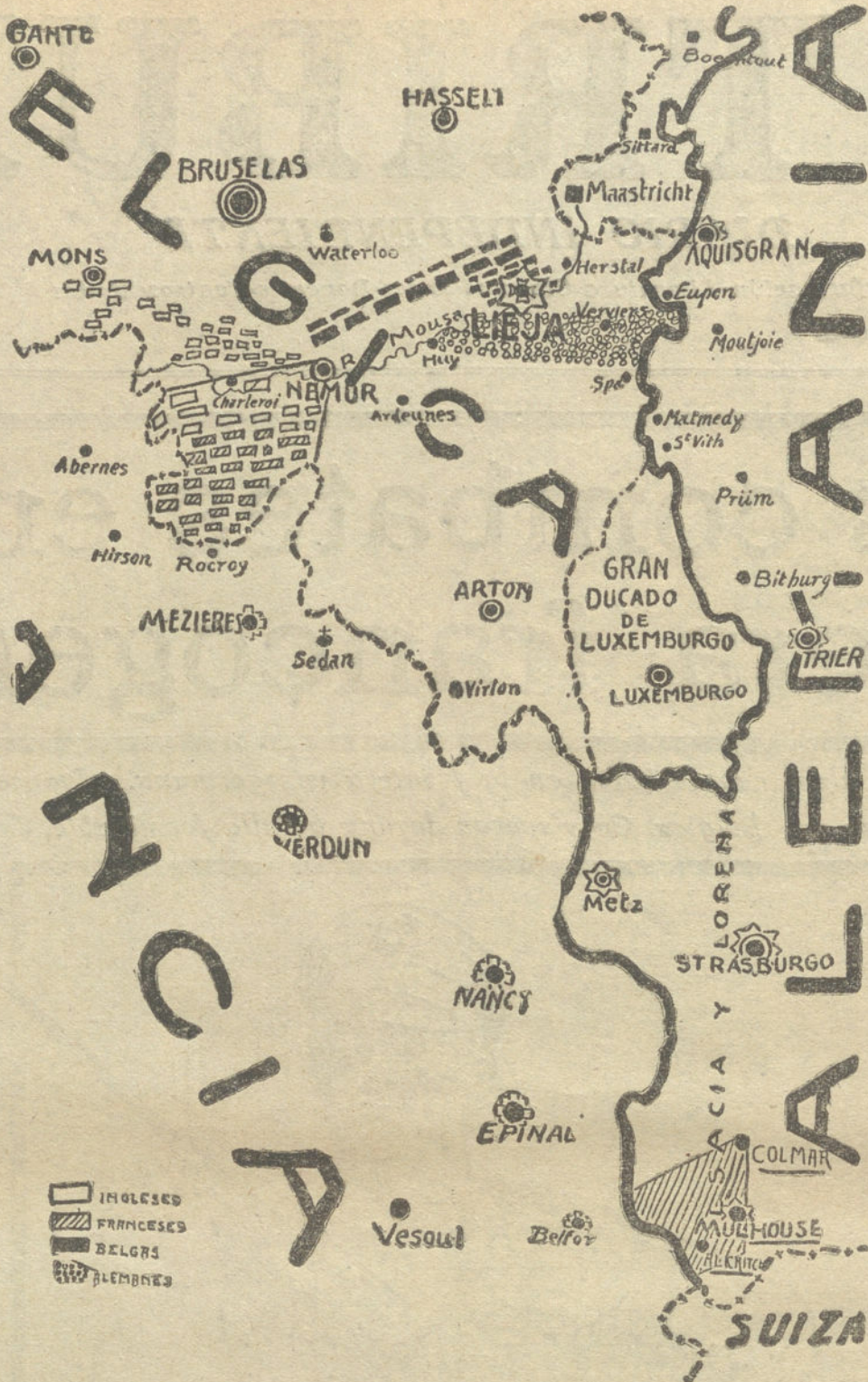
Situación de las tropas francesas, inglesas, belgas y alemanas en la frontera franco-germana. En la parte inferior del grabado las tres nuevas posiciones ocupadas por los franceses en el territorio alemán.

frida por tropas francesas en Longwy y Sponcourt.