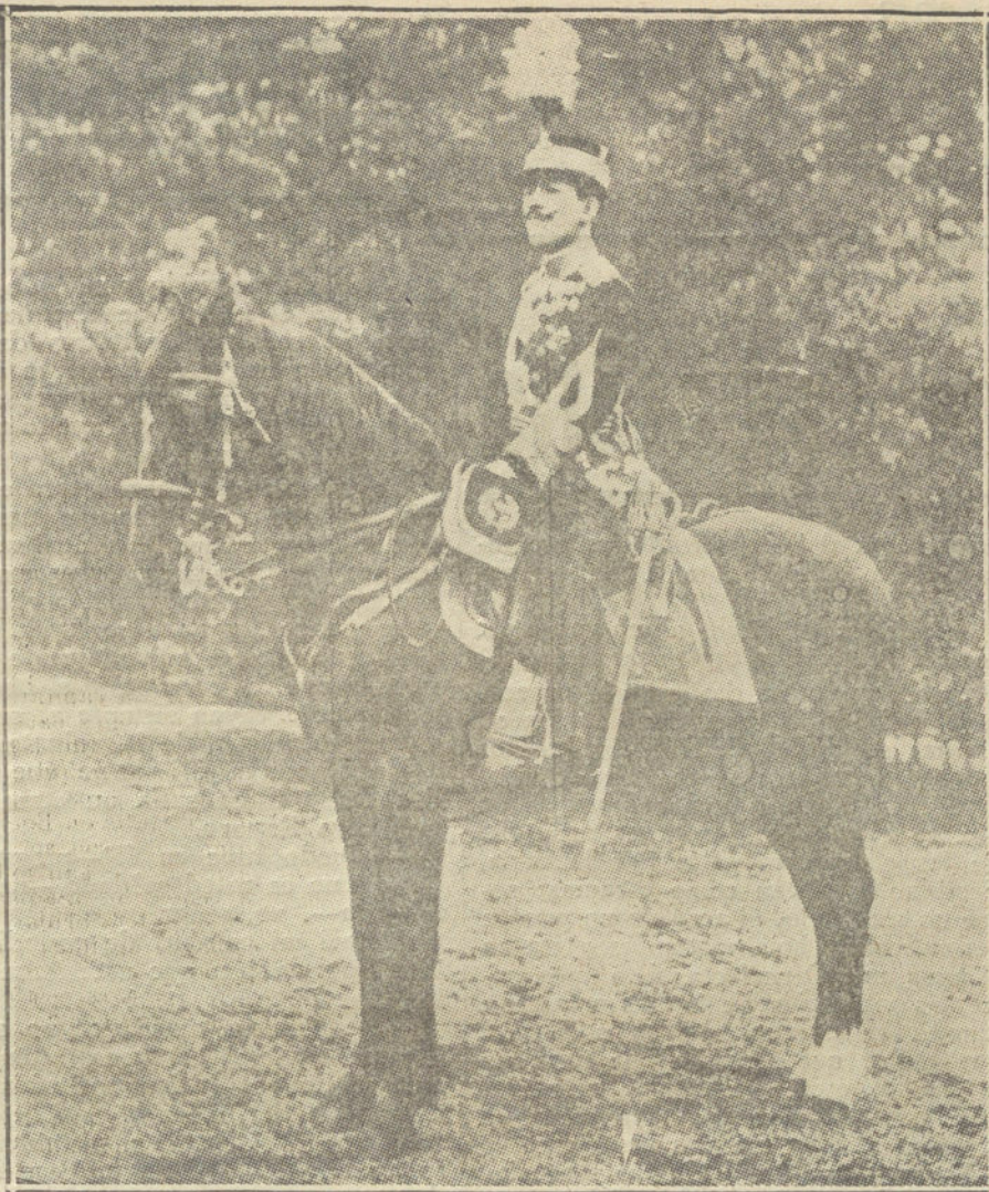
El Emperador del Japón, de quien se asegura que ha declarado la guerra a Alemania.

Yo recuerdo que en casos análogos, aunque no tan tremendos como el actual, el inolvidable D. Antonio Cánovas del Castillo supo contener pánicos financieros con sólo recurrir al patriotismo de hombres de aquella época. ¿Carecerá el Gobierno actual de amigos que se vean provistos de ese necesario patriotismo? Yo entiendo que no, y lo que los míos puedan aportar,