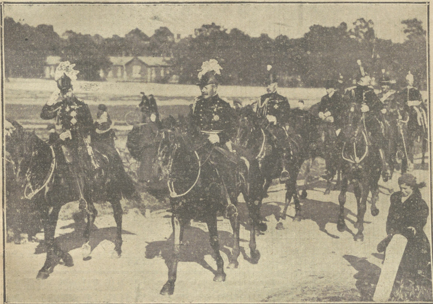
LA GUERRA DESDE LONDRES.—El Rey Jorge de Inglaterra dirigiéndose a despedir á las primeras tropas expedicionarias.

res, que flamean coquetonas al viento, y grandes brazadas de verdura; sobre el frontis de la locomotora campeon emblemáticas, orgullosas como penachos, dos ramas de laurel. A lo largo del convoy, el buen humor francés ha escrito con tiza frases picantes, frases fanfarronas, frases de ironía: «La cabeza de Guillermo II vendrá á Bayona». «Tren de placer para Berlín». «Temporada de verano en Berlín. Ida y vuelta, etc...» Ni un momento el entusiasmo general flaquea; se ríe, se canta, se ladra, se imita el clarinear del gallo—«chantecler»—símbolo de Francia; pasan y pasan kilómetros, y La Marsellesa resuena inmortal. Desborda la alegría. Parece que vamos á una boda.