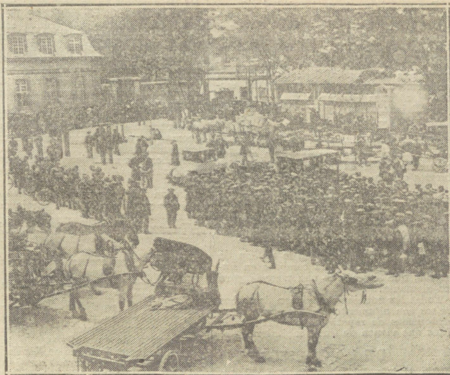
LA GUERRA DESDE PARIS.—Grupo de reservistas franceses y carros de transportes adquiridos para el Ejército, en el cuartel de la Tour-Maubourg.

su avance ante el nutrido y mortífero fuego de la Artillería servia.