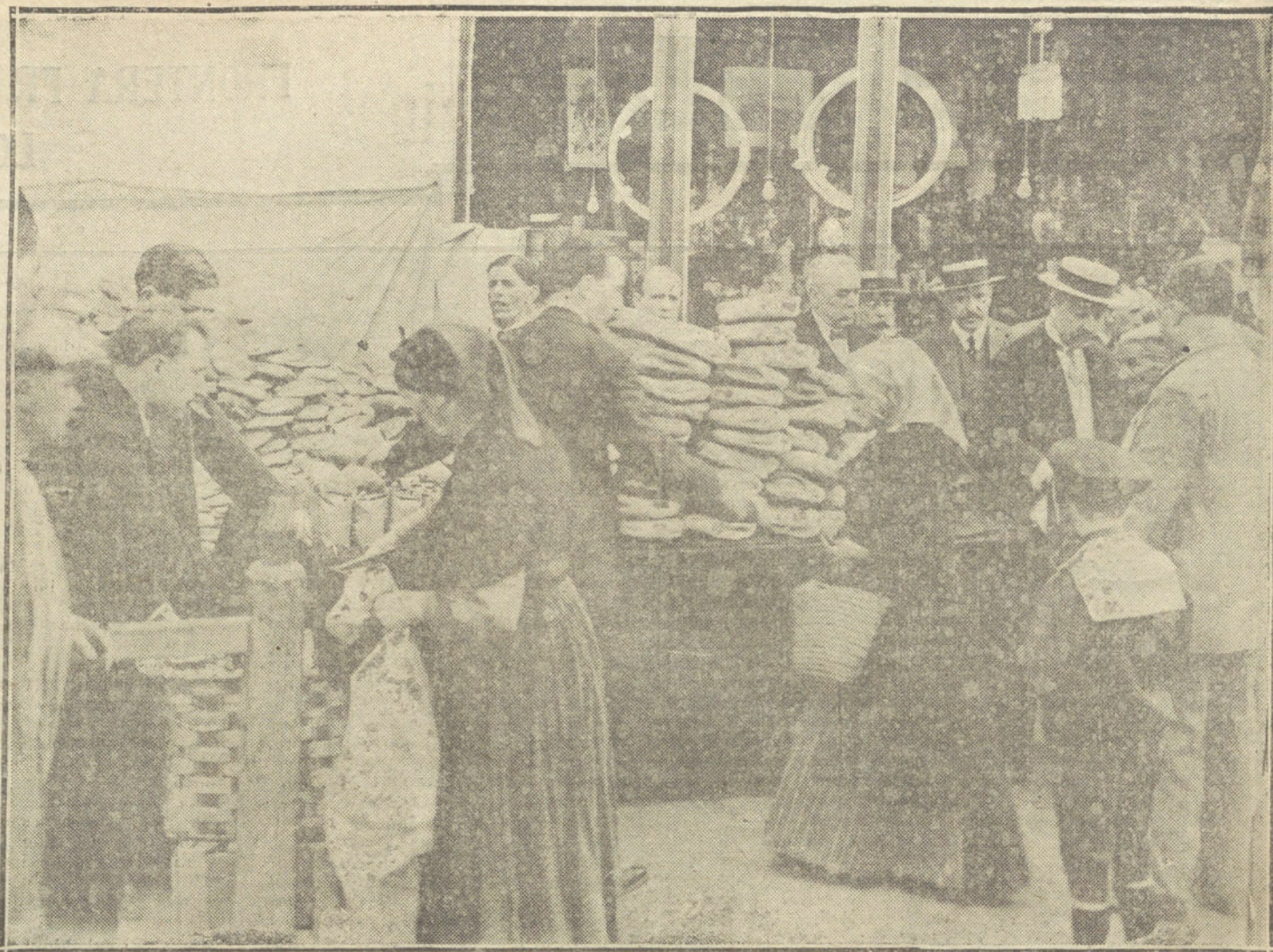
LA VERBENA DE LA PALOMA.—El alcalde de Madrid presidiendo el reparto de pan á los pobres, verificado con motivo de las fiestas de la Paloma.

Así que tuvo conocimiento de lo acaecido se trasladó el Juzgado de guardia al sitio de la ocurrencia, y procedió á la práctica de las diligencias preliminares, yendo después á la Casa de Socorro para ver si el herido podía prestar declaración, cosa que no pudo conseguir, por el estado de gravedad en que, como decimos antes, aquél se hallaba.