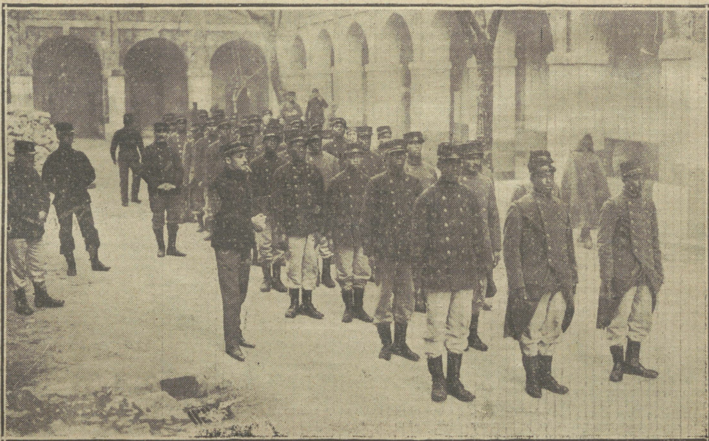
LA GUERRA EUROPEA.—Tropas senegalesas del ejército francés, que han sido movilizadas.

El tren sale de la estación de Bayona, lento, majestuoso, entre aclamaciones frenéticas: «¡Viva Francia!... ¡Viva el Ejército!...»—gritan millares de gargantas. Los hombres agitan sus boinas, las mujeres nos envían besos, y el fervido amor á la Patria se hace luz y llanto en los ojos, y palidez en las mejillas. Todas las portezuelas de los vagones ostentan banderas tricolor-