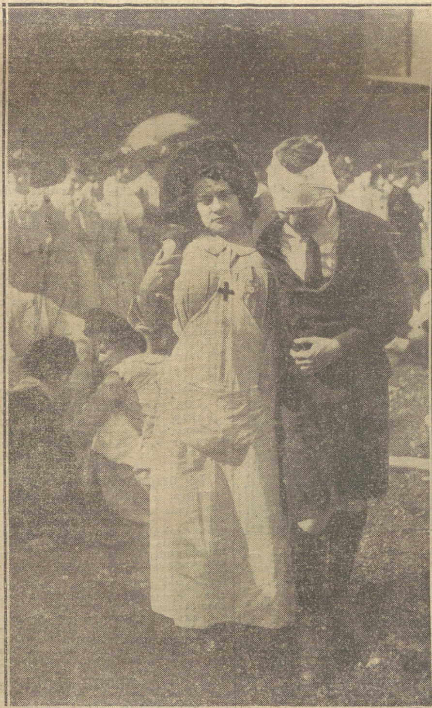
LA GUERRA EUROPEA.—Damas francesas de la Cruz Roja asistiendo á los paisanos heridos en la ambulancia provisional de Belfort.