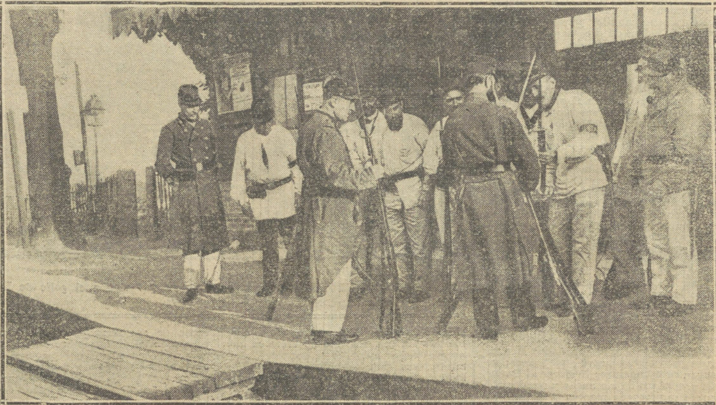
LA GUERRA DESDE PARIS.—Una estación de la línea de Versalles custodiada por las fuerzas territoriales francesas, en la que figuran los soldados mayores de treinta y cinco años.

¿Qué caracteres revestirá de ahora en adelante la guerra? El ataque de Rusia, con el empuje de sus legiones inacabables, será furioso. Los serbios, refugiados en sus montañas, casi inaccesibles (Serbia es un desfiladero entre dos cordilleras), esperarán. Montenegro, cuyo puerto de Antivari han bombardeado los austriacos, toma represalias bombardeando a Cattaro, y eriza sus montañas, inexpugnables, fortalezas naturales, de soldados. Austria tendrá que resistir el alud ruso, y se debilita sus líneas frente a Serbia y Montenegro, los pequeños pueblos balkánicos bajarán a las