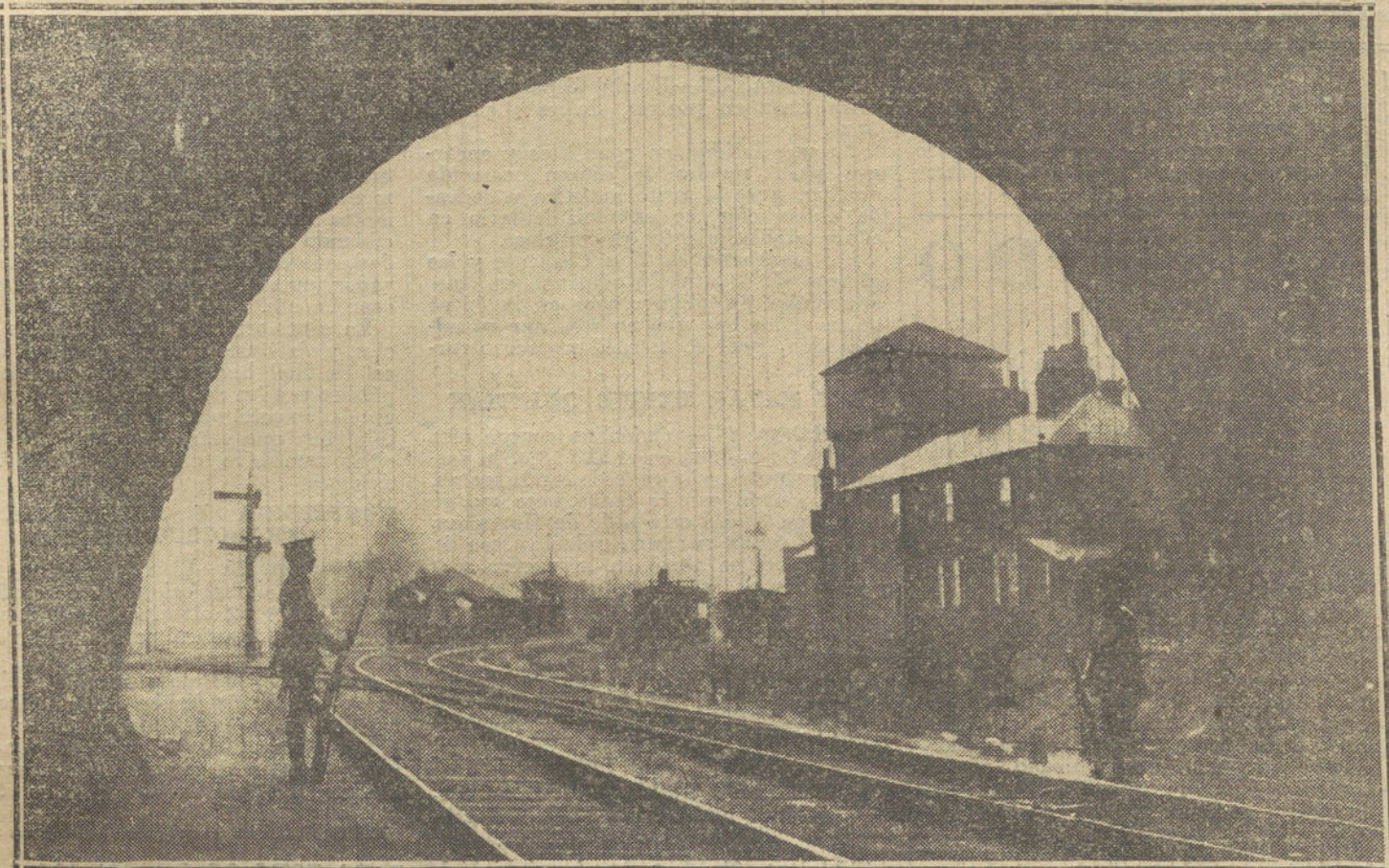
GUERRA DESDE LONDRES.—El túnel de la línea de Londres á Douvres vigilado por la Infantería inglesa.