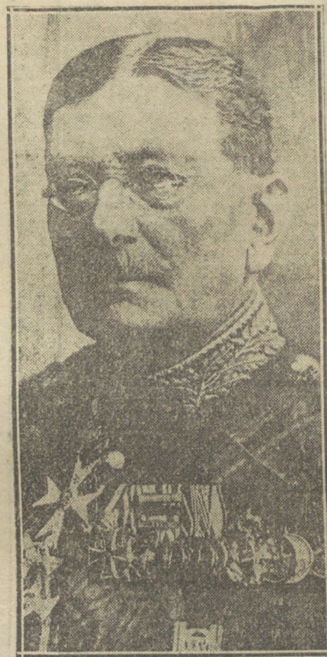
El mariscal alemán Von der Goltz, que ha sido nombrado por el Kaiser gobernador general de Bélgica.

PARIS. Continúan llegando a esta capital convoyes de heridos franceses que