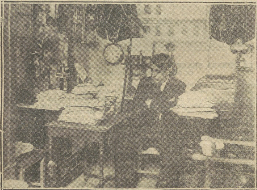
Enrique Chicote en su despacho, rodeado de montones de obras nuevas, que le han ofrecido para esta temporada.

Isidro jura y perjura que es inocente; no obstante lo cual, ha ingresado en la cárcel.