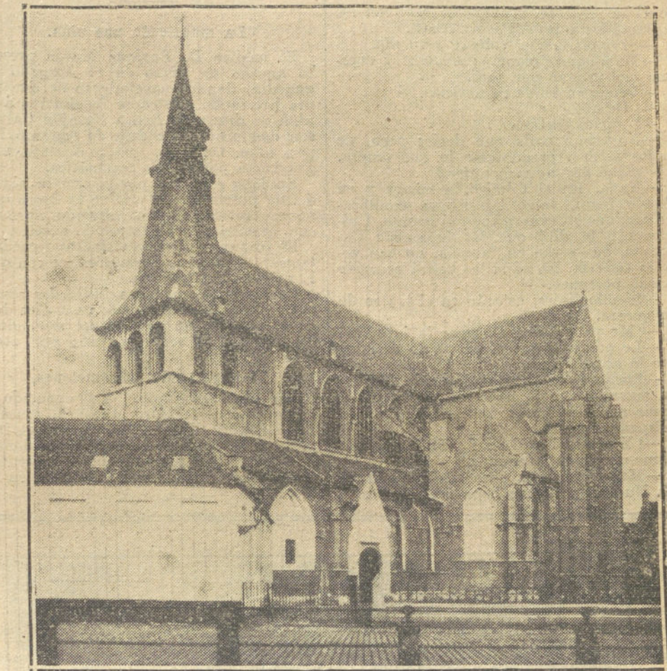
LA GUERRA EUROPEA.—La iglesia de Santiago, de Lovaina, ciudad belga que ha sido totalmente destruida por los alemanes.

entre Francia y Alemania, han sido de preparación, y cuando se piensa en la dificultad de movilizar millones de hombres con la enorme impedimenta que sigue á un ejército, se ve que el plazo ha sido corto para tan gran trabajo. Al principio de las operaciones se decía que las tropas alemanas iban con una lentitud exagerada, y de ahí se deducía que iban al fracaso. Ahora se ha visto que apenas terminada la acumulación de tropas alemanas en los puntos señalados y escogidos por su Estado Mayor, el avance es rapidísimo y violento, pues en menos de seis días, desde que se apoderaron de Lieja, los alemanes han invadido toda Bélgica, excepto la pequeña parte del