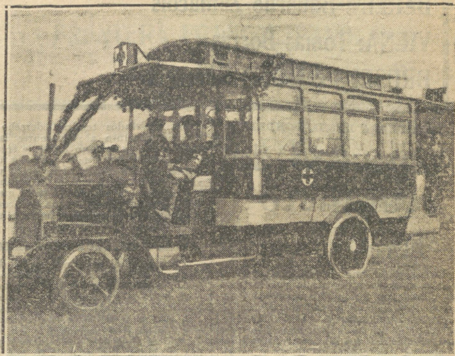
LA GUERRA EUROPEA.—Un automóvil de la Cruz Roja alemana engalanado con follaje, dirigiéndose a las avanzadas.

de más, pues perdí el conocimiento, y hay quien me asegura que pasó por encima de mí la Caballería, y si no me aplastaron fué, sin duda, que la Virgen que llevaba yo en el pecho en un escapulario hizo un milagro, que no olvidaré jamás.