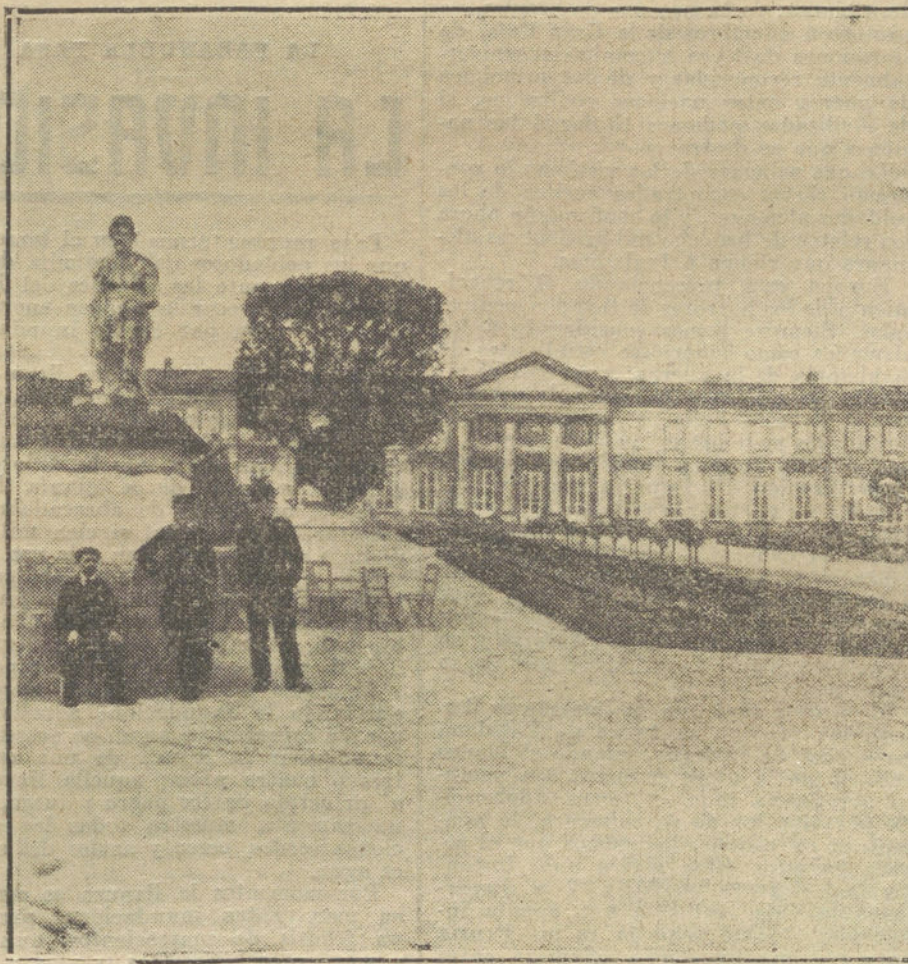
El famoso castillo de Compiègne, ciudad francesa muy próxima a París, ocupada por el ejército alemán. Ayuntamiento de Madrid

Palcos, 4 pts.; butaca, 0,50; general, 0,20