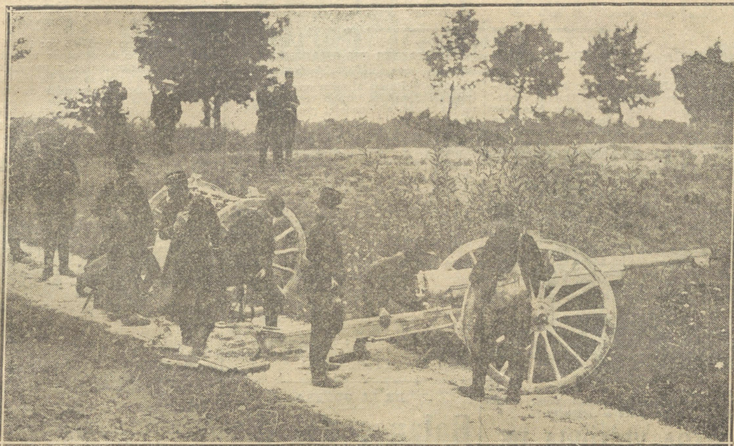
LA GUERRA EUROPEA.—Emplazamiento de una batería francesa en la línea de combate.