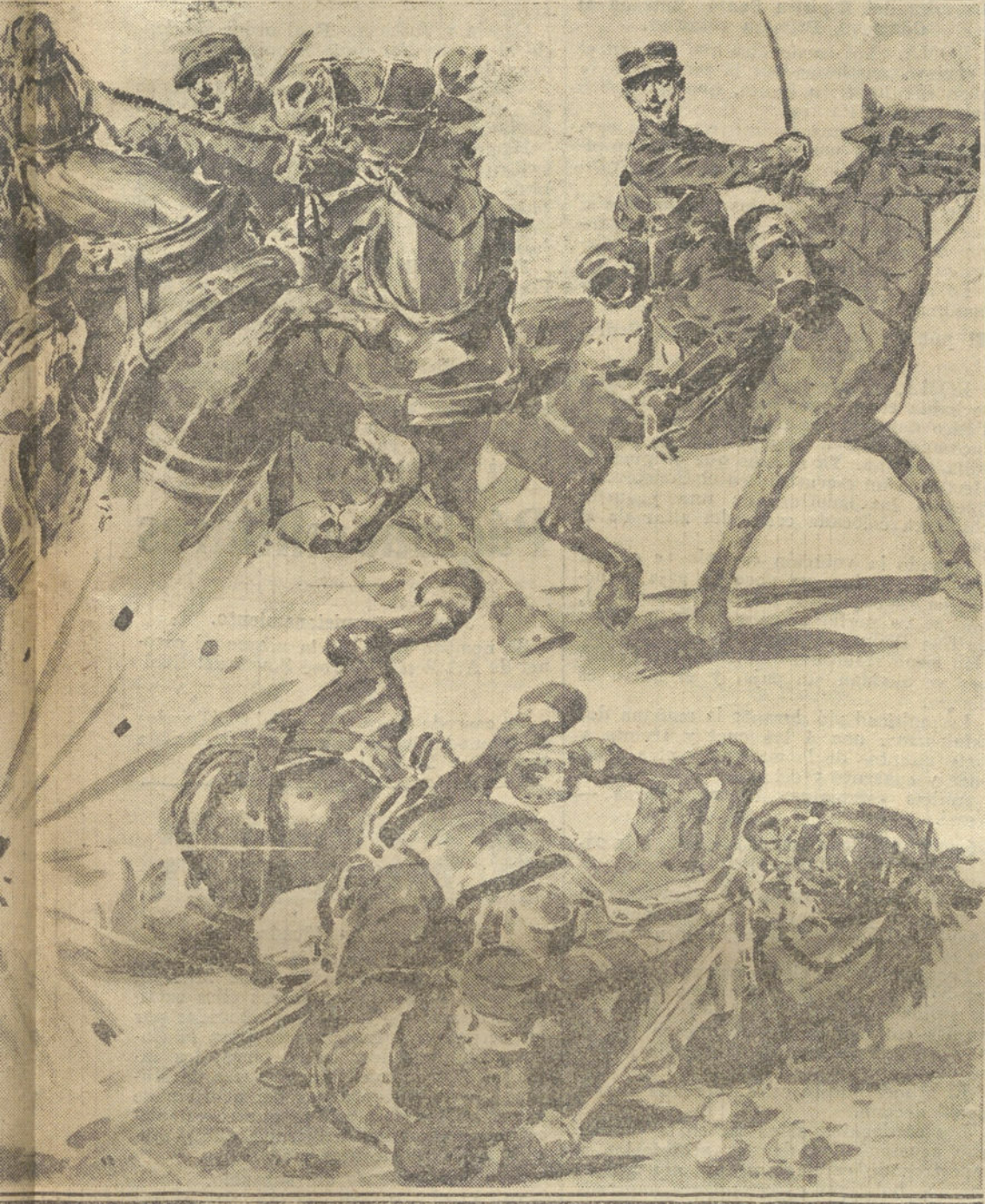
CAMPO FRANCES. (Composición de AGUSTIN)

belga ha emprendido hacia el interior de Francia.