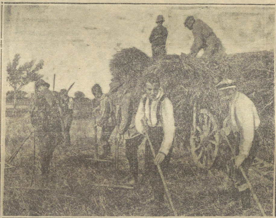
LA GUERRA EUROPEA.—Estudiantes alemanes empleados en las labores del campo, en sustitución de los labradores que han marchado a la guerra. (Fotografía HAMBURGER FREUDEMBLANT)

La longitud de nuestras trincheras era muy grande, y puedo asegurarte que veía, al mirar, más hombres en el suelo que en pie. ¡Cuántos había heridos y estaban condenados a morir allí, sin que nadie pudiera ampararles! De repente siento un golpe en el lado izquierdo de la cara; miro a mi alrededor, y veo que han caído cinco o seis de los que estaban más cerca; se revuelcan en el suelo; están heridos; me llevo la mano a la cara y me siento todo mojado; es sangre, y caliente; me había alcanzado un casco de granada; me siento desfallecer; no puedo con el fusil; siento la Caballería alemana, que se echa encima; quiero levantarme y no puedo; no tengo fuerza en las piernas; a mi alrededor nadie se mueve; los pocos que quedaban vivos han recibido orden de retirarse; aquí ya no me acuerdo