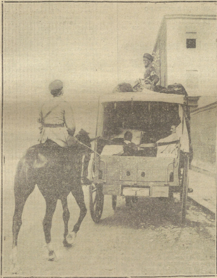
LA GUERRA EUROPEA.—Llegada de convoy de heridos franceses al puesto militar de Amiens.

Durante estos últimos días, el enemigo trató de desembarcar por el río Mosa, con fuerzas considerables; pero mediante un vigoroso contraataque ofensivo fué rechazado y tuvo que volver a pasar el