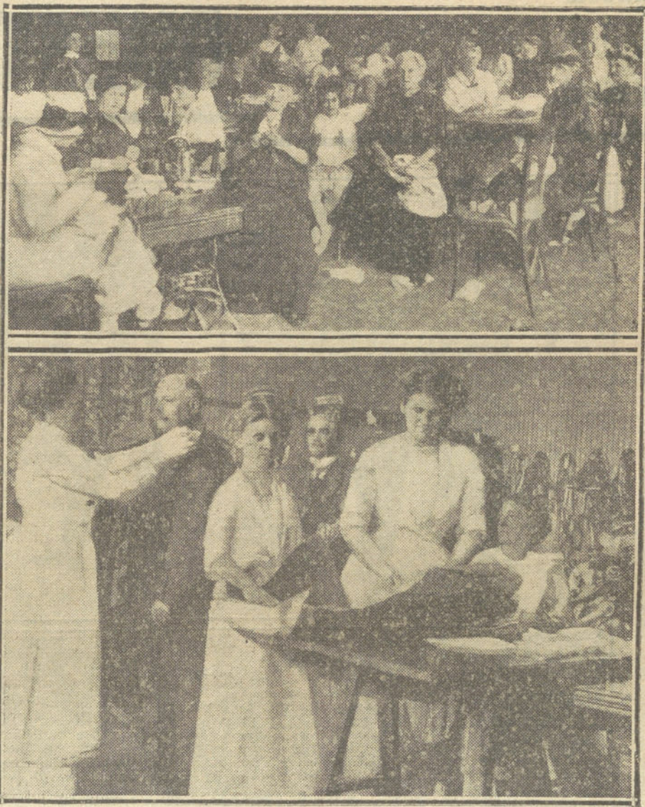
LA GUERRA DESDE BERLIN.—Damas de la aristocracia berlinesa cosiendo vendajes en un taller improvisado.—Debajo, un taller de uniformes, en los últimos días de la movilización.

Decía antes que militarmente era posible la neutralidad con tal de que fuese respetada por los extraños; pero económicamente, ni con respecto ni sin él es posible esa neutralidad. En efecto: alguien lo ha dicho ya; económicamente, somos país beligerante, padecemos todas las consecuencias que se derivan de una interrupción súbita en las corrientes mercantiles. Es esta una consecuencia del cambio operado por el progreso material y el desarrollo del tráfico en el mundo. A medida que la civilización se ha hecho más alta, la interdependencia económica de los países se ha hecho más compleja; el mundo se ha repartido el trabajo, y esta división del trabajo, tan beneficiosa para los intereses de la civilización en las épocas normales, impide que ninguno de los pueblos consagrados a separadas ramas de la producción pueda sustraerse a los estragos que una contienda u otra anomalía produzca en cualesquiera de las partes del organismo económico solidario. Claro es que esta perturbación puede ser mayor o menor, según la disposición de ánimo que, con respecto al país neutral, adopten los demás pueblos, muy en especial aquellos con quienes son más íntimas sus relaciones económicas. Porque éstos, así como en las épocas normales, por su sola hostilidad, aun circunscripta al orden económico, pueden producir en el interior de otro país que no sea financieramente preponderante gravísimas crisis, en momentos anormales pueden