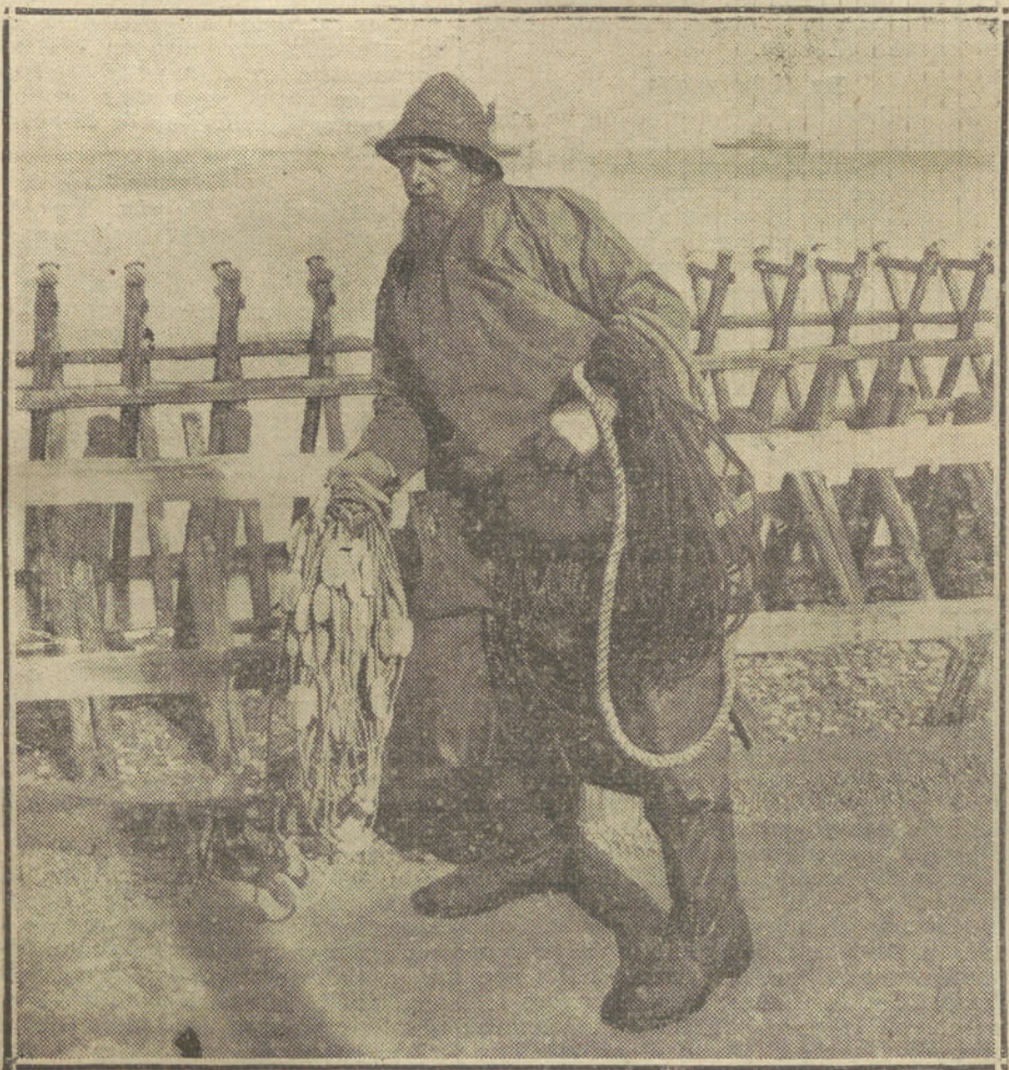
Un desceñor de la isla de HELIGOLAND