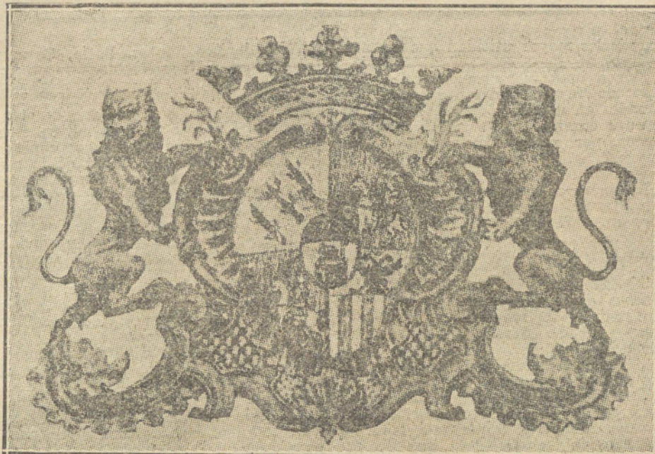
Escudo de la familia Della Chiesa.