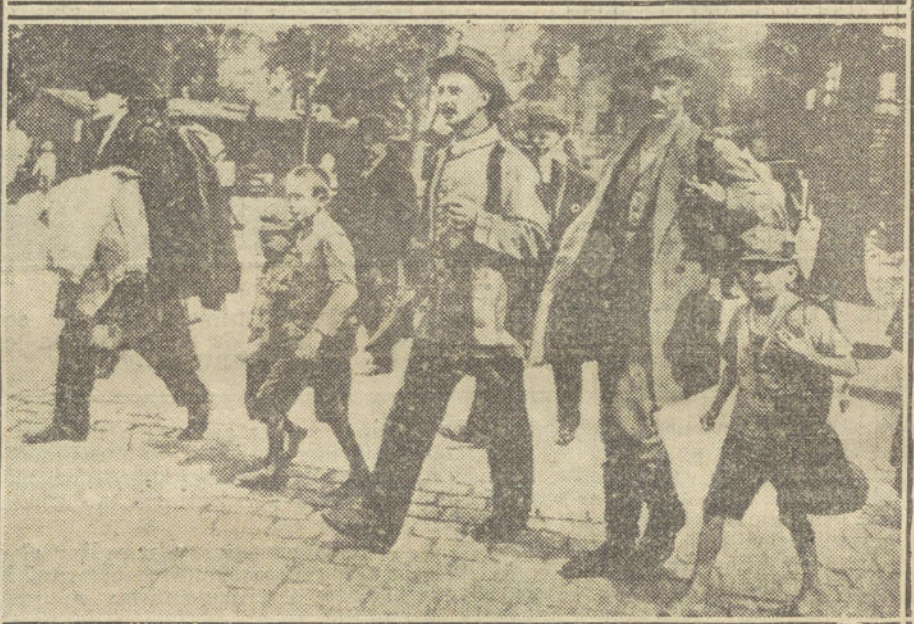
LA GUERRA DESDE BERLIN. —Detalles de la movilización: Un soldado, acompañado de sus hijas, dirigiéndose á la estación para marchar á la campaña.—Debajo, grupo de reservistas alemanes con sus hijos, marchando á incorporarse.

El champagne picoteaba en nuestras lenguas, que se desataban en una frívola charla. Con los prismáticos hacíamos una requisa de bellezas... Todo era de buen tono y amable en aquellas tardes templadas del otoño... Y el aeródromo nos dejó una grata estela de recuerdos.