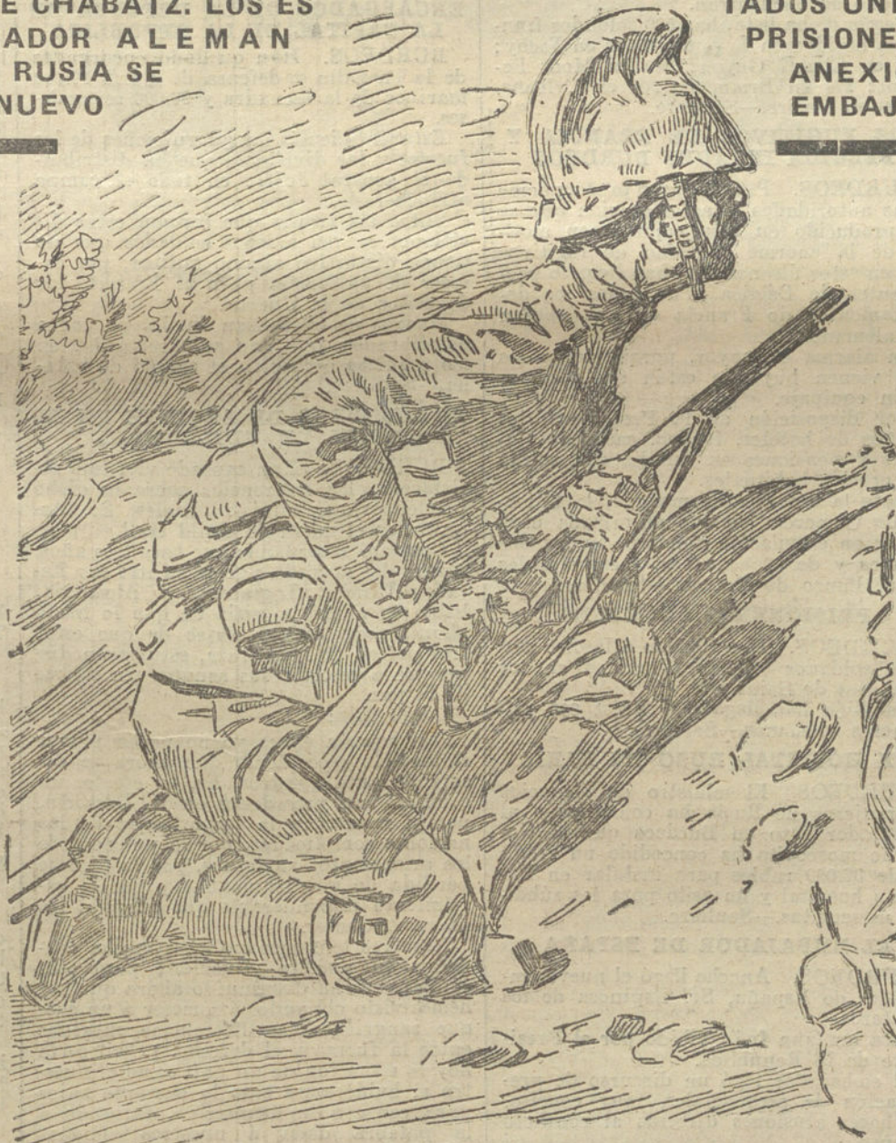
DRAGONES FRANCESES combatiendo pie á tierra.

A pesar de su enorme población industrial, y aunque los negocios estén comple-