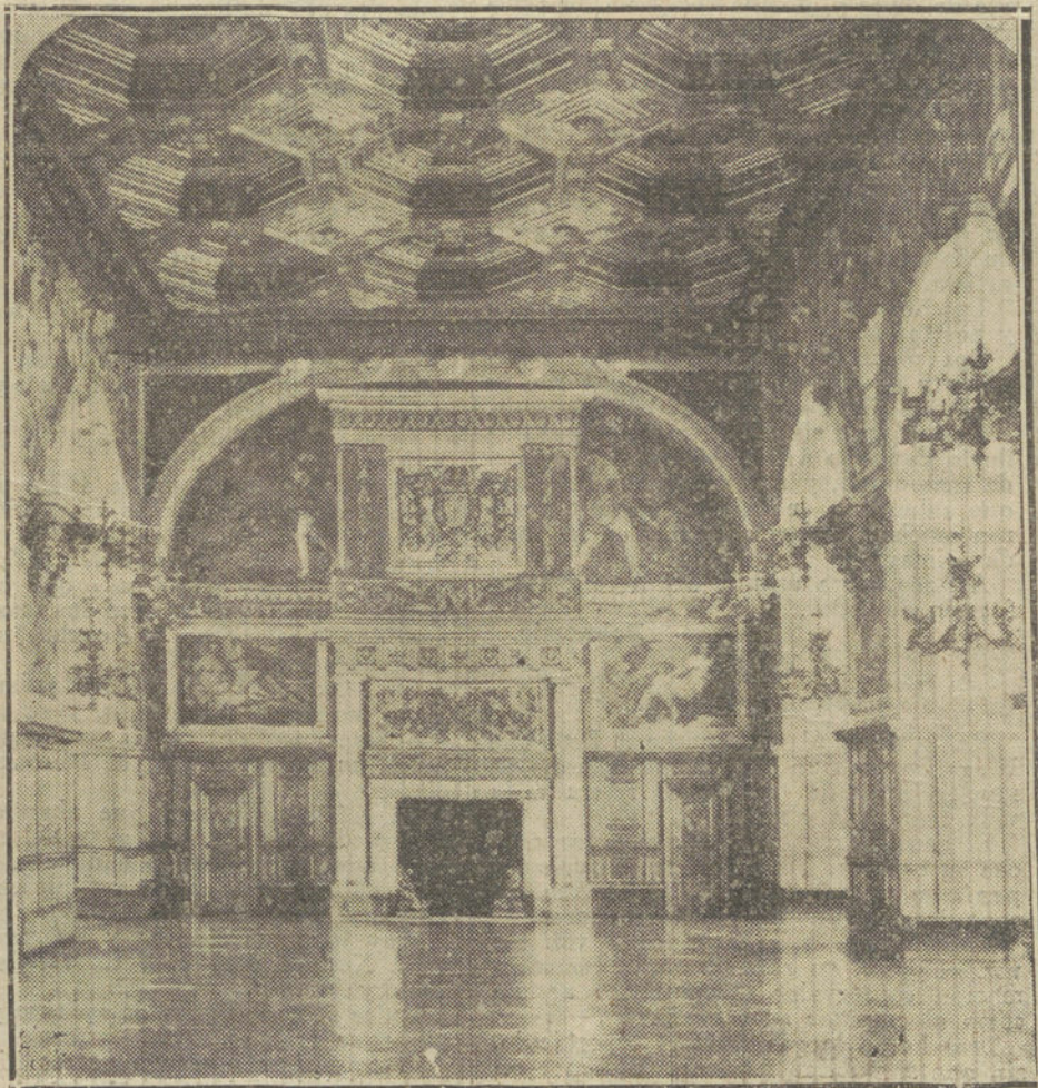
Galería de Enrique II, del Palacio de Fontainebleau, villa próxima a París, hacia donde se han replegado las fuerzas francesas

Fuerzas de la Guardia civil procuran mantener el orden.