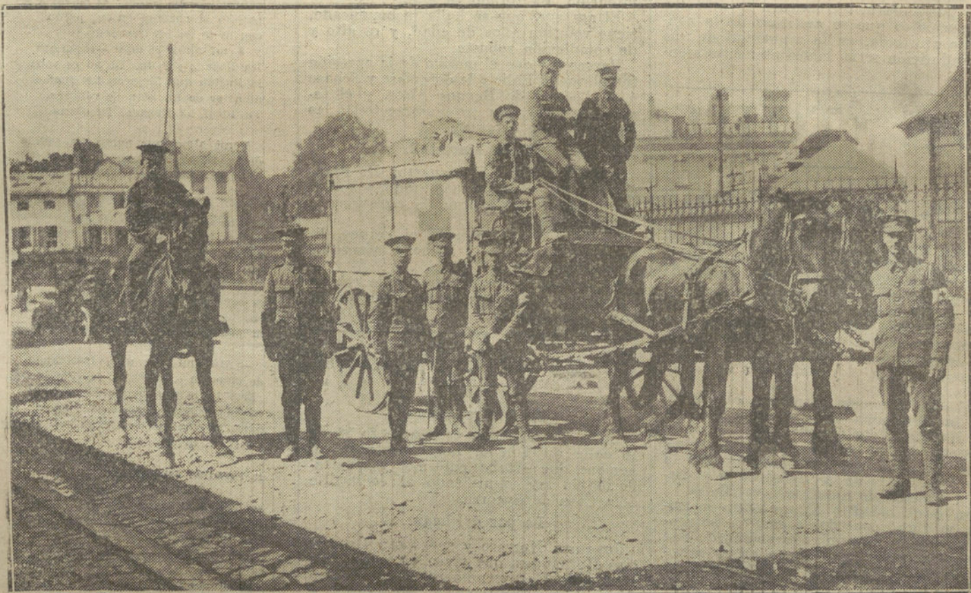
LA GUERRA EUROPEA.—Un coche de las ambulancias sanitarias inglesas en las cercanías del puesto militar de Amiens

Tiene dos agujeros rojos en un costado.»