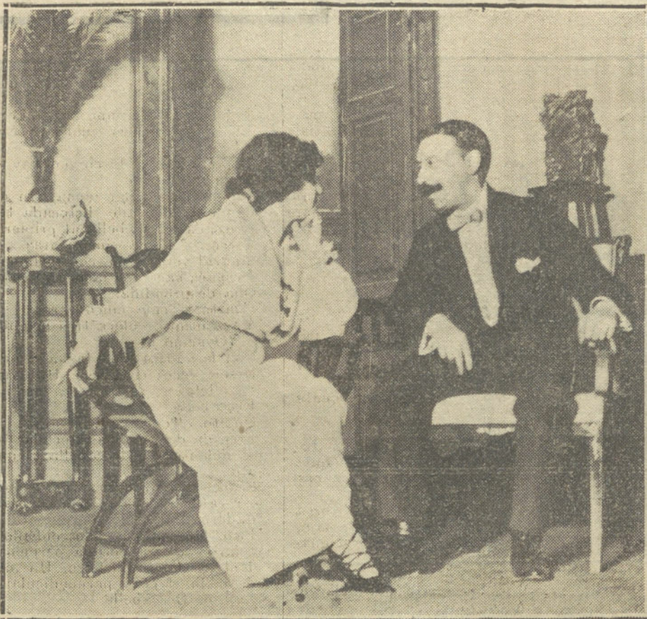
En la señorita Palou y el Sr. García Ortega en una escena de «Las pasajeras», obra estrenada ayer en el teatro de Eslava.