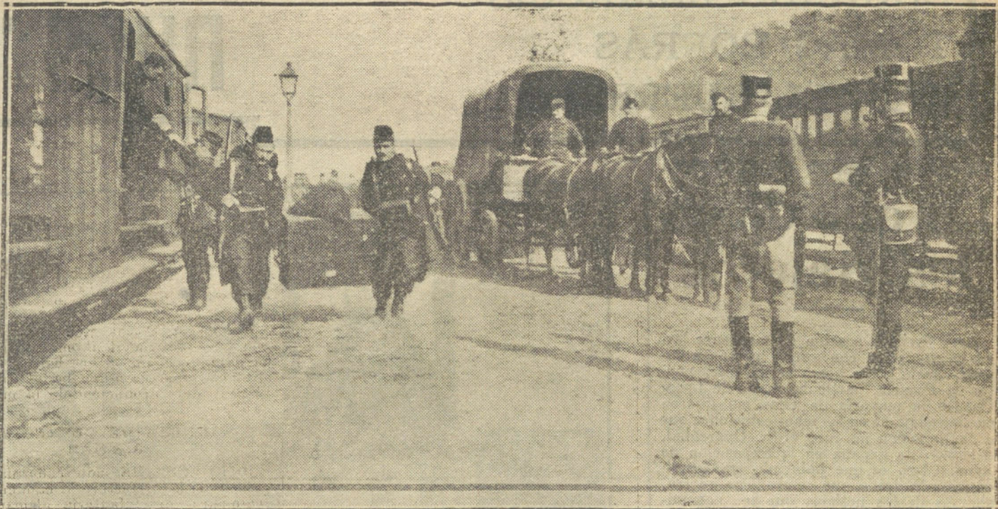
LA GUERRA EUROPEA.—Fuerzas austriacas al montar en un tren, en la estación de Viena, para marchar á la frontera rusa.

Su Santidad Pío X, de grata memoria, se dignó conceder á cuantos habiendo confesado y comulgado visiten en este día á la Santísima Virgen en su advocación de la Almudena, «indulgencia plenaria», aplicable á las almas del Purgatorio, rogando por las intenciones de Su Santidad. Nunca como ahora, que el autor de este gran beneficio acaba de pasar á la presencia del Señor, cabe so pida por la Santa Sede.