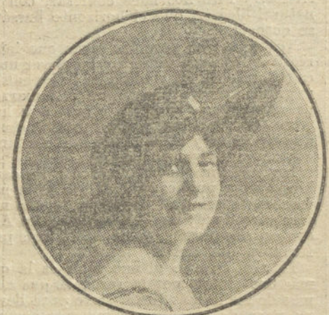
La popular artista CHELITO, que debuta mañana con su compañía en el salón Chantecler.

Los viernes son los días designados por la Empresa para los estrenos de obras nuevas.