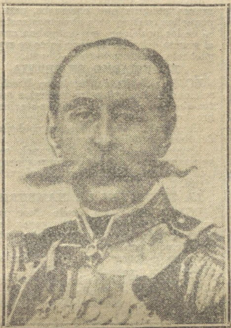
El general austriaco VICTORIO DANKL, que manda las fuerzas que se han replegado en las batallas de Galitzia.

Como no había nadie en las oficinas, y era la segunda vez que esto ocurría, el Juzgado ordenó, en vista que no tenía