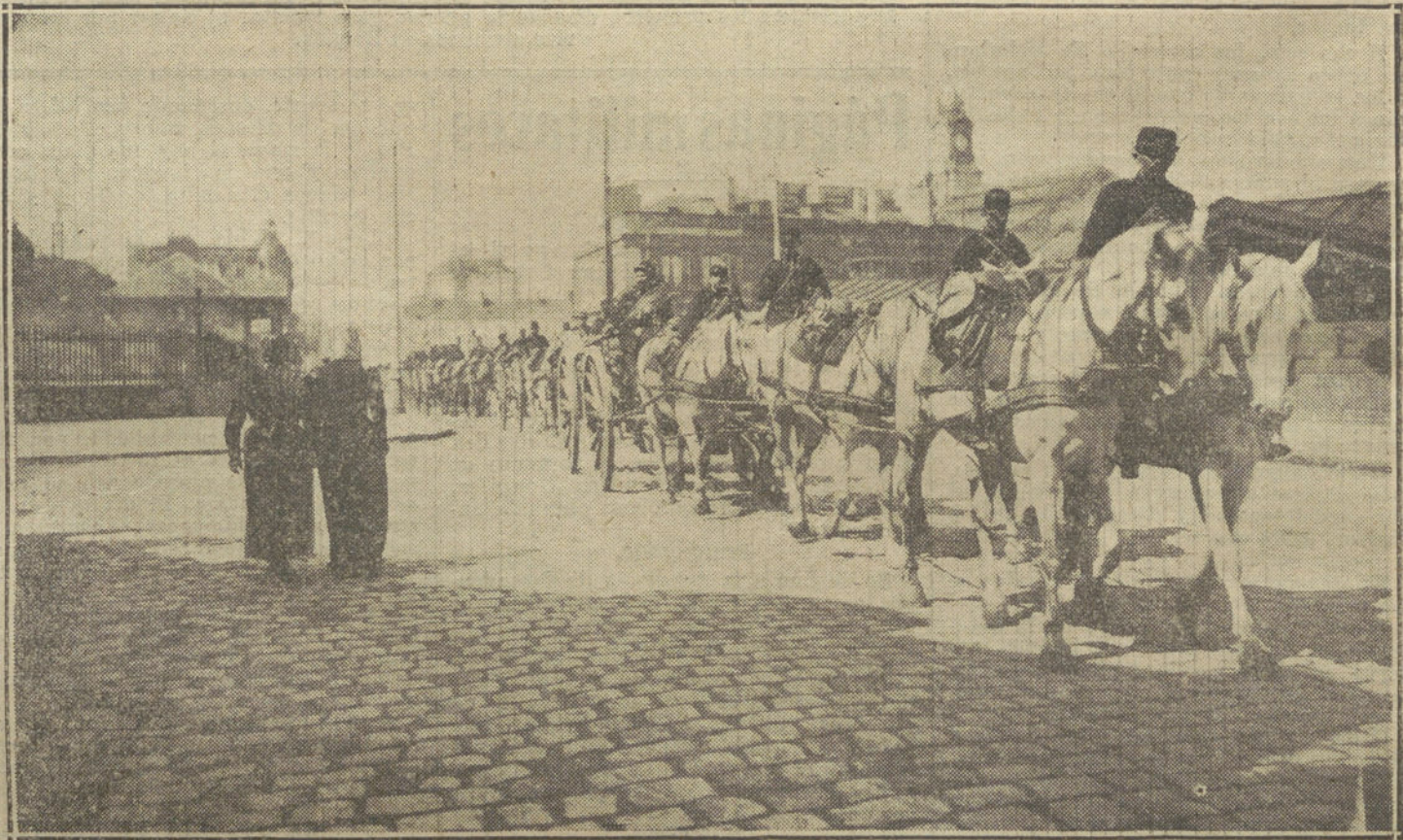
LA GUERRA EUROPEA.—Fuerzas de Artillería francesa saliendo de Reims, para dirigirse á la línea de fuego