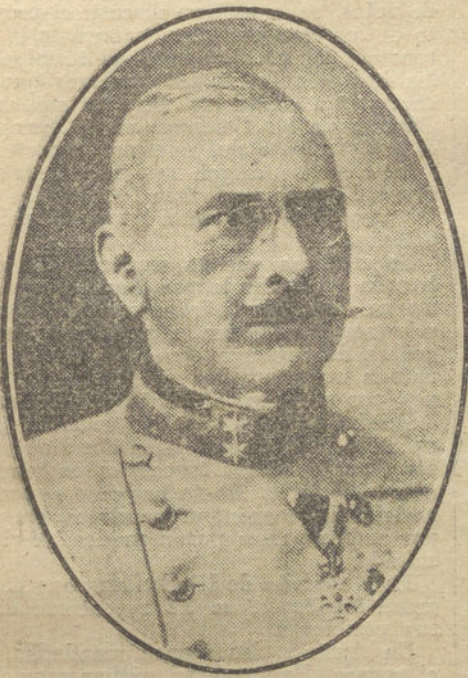
El general ruso RENNENKAMF, que manda las fuerzas que se han replegado en la Prusia oriental.