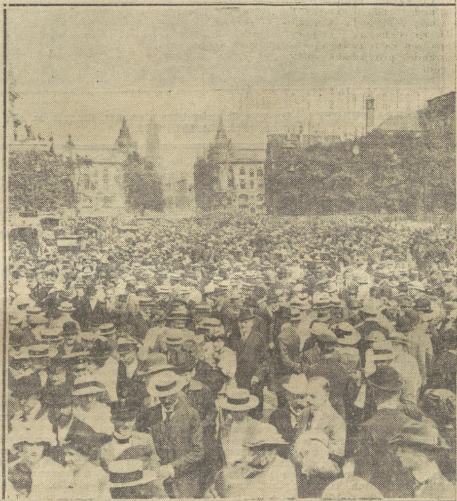
ENTUSIASMO POR LA GUERRA EN BERLIN.—La multitud, ante el Palacio Imperial, en los primeros días de la guerra, para felicitar al Kaiser por las victorias alemanas en Bélgica.

El tren que nos vuelve a Madrid arrastra una larga hilera de coches. Al frente de ellos va una locomotora brillante, brúñida, que tira del negro engranaje del convoy, empuñada de humo, lanzando a las veces el alarido de su silbato, estridente y bullanguero. En una de las estaciones nos hemos acercado a contemplarla. Es grande, imponente. Hay un sordo fragor en sus entrañas. Por los flancos sale un humillo blanco y tenue. El fogonero, un hombre negro y fantasmal, ha abierto la portezuela del hogar, hurgando en las entrañas del fuego, que ha dejado caer sobre su rostro un rojo reflejo infernal. Nosotros miramos ingenuamente la maniobra, y el hombre ne-