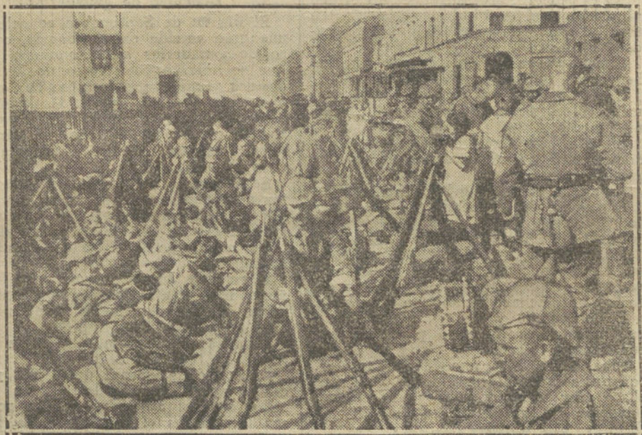
LA GUERRA EUROPEA.—Tropas alemanas acampadas en una calle de Lieja.

Hemos vivido unos días de inquietud desesperante. Los doctores aseguran que la inquietud es el resultado natural de la incertidumbre, y que, además, es el más peligroso de los enemigos de nuestros espíritus. En efecto, la escasez de noticias y la alta tensión que hemos venido experimentando ante los persistentes rumores de ataques victoriosos frente á París, y de cambios de táctica por las fuerzas del Kaiser, han sido causa de múltiples conjeturas atormentadoras y llegaron momentos en que los más optimistas decayeron en ánimo. Ese rápido avance de las legiones del Kaiser, y la no menos veloz retirada de las fuerzas anglofrancesas, fomentaron la desconfianza y el temor iniciados al retirarse los ingleses de su posición de Mons. La pasividad é indecisión de los aliados constituyeron un enigma que difícilmente inten-