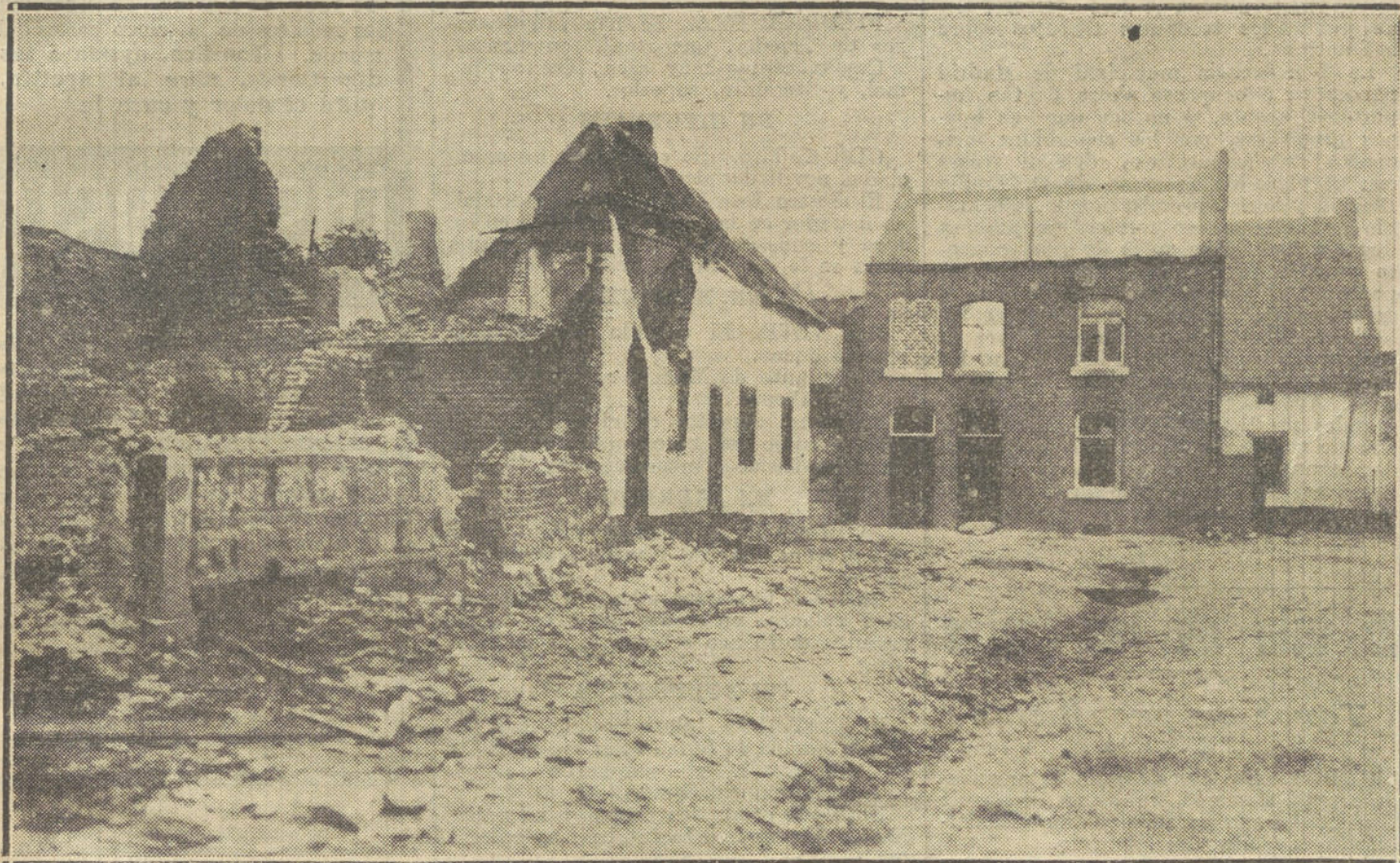
LA GUERRA EUROPEA.—Aspecto de una calle de Moulain, después del bombardeo de la Artillería alemana.