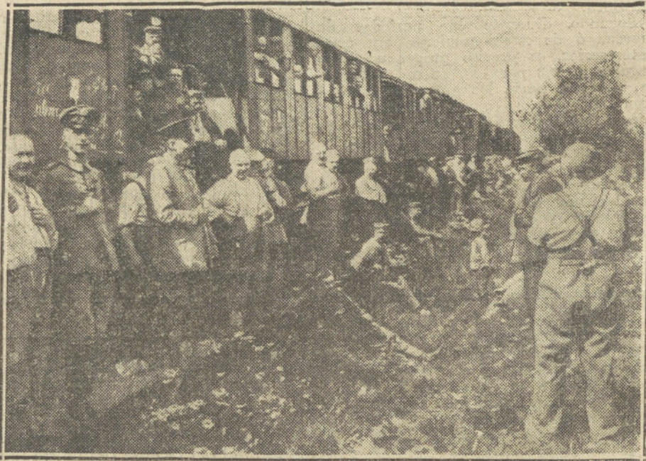
LA GUERRA EUROPEA.—Un tren de reservistas alemanes, durante un alto en la marcha.

Ahora todo el mundo se las echará de pillín, asegurando que nunca pensó que los alemanes tuvieran intención de entrar en París, y dirá: «Pero ¿qué iban a hacer en París? Con tomar París sabían que la guerra no terminaba, y que, en cambio, quedaban intactos los ejércitos de Joffre, mientras ellos se paseaban por los Campos Eliseos. Entrar en París habría sido un triunfo sentimental, pero nada práctico.» Esto lo dicen ahora los famosos técnicos, porque han visto palpablemente que el general von Kluck tiene otro objetivo mucho más importante y más eficaz que la entrada en París al compás de la «Marcha de parada». Mas, ¿por qué no lo dijeron antes? ¿Por qué el general Joffre no hizo antes lo que ahora ha intentado, en vista del plan alemán?