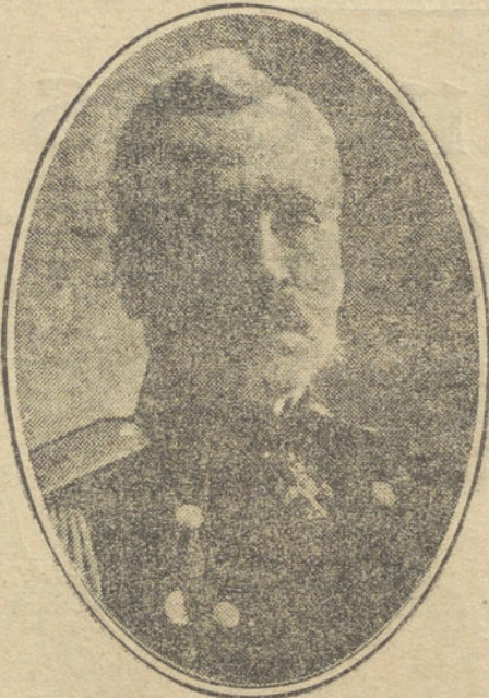
El general ruso JILINSKY, comandante del Cuerpo de Armada de Varsovia.

Los alemanes se replegaron en desorden hacia Termonde.»—Chovil.