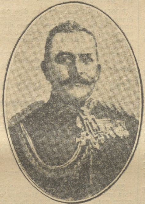
El general VON EMMICH, jefe de las tropas alemanas que operan actualmente en territorio belga.

«Al entrar en Pernambuco el vapor «Blucker» la tripulación alemana se fijó en un marinero suizo, al que tomaron por francés, y creyendo que era espía lo detuvieron y apalearon brutalmente. Los pa-