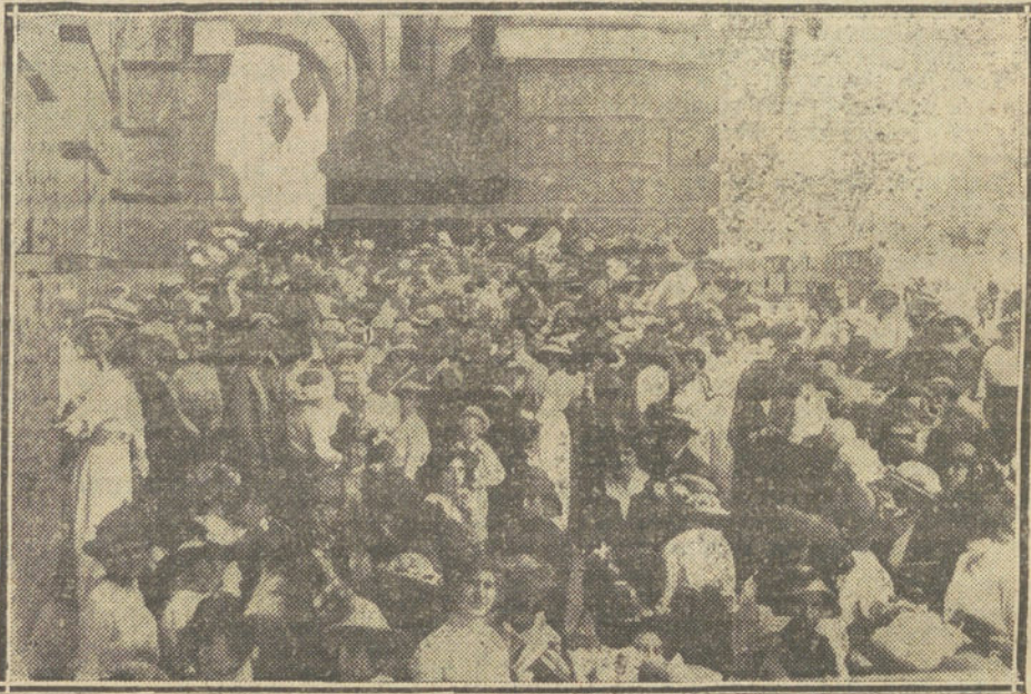
LA GUERRA EUROPEA.—Grupo de damas alemanas esperando turno á las puertas de las oficinas de la Cruz Roja de Berlin, para inscribirse como enfermeras en las ambulancias de campaña.