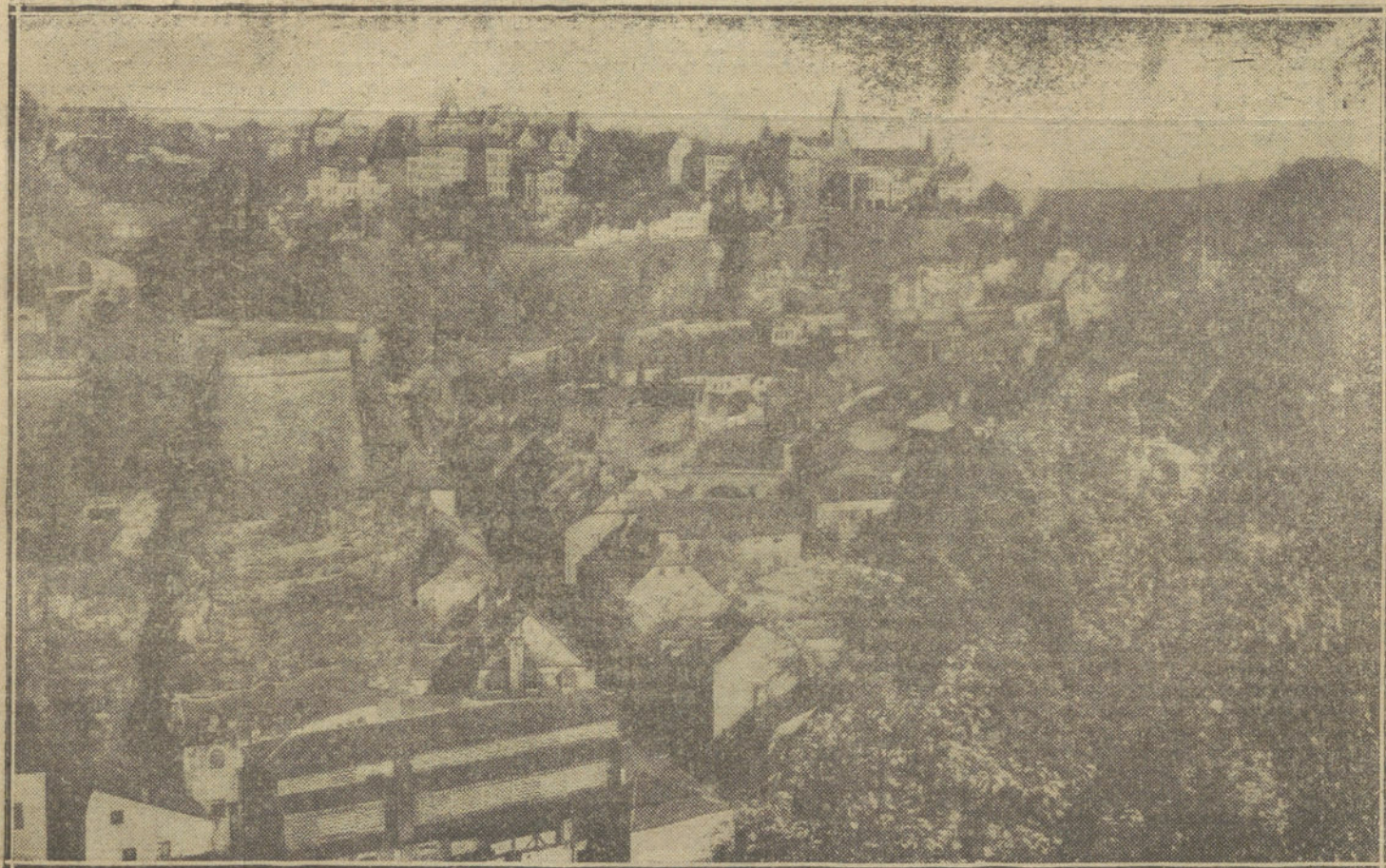
Vista general de la capital del Luxemburgo, donde actualmente se encuentra el Kaiser dirigiendo las operaciones de guerra.

Los socios podrán matricular en estas asignaturas á sus hijos y á sus familias, de tres á siete de la tarde.