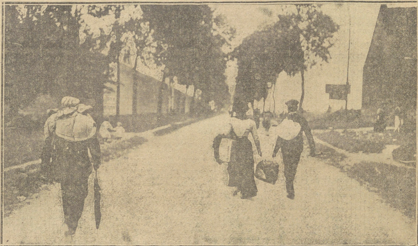
LA GUERRA EUROPEA.—Vecinos de Termonde huyendo hacia Amberes.

Pero este Cuerpo había sido el cebo puesto por los serbios para distraer la atención del ejército austriaco. Mientras, silenciosamente, otro ejército serbio pasaba penosamente el Sava, entrando en territorio del Imperio. Organizado, marchó por columnas, internándose a la izquierda de Semlin, plaza fuerte de importante guarnición. Cuando tuvieron al Sur Semlin, los serbios dieron media vuelta y atacaron la ciudad por el único lado desapercibido, por el lado de Hungría. La sorpresa fué seguida de una importante victoria. Semlin cayó