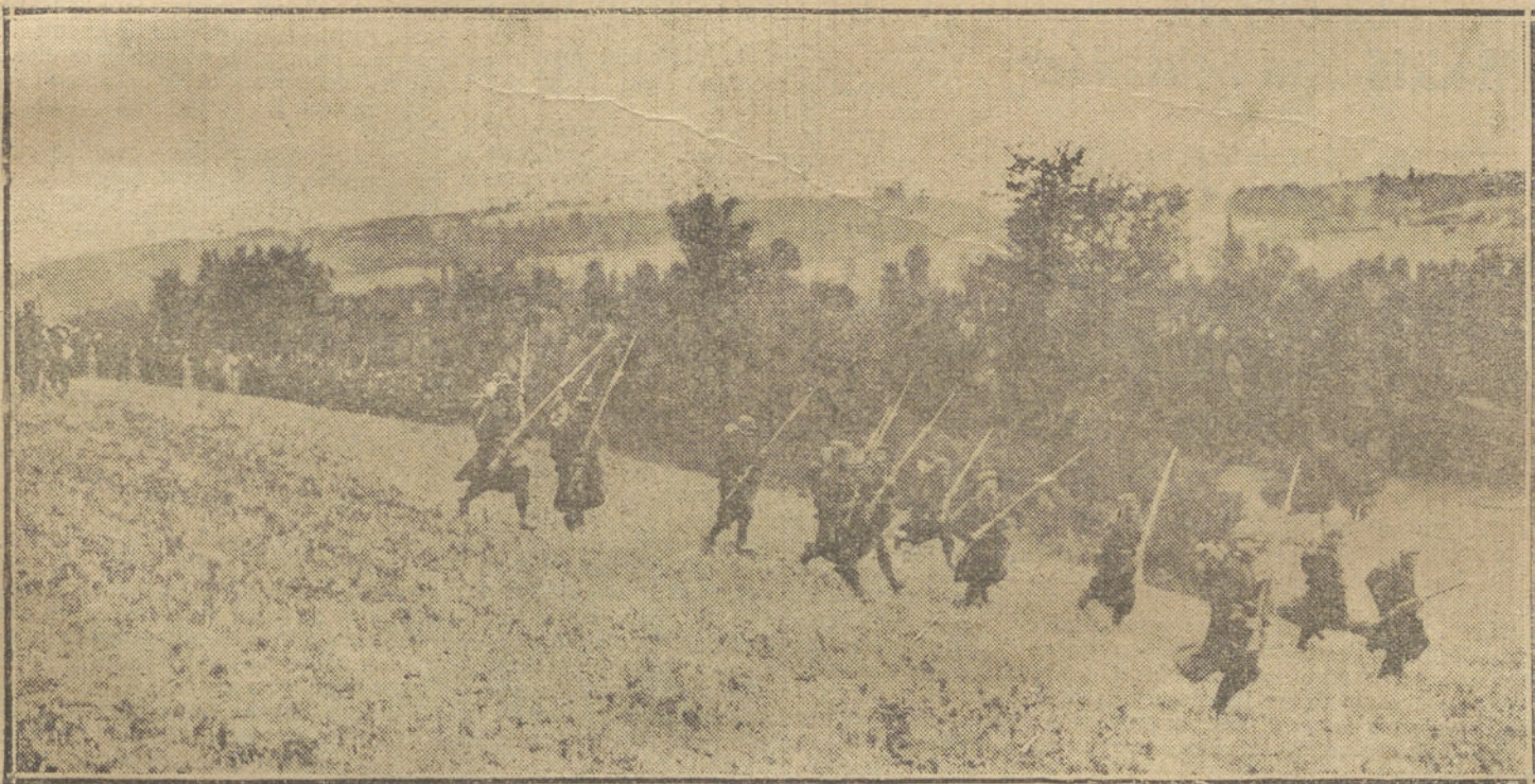
LA GUERRA EUROPEA.—Infantería francesa durante un avance en las proximidades del Marne, por Chateaux Thierry.

La producción de trigo para la fabricación de pan importaba en los cinco últimos años 16 millones de toneladas, mientras que los 68 millones de habitantes solamente necesitan unos 12 millones de toneladas, y las siembras, ni 1 1/2 millones de toneladas.