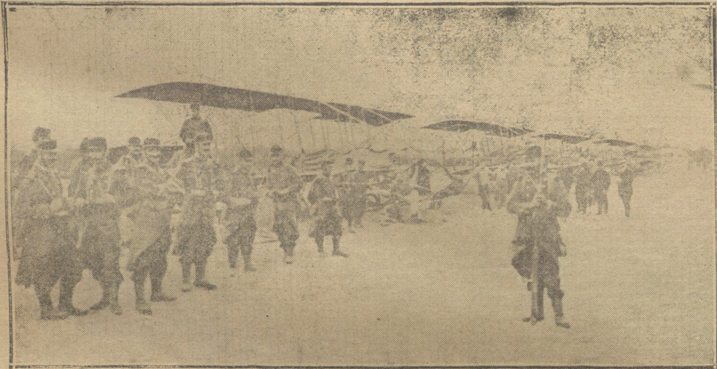
LA GUERRA EUROPEA.—Flotilla de aeroplanos franceses en un campamento de las cercanías de París, disponiéndose á evolucionar.