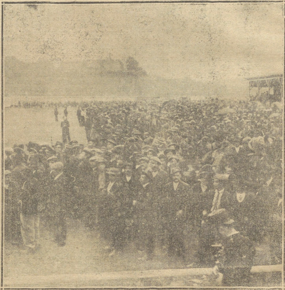
LA GUERRA EUROPEA.—Reparto de víveres en el hipódromo de Basilea á los fugitivos de los países beligerantes.

La provincia de Champagne, la más rica provincia de Francia, gracias á la cual pudo la República pagar pronto y con sorpresa de Bismarck los cinco mil millones en el año de 1870, es el campo donde se libran hoy todas las grandes batallas entre alemanes y aliados. Los ricos viñedos pletóricos de perlas doradas al sol de Agosto, han quedado convertidos en campos de desolación, en inmenso cementerio de millares de hombres. Este