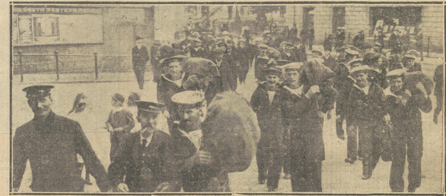
LA GUERRA EUROPEA.—Marinos de la escuadra inglesa en las calles de Londres, disponiéndose á embarcar con rumbo á los campos de batalla.

El objetivo ruso era Leopoli, capital de la Galitzia, plaza fuerte, clave de la marcha sobre el sector occidental, inmediata á un ferrocarril estratégico que comienza en su Norte, en Rawa-Ruska, y sigue á Cracovia-Taraow, Jaroslán y Belz-el-Sokal. El comienzo de la conquista de estas ciudades, y consiguientemente de su ferrocarril (todo lo cual abría el paso de