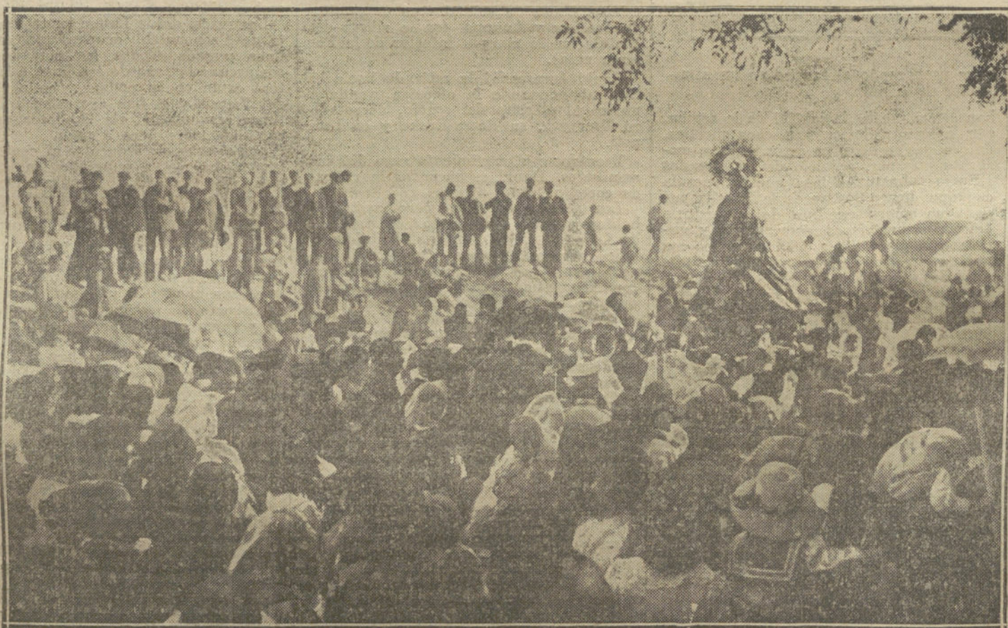
LAS FIESTAS DE VALLECAS.—Procesión verificada ayer tarde para trasladar la imagen de Nuestra Señora de La Torre desde la iglesia parroquial á su santuario.

Habiendo surgido algunas dudas sobre una noticia que han publicado los periódicos acerca de los soldados de cuota, han confirmado hoy en el ministerio de la Guerra que en el Consejo de ministros