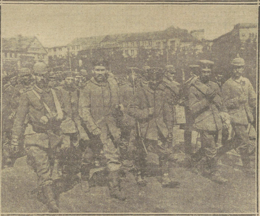
LA GUERRA DESDE BERLIN.—Los cañones cogidos á los rusos en los primeros combates de la Prusia oriental, al ser conducidos á la plaza del Palacio Imperial, de Berlín.—Debajo, heridos alemanes convalecientes, regresando al campo de batalla á incorporarse á sus regimientos.

blo bastan para demostrar que hoy más que nunca se trata de una guerra nacional para Francia. La Historia nos enseña que un pueblo, impulsado por ese patriótico sentimiento, llega á desplegar una extraordinaria energía.