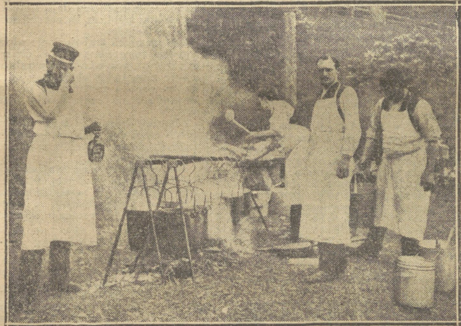
LA GUERRA EUROPEA.—Soldados franceses preparando el rancho en un campamento de las cercanías de Aís.

Pero los rusos no se dieron por vencidos. Desde los puntos de concentración de su Polonia les enviaban constantemente refuerzos. El batallón que caía era sustituido inmediatamente por otro. El regimiento, la división aniquilada, dejaba plaza á un núcleo fresco del interior, que entraba en fuga.