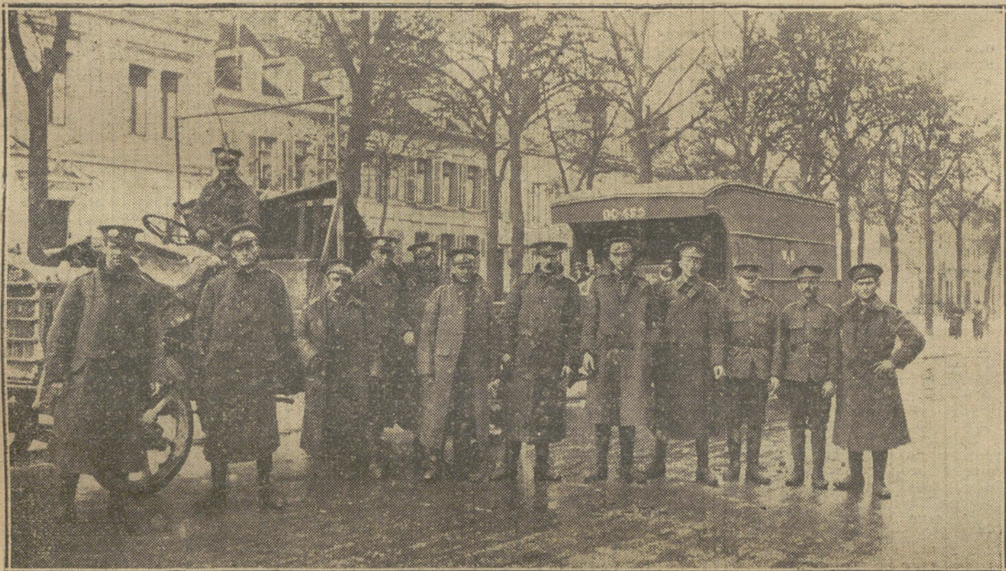
LA GUERRA EUROPEA.—Automóviles del ejército inglés, con el personal correspondiente, en las calles de Boulogne, dispuestos para marchar al campo de batalla.

El ala izquierda rusa fue deshecha en dos días por la acometividad incansable y esforzada de los austriacos. Paso a paso les hicieron retroceder de su tierra, cañoneándoles, envolviéndoles en ráfaga.